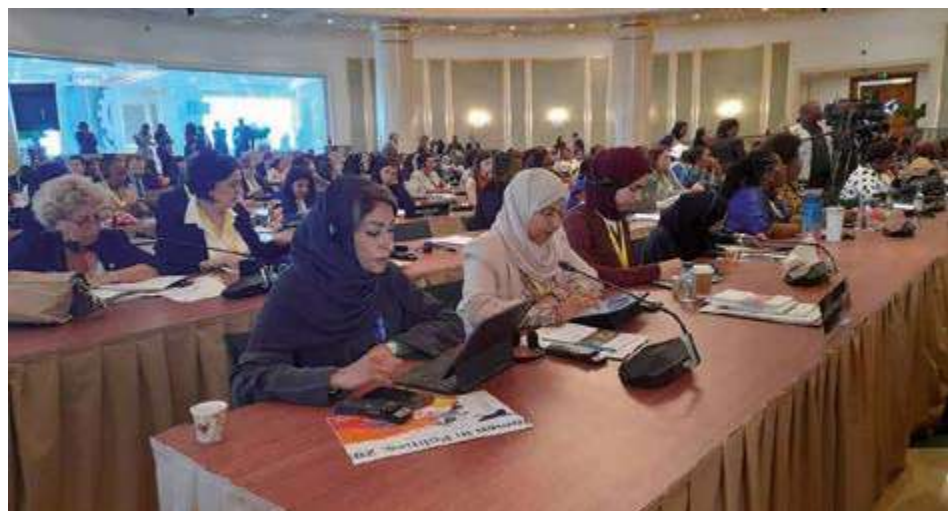
Se abordaron asuntos como la insuficiente presencia de mujeres y jóvenes en las políticas.

Como exhortó el presidente angoleño, João Lourenço, en la inauguración del evento, desde Luanda se escuchó la voz de los parlamentarios del mundo pidiendo el fin de los conflictos.