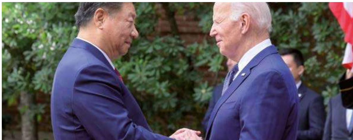
El esperado encuentro entre Joe Biden y Xi Jinping duró más de cuatro horas.

Tras fricciones en escalada del último año, San Francisco fue sitio para el primer contacto entre Biden y Xi justo 12 meses después del sostenido en Bali, Indonesia, en la cumbre del G20.