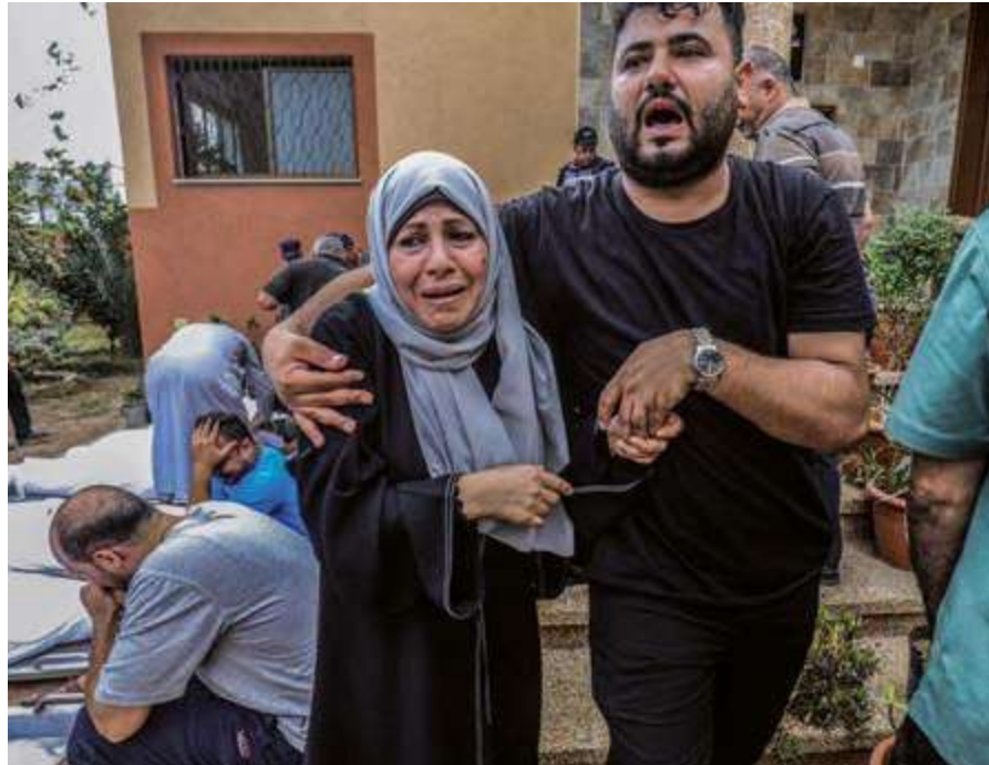
La masacre de Palestina y la coincidente furia natural en Acapulco parecen indicar la urgencia de acciones a favor de la vida.

Es necesario entender que Gaza y Acapulco no son fenómenos ajenos, extraños en sí y para sí