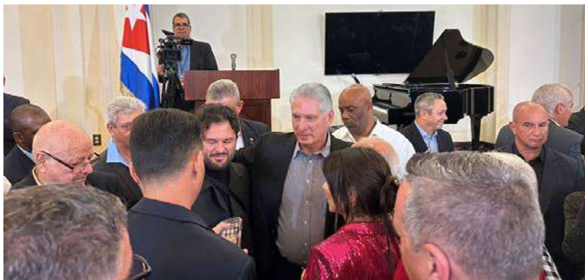
El presidente Díaz-Canel sostuvo encuentros con emigrados y personalidades estadounidenses.

En la Sociedad para Cultura Ética de Nueva York, que lo acogió junto al canciller de Venezuela, Yván Gil, en el evento "Voces de dignidad", Díaz-Canel recordó la impronta de los líderes Fidel Castro y Hugo Chávez, así como la historia de respaldo de las voces dignas del pueblo estadounidense.