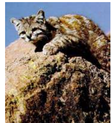
Según creencias, este felino es un nexo entre la vida y la espiritualidad en las alturas andinas.

El gato andino figura en el Libro Rojo de Vertebrados de Bolivia, catalogados "en peligro crítico". A su vez, la Unión Internacional para la Conservación de la Naturaleza lo considera el animal silvestre más en peligro de América y lo sitúa entre los cinco felinos más amenazados en el planeta.