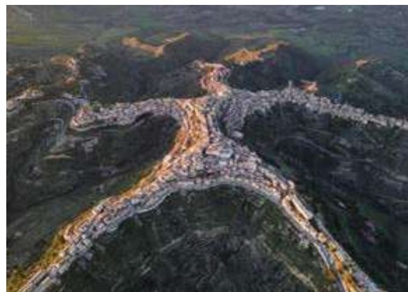
La topografía del asentamiento se fue configurando espontáneamente.

Más tarde quedó en manos de los bizantinos, que se instalaron en el siglo VI, y los cuales permanecieron en el lugar hasta la llegada de los árabes, en el siglo IX. En centurias posteriores la controlaron los normandos, quienes la cedieron a los angevinos y a continuación pasó a los aragoneses.