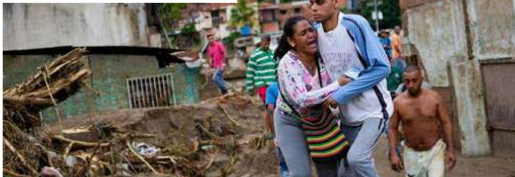
Tres de cada 10 habitantes de la región han sufrido los desastres provocados por eventos naturales.