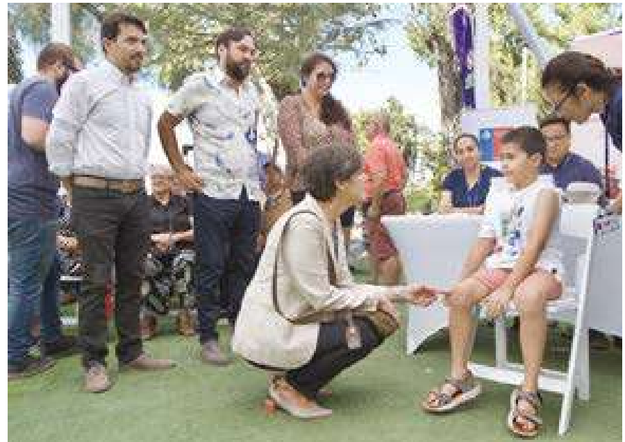
La experiencia de la Covid 19 indica la prioridad de perfeccionar los sistemas de salud

También resaltaron lo indispensable de incorporar una perspectiva de género al diseñar los SNS, considerando los requerimientos específicos de las mujeres y las niñas, con miras a lograr la igualdad.