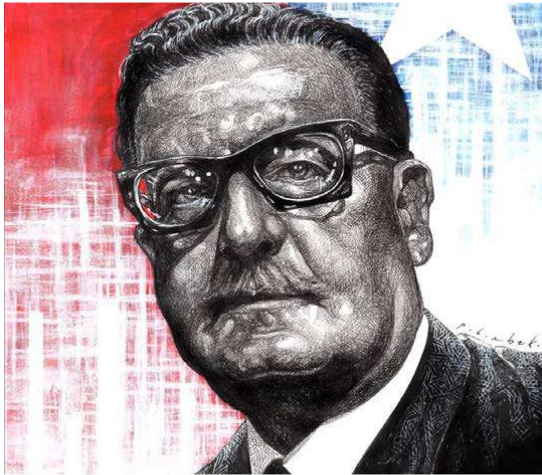
Boris Teillier Espinoza

H an pasado 50 años de aquel estremecedor 11 de septiembre de 1973, que puso fin al primer intento de construir el Socialismo por la vía electoral. Chile, país ubicado en el sur del continente americano, cuenta con una de las riquezas marítimas más grandes del continente por su extensa costa, además de una importante y diversa riqueza mineral; principalmente cobre, litio, salitre, carbón, y otros recursos naturales. Este largo país, después de décadas de luchas, logró un 4 de septiembre de 1970 llevar a la Presidencia de la República al primer presidente socialista de la historia, como resultado de una rica tradición de luchas del movimiento obrero, campesino y estudiantil. Lucha que no estuvo exenta de masacres y traiciones; pero aun así, en esa inolvidable fecha; el pueblo chileno y los trabajadores por medio de la alianza política de la Unidad Popular que aglutinaba a partidos marxistas, como el Partido Comunista y el Partido Socialista e incluso sectores cristianos proclives a las ideas de libertad y justicia social, lograron lo impensable.