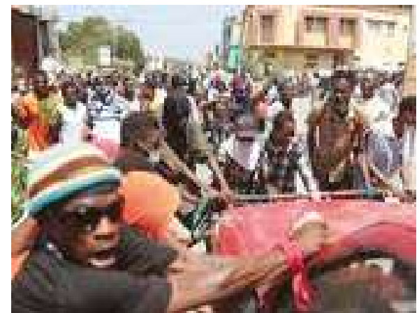
Las autoridades llaman a la población a movilizarse para preservar la paz en los barrios.

En las últimas semanas, los ataques de grupos armados contra Carrefour Feuilles, en la periferia de Puerto Príncipe, obligaron a más de 5 000 personas a abandonar sus viviendas y convertirse en refugiados internos.