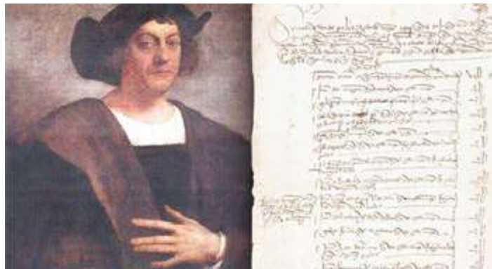
El documento se encontraba en poder de un coleccionista estadounidense.

De acuerdo con una nota del Comando de Carabineros para la Tutela del Patrimonio Cultural, la operación que posibilitó el hallazgo y devolución de este documento se inició en 2012 y corrió a cargo de un grupo de trabajo del cuerpo policial especializado.