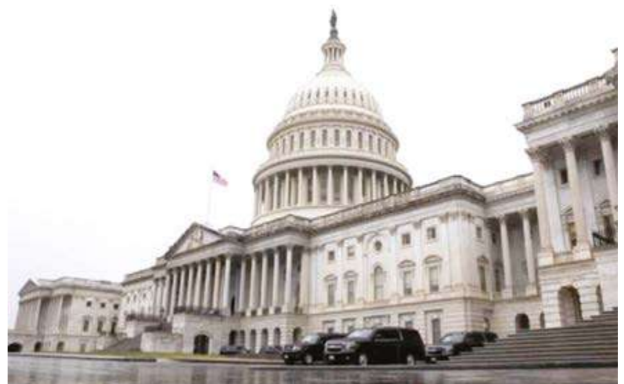
La polémica puede llevar al cierre parcial del Gobierno antes del 1ro. de octubre.

El ala más conservadora de la Cámara de Representantes sostiene que se opondrá a cualquier resolución continua para financiar al Gobierno si persiste el despilfarro de la era de la Covid-19.