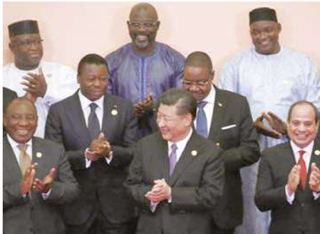
El gigante asiático defiende el multilateralismo y aboga prácticamente por la colaboración en pie de igualdad.

Fuentes oficiales informaron que las mayores inversiones del gigante asiático en el escenario de la IFR están en Somalia, Etiopía, Sudán y Djibouti; en ese último, Beijing erigió su primera base militar de ultramar con el objetivo de garantizar la seguridad regional.