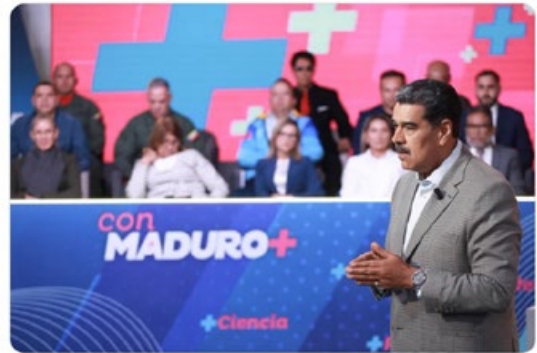
4:31 p. m. · 29 ago. 2023

Los soldados y las soldadas de la FANB le han dado una respuesta contundente a los golpistas que pretenden atentar contra la soberanía Nacional. Venezuela seguirá con la moral bolivariana en alto, por la defensa de la Constitución y del Pueblo.