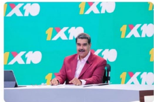
11:45 a. m. · 28 ago. 2023

¿Hemos hecho bastante? Sí, estamos trabajando, pero tenemos que hacer más por la atención de nuestro Pueblo, a través del Sistema 1x10 del Buen Gobierno, con las BRICOMILES y la recuperación de escuelas, liceos y centros de salud. ¡Cumpliremos las metas! Sí se puede hacer más, con mucho esfuerzo, dedicación y amor.