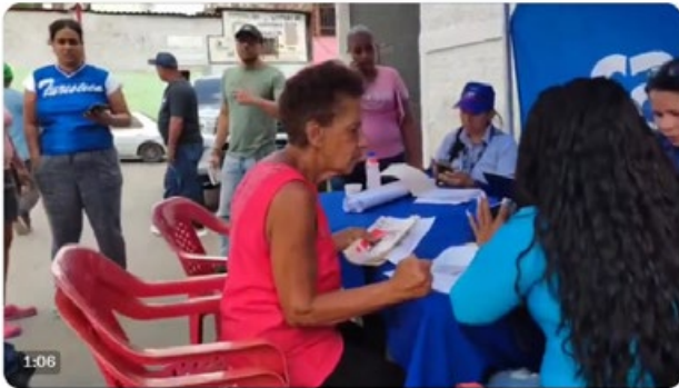
10:50 a. m. · 30 ago. 2023

Mi saludo al Poder Popular de la parroquia La Vega de Caracas, que continúa trabajando en perfecta unión con las instituciones. ¡Soluciones y más soluciones para las familias venezolanas!