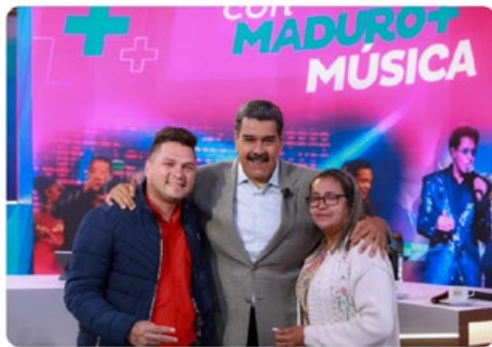
10:29 p. m. · 28 ago. 2023

¡Hay una realidad que no podrán censurar! El pueblo consciente se ha autoconvocado para defender a la Revolución y está en las calles, en cada rincón del país. Desde mis Redes Sociales seguiré mostrando esta realidad, los llamo a unirse y a romper la censura. ¡Defendamos la Verdad del Pueblo!