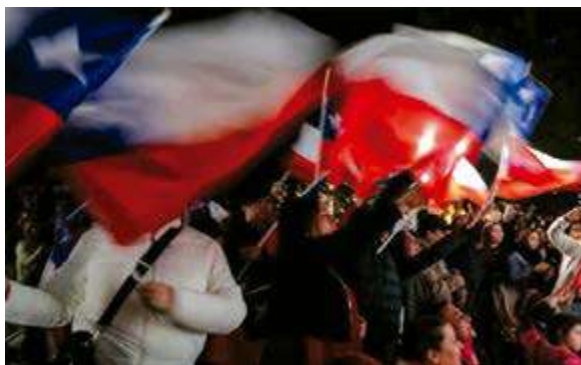
La derecha conservadora dirige un proceso lastrado por el creciente desinterés de la ciudadanía.

Una de las causas de la apatía es la dirección de este proceso a cargo del extremista Partido Republicano, el cual ostenta la primera mayoría, a pesar de haberse negado a integrar el Acuerdo por Chile para alcanzar una nueva carta magna en reemplazo de la vigente desde la dictadura de Augusto Pinochet (1973-1990).