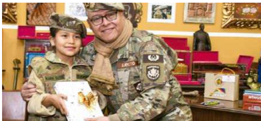
La niña recibió, de manos del comandante general del Ejército, la condecoración Prócer de la Libertad General de División José Miguel Lanza.