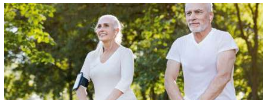
Hasta ahora no se conoce por qué unas personas viven más que otras, aunque los más longevos muestran estilos comunes de vida.

En cuanto a su alimentación, no comían hasta quedar completamente llenos, sino hasta un 80 por ciento de sensación de saciedad. Beber un licor autóctono, vivir en comunidades muy familiares y contar con la ayuda de unos a otros.