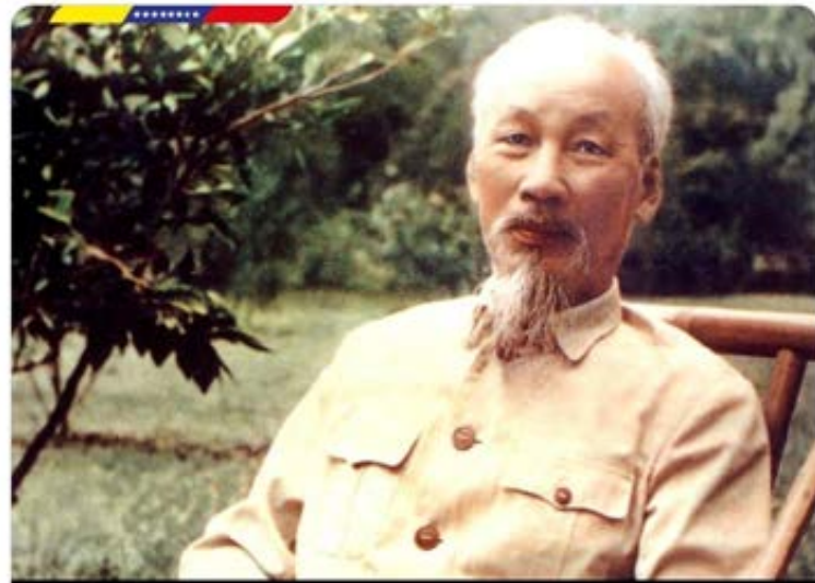
1890 Nace Ho Chi Minh

Celebramos el natalicio del líder revolucionario de Vietnam, el gran Ho Chi Minh. Su ejemplo de resistencia y coraje son faros de luz que iluminan la esperanza de los pueblos del mundo que hoy luchan contra las pretensiones injerencistas del imperio de los EE.UU.