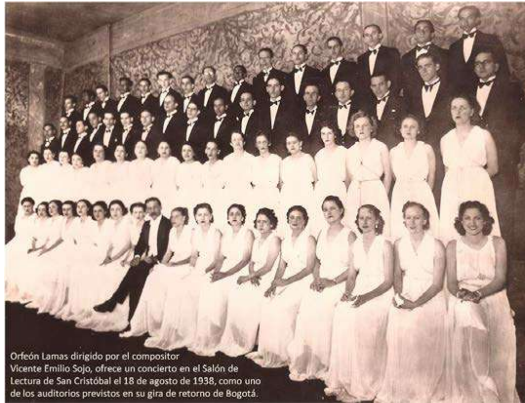
Orfeón Lamas dirigido por el compositor Vicente Emilio Sojo, ofrece un concierto en el Salón de Lectura de San Cristóbal el 18 de agosto de 1938, como uno de los auditorios previstos en su gira de retorno de Bogotá.

José Antonio Calcaño en "La Ciudad y su Música", argumenta que el desarrollo de nuestra música colonial se inicia el año de 1770 y se prolonga hasta el 10 de diciembre de 1814, fecha de la muerte de José Ángel Lamas. Calcaño se refiere al inicio de este proceso ya que un tío de Simón Bolívar, el