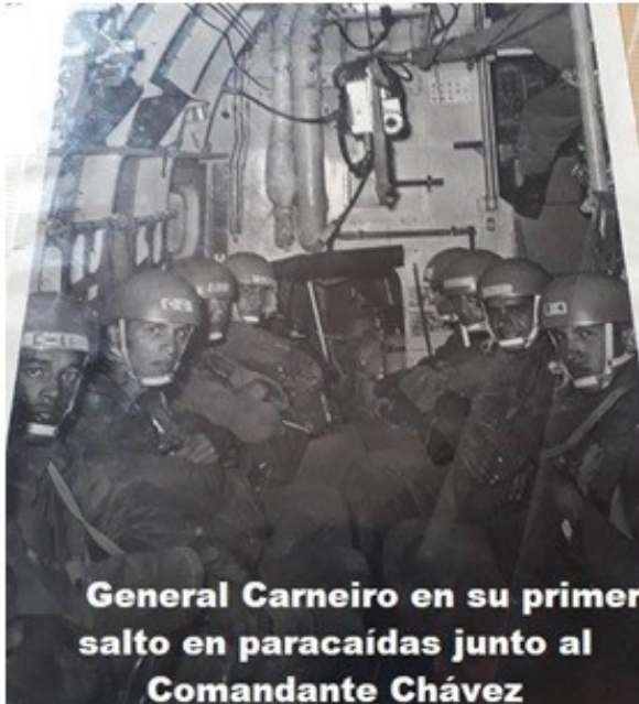
General Carneiro en su primer salto en paracaídas junto al Comandante Chávez

PRONUNCIAMIENTO DEL PARTIDO SOCIALISTA UNIDO DE VENEZUELA EN OCASIÓN DEL PRIMER ANIVERSARIO DE HABER EMPRENDIDO EL VIAJE A LA ETERNIDAD CELESTIAL, NUESTRO AMADO Y VALIENTE GENERAL EN JEFE JORGE LUÍS GARCÍA CARNEIRO, PATRIOTA LEAL A CHÁVEZ Y LA PATRIA. ES ETERNO Y SIEMPRE GUIARA CON SU EJEMPLO NUESTROS PASOS.