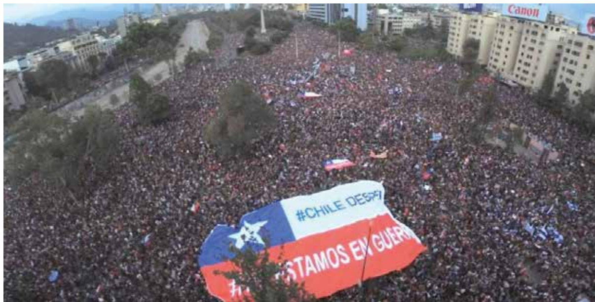
Rebasar las limitaciones y trampas del plebiscito y convertirlo en una verdadera Asamblea Constituyente, como es voluntad del pueblo.

*Periodista y escritor chileno, director de la revista Punto Final . Colaborador de Prensa Latina .