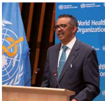
Tedros Adhanom Ghebreyesus.

La Organización Mundial de la Salud (OMS) destacó, una vez más, que la unidad y solidaridad entre todos los países es la única vía para enfrentar el coronavirus SARS-CoV-2, causante de la Covid-19, y acabar con este padecimiento. "Se necesita solidaridad para brindar una solución conjunta a la pandemia (...) Trabajaremos para promover la ciencia, las soluciones y la solidaridad, porque creemos profundamente que lo hacemos mejor cuando lo realizamos juntos", aseguró en Twitter Tedros Adhanom Ghebreyesus, director general de la OMS. A ocho meses del brote de este coronavirus, el número