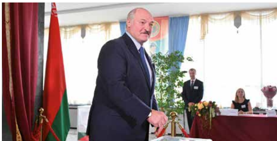
Alexander Lukashenko (en la foto), ganador con el 80,1 de los votos en el escrutinio del 9 de agosto, calificó los planes de Occidente como intento de forzar un cambio de poder.

Lukashenko, ganador con el 80,1 por ciento de los votos el 9 de agosto, aclaró que ni la Unión Aduanera, ni la Unión Económica Euroasiática, ni la Organización del Tratado de Seguridad Colectiva son controladas por Moscú, pues allí las decisiones