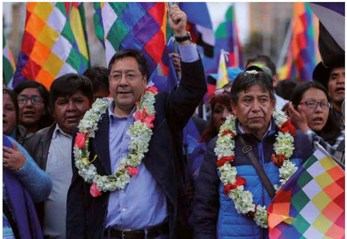
Las encuestas favorecen al candidato presidencial del MAS, Luis Arce —al centro en la foto, alzando una bandera—, exministro de Economía de Evo Morales (2006-2017 y en 2019), período en que el país ostentó gran éxito económico.

“El aplazamiento de los sufragios para el 18 octubre por el Tribunal Supremo Electoral a causa de la pandemia Covid 19 originó amplia molestia en numerosos sectores sociales, sindicales y políticos en Bolivia, y detonó en cortes de carreteras y bloqueos”, sentenció. “Luego, ante el temor de una repetición de los hechos del pasado año