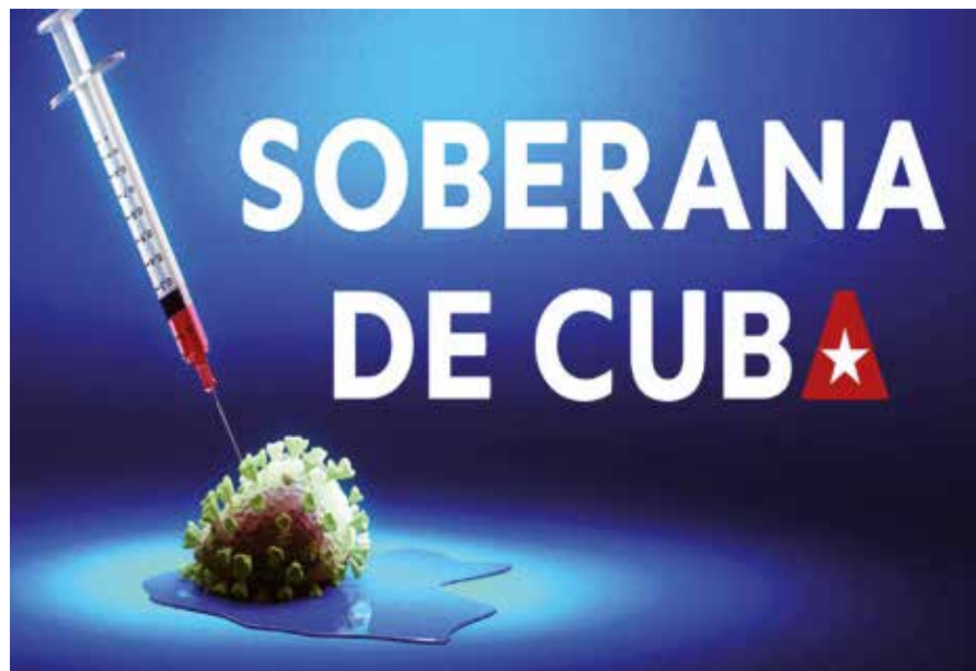
Cuba integra la lista de los 14 países con candidatos vacunales autorizados.

Al referirse al rápido logro de un candidato, el director general del Instituto Finlay de Vacunas (IFV), Vicente Vérez Bencomo, comentó que este proyecto quedó registrado el pasado 13 de agosto, cuando el Centro para el Control Estatal de Medicamentos, Equipos y Dispositivos Médicos (Cecmed) aprobó someter a ensayos clínicos Fases I/II a la vacuna Soberana 01. La autorización es muy importante; después de vencer una primera fase de ensayos clínicos con un número pequeño de personas para pasar a la dos con mayor cantidad de participantes para comprobar que tiene capacidad de producir la