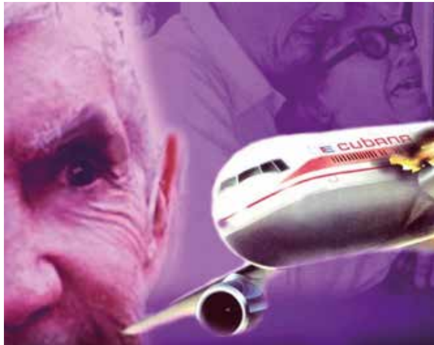
La explosión de una aeronave en pleno vuelo que asesinó, junto a otros civiles, al equipo juvenil cubano de esgrima a su regreso de un campeonato en Venezuela, fue un abominable crimen.

El ejemplo ostensible de libertad y soberanía de Cuba y Venezuela, el cuestionamiento al poderoso vecino del título de propietario del "traspasado" —por otorgamiento motu proprio —, les ha ganado su odio visceral, que no escatima oportunidad en demostrar, en una inacabable y embustera retórica, así como en maniobras de sabotaje y terror, todo lo cual valida lo expresado por el canciller: "Yo afirmo de manera directa que este ataque contra la Embajada de Cuba, de naturaleza terrorista, es un resultado directo de una política oficial de instigación al odio y a la violencia contra mi país".