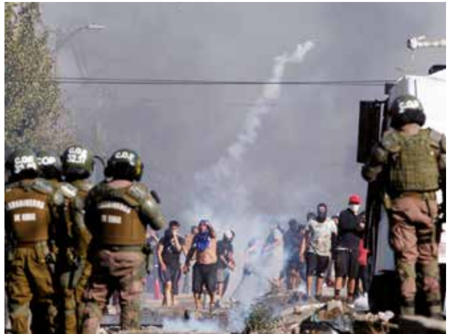
La pandemia que detuvo la lucha chilena frente a la crisis social y política, ha acrecentado la desesperación en el pueblo, que recién mostró su posible regreso al combate en las calles.

Por Rafael Calcines Corresponsal/Santiago de Chile