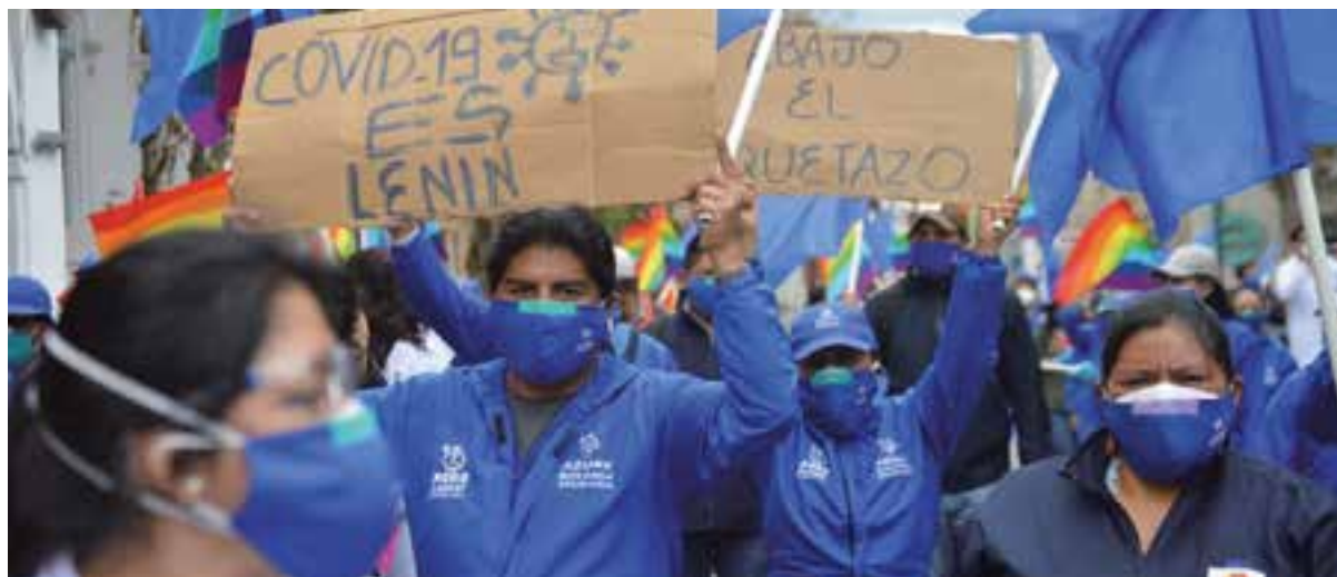
La liberación de precios en combustibles y otras medidas del Gobierno de Lenín Moreno, pesaron para que miles de personas desafiaran la emergencia sanitaria y salieran a manifestarse en las calles.

Al mismo tiempo, continúan los procesos de fusión de ministerios y cierre de secretarías de estado, lo cual también genera más desempleo, otro fenómeno en aumento en la nación suramericana y contra