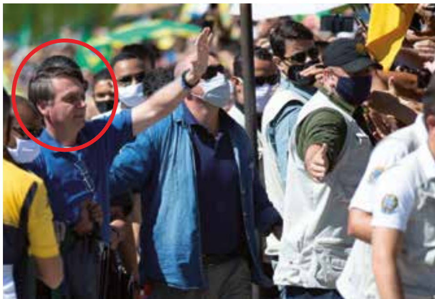
La múltiple irresponsabilidad de Bolsonaro ha motivado una solicitud de su deposición a la Cámara de Diputados, avalada por partidos opositores y más de 400 organizaciones de diferentes sectores.

Mientras el entonces titular respaldaba recomendaciones de la Organización Mundial de la Salud, como el aislamiento social, el jefe de Estado se aventuraba, y aún lo hace, a tratar de imponer métodos y reglas propias, sin respaldo científico. En dos ocasiones, el excapitán del Ejército amenazó con expulsar a Mandetta, quien respondía que, como soldado no desertaría de la batalla, y solo se apartaría del cargo por exoneración, como realmente ocurrió. Más allá de las diferencias, algunos comentaristas políticos alertaron que Bolsonaro además temblaba por el prestigio público que adquiría Mandetta.