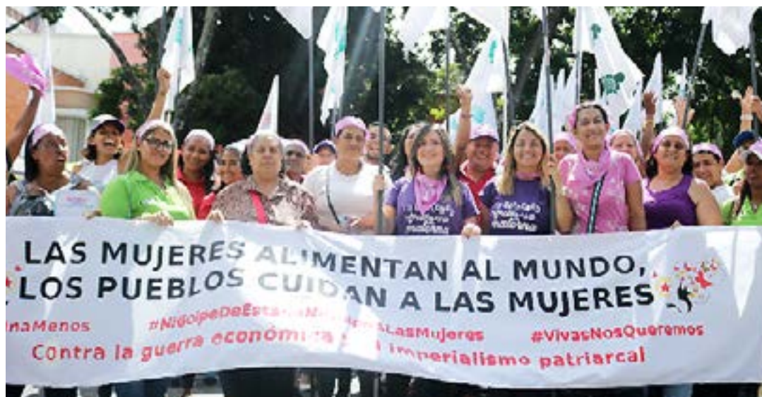
La mujer es fundamental para lograr la soberanía alimentaria.

Por ello el Instituto Nacional de Nutrición (INN) no solo les rinde tributo, sino que agradece a cada una de