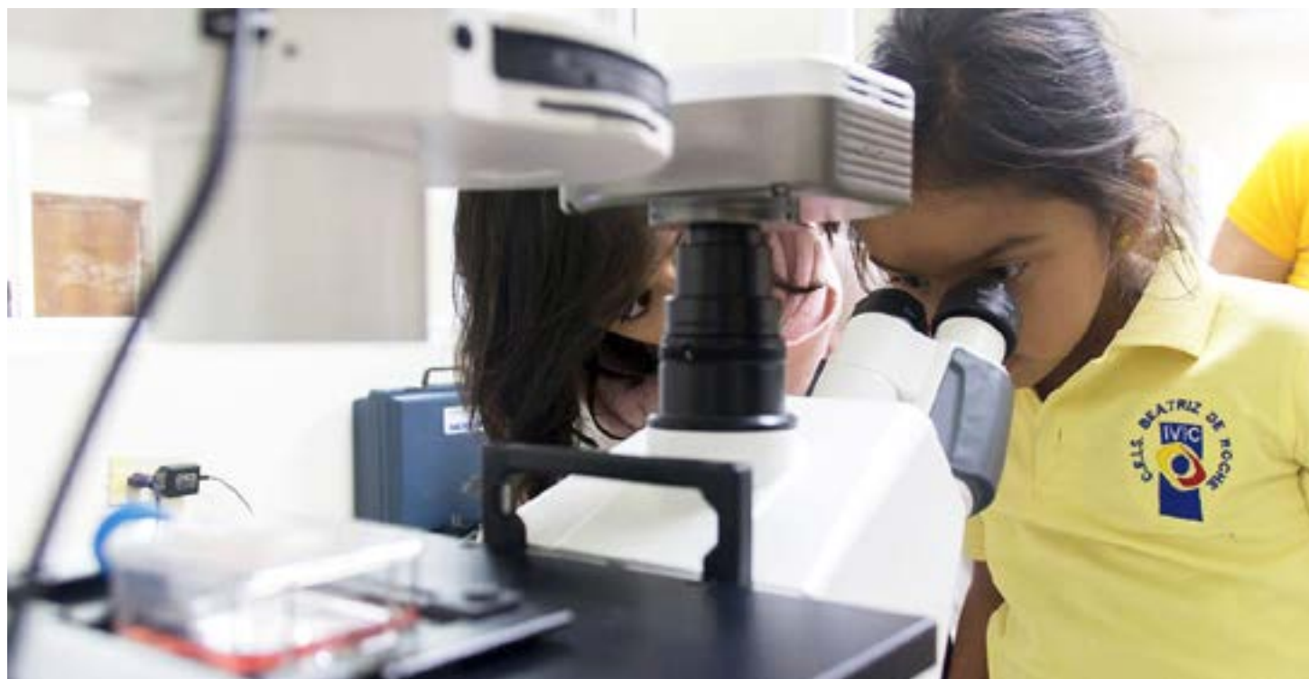
La Revolución se basa en principios de equidad

pero la sugerencia técnica de una mujer difícilmente se pone en práctica si un hombre no la avala, y una vez puesta en práctica si resulta mal será "por haberle hecho caso a la mujer" y si resulta bien será por mérito del hombre que la avaló. Todo esto refleja que el mundo machista nos ve como "buenas secretarias", para llevar los apuntes está bien pero, para tomar decisiones es ya otra historia.