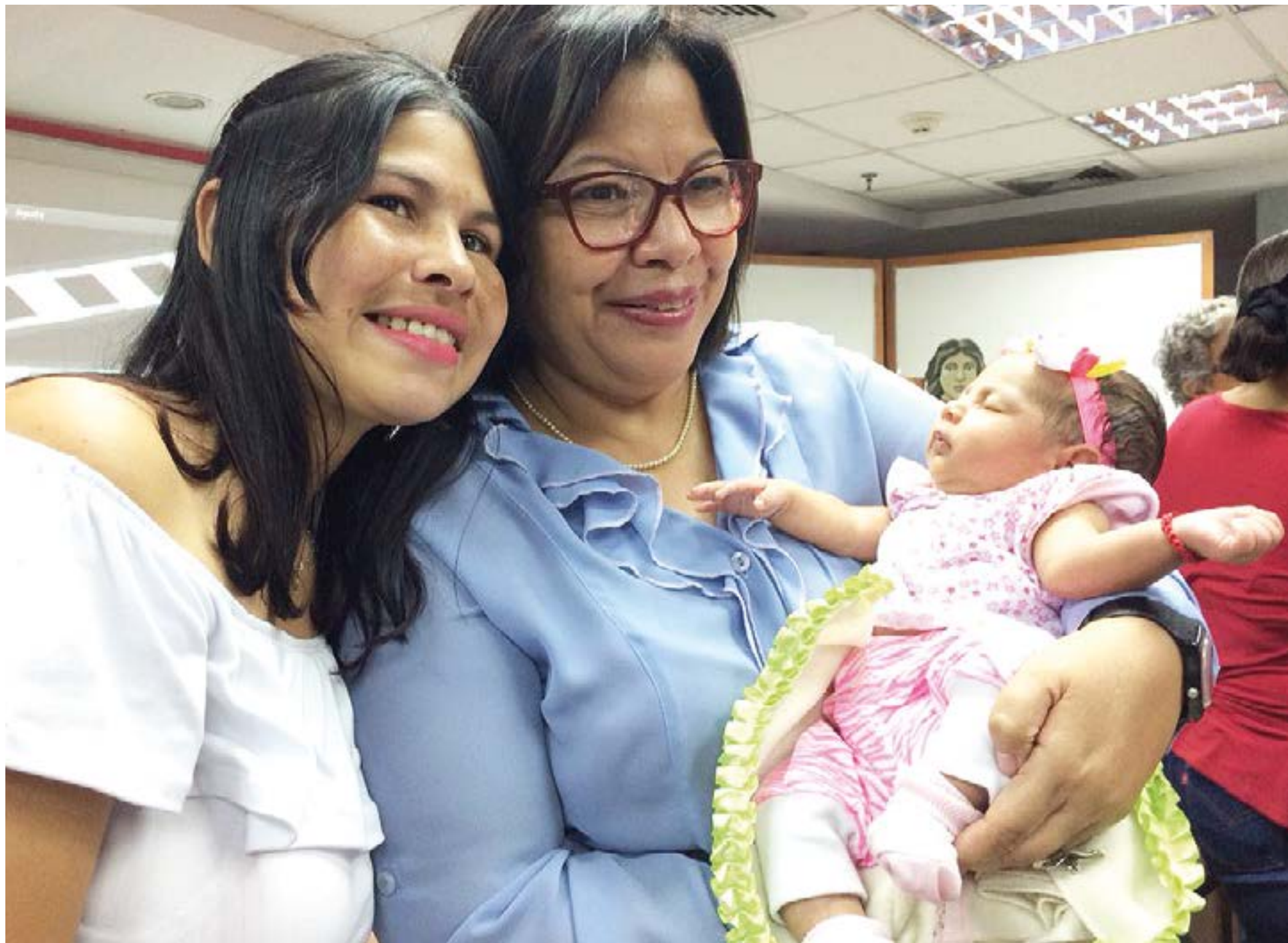
Ministra Asia Villegas trabaja para humanizar el parto