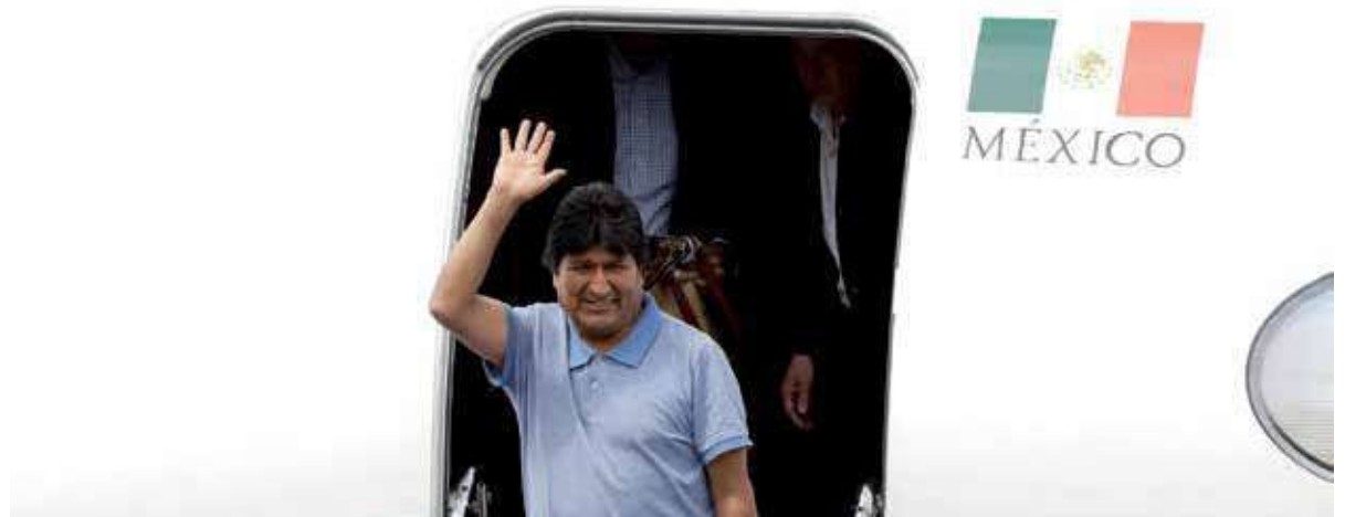
México demostró su papel clave en la (geo) política latinoamericana actual cuando, con audacia, valentía y congruencia con su historia, resguardó la vida del depuesto presidente Evo Morales.

Incluso en el ahora lejano año 1994, en La Habana, esbozó el proyecto de la creación de “una asociación de Estados latinoamericanos (...) que fue el sueño original de nuestros libertadores (...) un congreso o una liga permanente donde discutiríamos, los latinoamericanos, sobre nuestra tragedia y sobre nuestro destino”; que hiciera del siglo XXI “el siglo de la esperanza y de la resurrección del sueño bolivariano, del sueño de Martí”. A diferencia de la contundencia de aquella visión primigenia, y seguramente condicionado por las coordenadas a las que