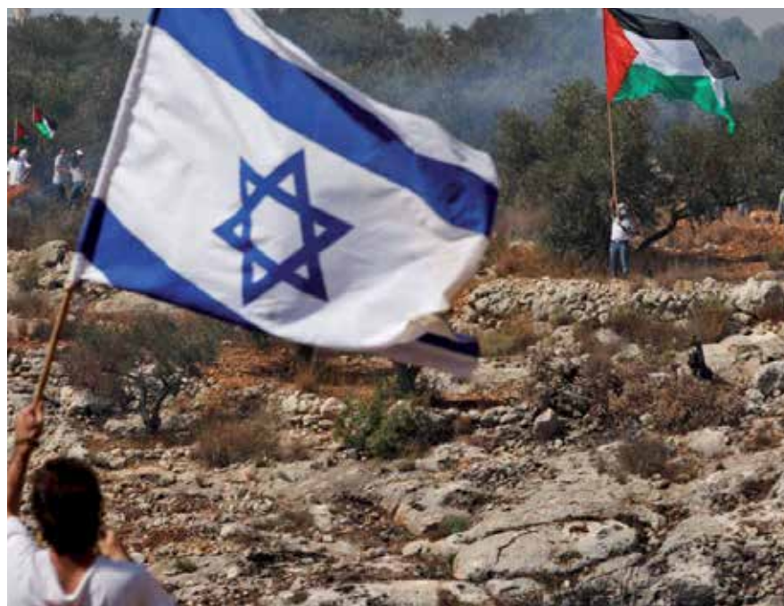
El "golpe del siglo", al decir del presidente palestino, Mahmoud Abbas, será devuelto en el futuro.

Por Adalys Pilar Mireles Corresponsal/El Cairo