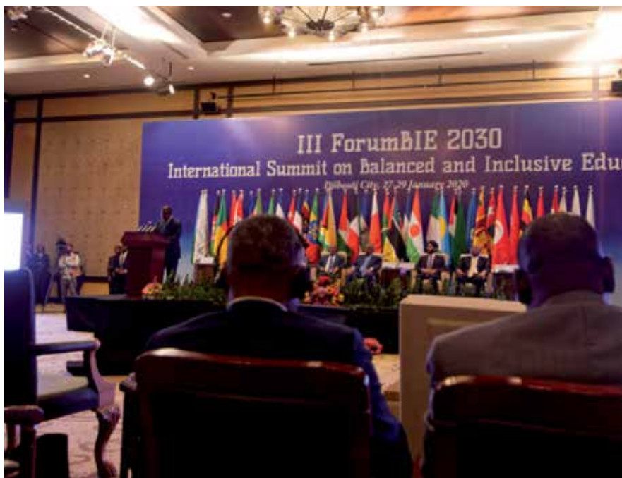
La firma de la Declaración en Djibouti, ratificó la aceptación de sus normas y principios, los cuales deberán adecuarse ahora a las condiciones específicas de cada nación.

Por su parte, la OCE surgió bajo los principios del multilateralismo, la solidaridad y la autodeterminación, con lo cual servirá para promocionar y facilitar la cooperación "entre iguales" y crear mecanismos de financiamiento educativo y solidaridad coordinados que cumplan con las prioridades nacionales.