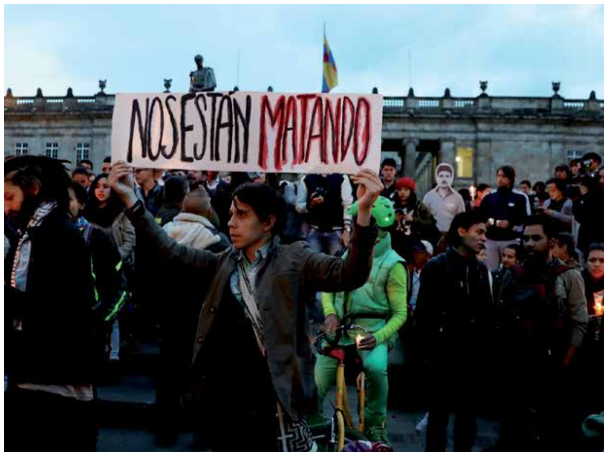
Amenazas, atentados, secuestros, asesinatos...conforman el día a día colombiano.

Por Masiel Fernández Bolaños Corresponsal/Bogotá