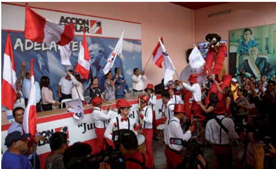
AP celebra el primer lugar que, increíblemente, obtuvo con solo el 10,1 por ciento de los votos válidos.

Dos fuerzas progresistas lograron curules, el Frente Amplio, con 6,1 por ciento de votos, y Juntos por el Perú, con 5,1, y a ambos les queda reflexionar sobre el hecho que sumados hubieran superado a AP, más aún si se unían también con Perú Libre, que con 3,9 por ciento quedó fuera del Parlamento.