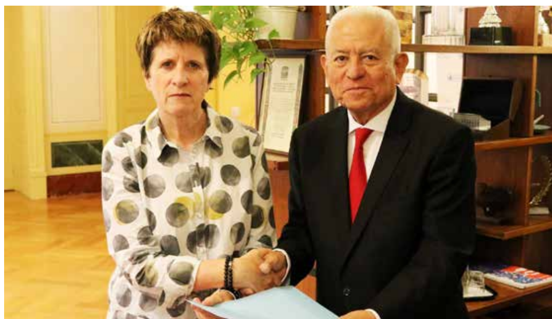
El embajador Jorge Valero, entrega la misiva a Kate Gilmore, Alta Comisionada Alternativa de la ONU para los Derechos Humanos.

Me pregunto y a la vez le pregunto: ¿Puede llamarse dictadura a un proyecto político legitimado 23 veces en las urnas electorales en los últimos veinte años? ¿Qué redujo la pobreza por necesidades básicas insatisfechas a un tercio de la que existía antes de la Revolución? ¿Que hizo de Venezuela el segundo país menos desigual del continente, produjo la más grande transferencia de riqueza de nuestra historia, transfiriendo 25% del ingreso hacia las clases medias y los sectores con menos recursos? ¿Puede llamarse dictadura a un Gobierno que en una Constitución votada por el pueblo, dió derechos por primera vez a los pueblos indígenas, a los niños, a las mujeres, a los adultos mayores, que ha visibilizado y otorgado derechos a las mayorías empobrecidas y las mino-