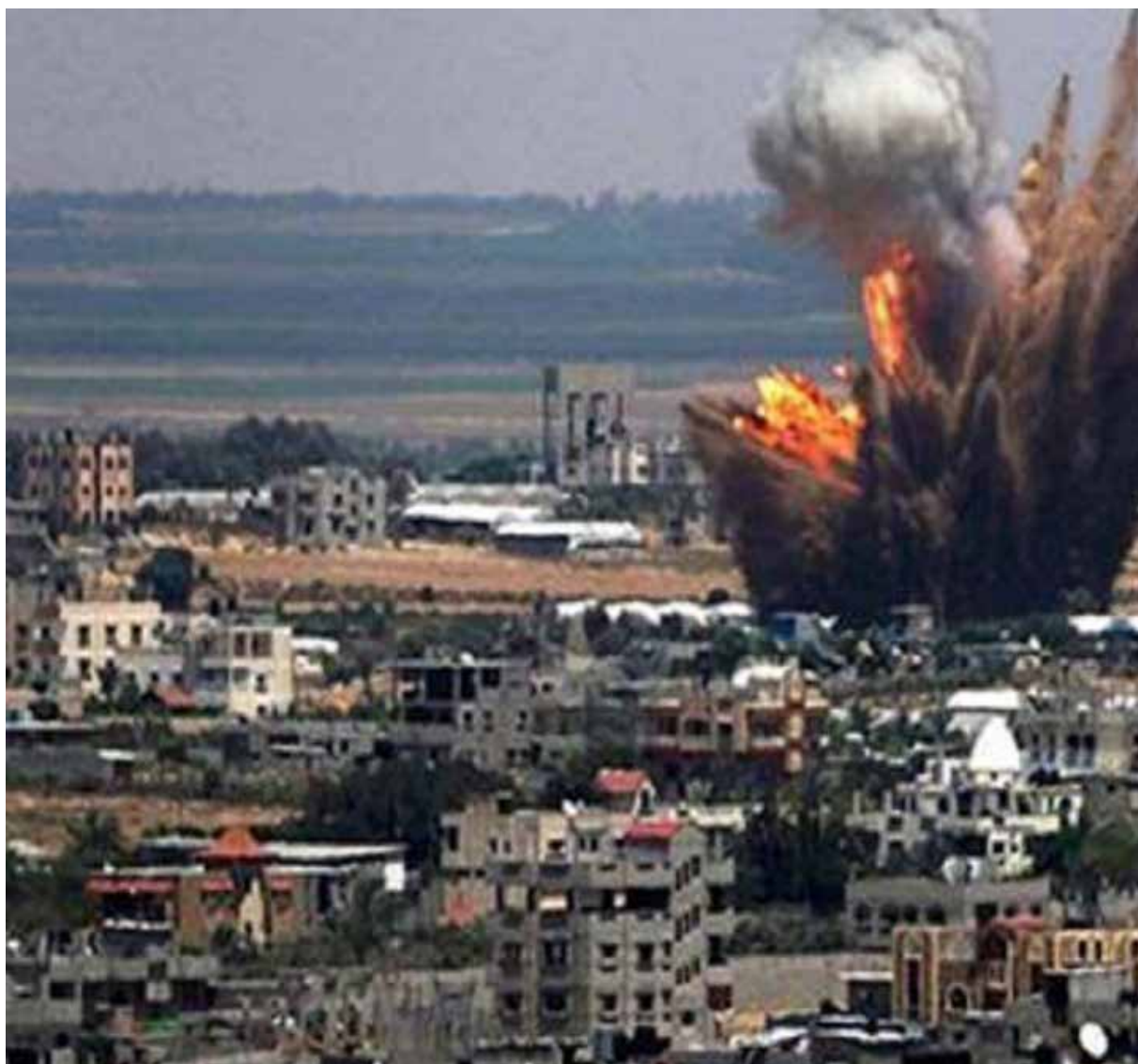
En 2011 el informe de la Alta Comisionada para los Derechos Humanos de la ONU, Navy Pally, abrió las puertas a la invasión militar en Libia

La Alta Comisionada Michelle Bachelet, al mismo estilo que su antecesora Navy Pally, acaba de presentar el informe sobre la situación de los derechos humanos en Venezuela. Repleto de imprecisiones, de información no verificada, ni verificable, de errores, omisiones y falsedades, el informe en cuestión adolece de la rigurosidad y la seriedad que exige la presentación de este tipo de documentos cuyas implicaciones coloca en riesgo la paz,