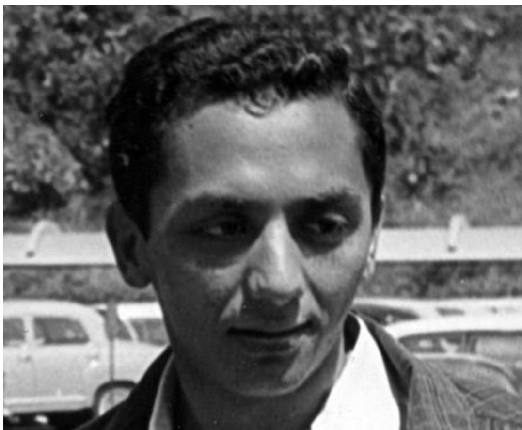
Jorge Rodríguez padre fue asesinado en los tiempos en que gobernó la oposición.

“Nosotros condenamos la violencia, desde cualquier lado. No quedarán impunes ninguna de esas actuaciones irregulares. No ocultamos nada. Todos los funcionarios están a la orden del Ministerio Público, para que todo se aclare y se demuestre lo que sucedió (...) Que paguen los