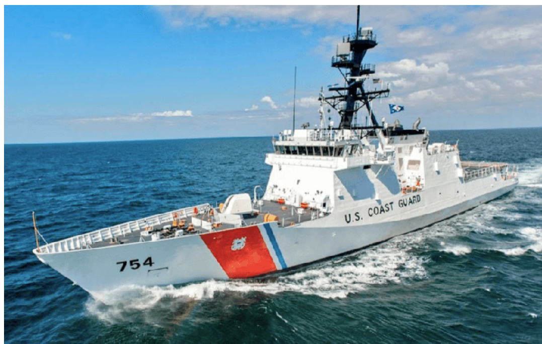
El ingreso del guardacostas estadounidense a mar territorial venezolano constituye una nueva provocación.

En la página de la BBC se ventiló que las palabras de Pompeo fueron: "...Tenemos desacuerdos sobre Venezuela". Lo cual comenzaba a entrever las posturas antagónicas de Estados Unidos y Rusia con respecto al país