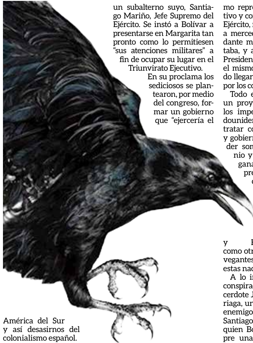
América del Sur y así desasirnos del colonialismo español.

En 1817 en Venezuela unos políticos descontentos que pretendían desconocer la autoridad suprema del Libertador y restablecer los principios que guiaron la Primera República (1810-1812) organizan el Congreso de Cariaco. Allí los insubordinados designan nuevas autoridades en sustitución de las legítimamente establecidas, y reeditan una versión maquillada de la obsoleta Primera República, cuyas prácticas (gobierno federal, triunvirato ejecutivo, impunidad) fueron la causa de su disolución. La reunión se produjo entre el 8 y el 9 de mayo en San José de Cariaco, provincia de Cumaná y actual estado Sucre, mientras Bolívar se encontraba en el Sur, en la provincia de Guayana, como parte de una estrategia geopolítica dirigida a darle base económica a la lucha patriota, habida cuenta de las grandes riquezas con que contaba esa región, y como preámbulo a la lucha encaminada a conquistar la independencia de la Nueva Granada (Colombia actual) para luego emprender la liberación de toda