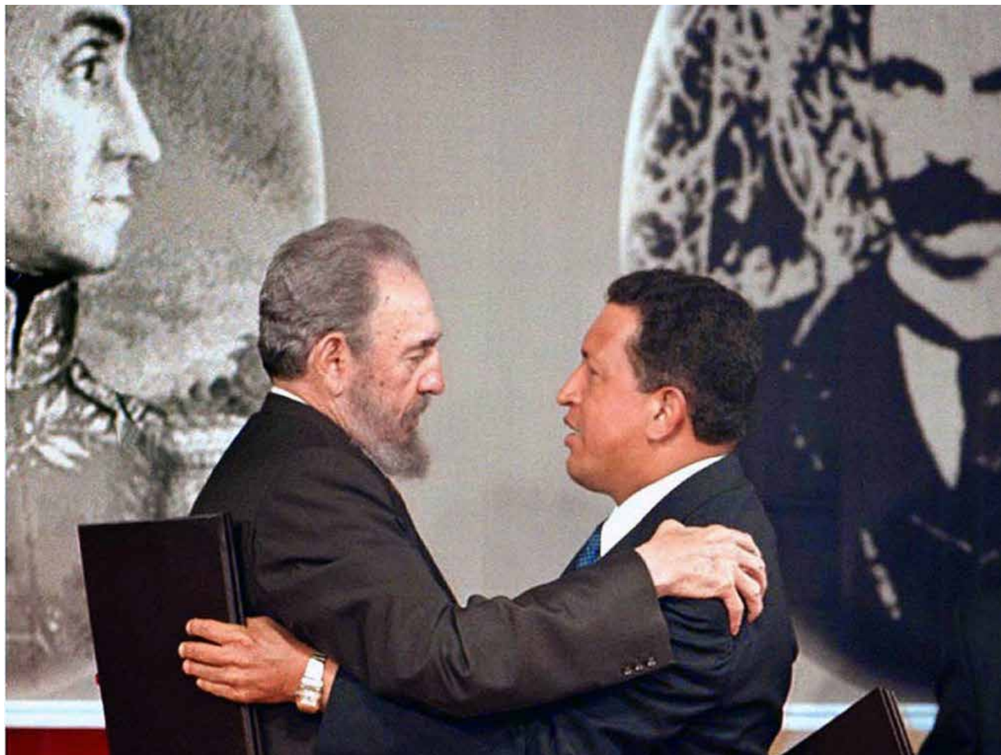
Chávez y Fidel, comandantes eternos.

se plantea la salud como un tema de Derechos Humanos.