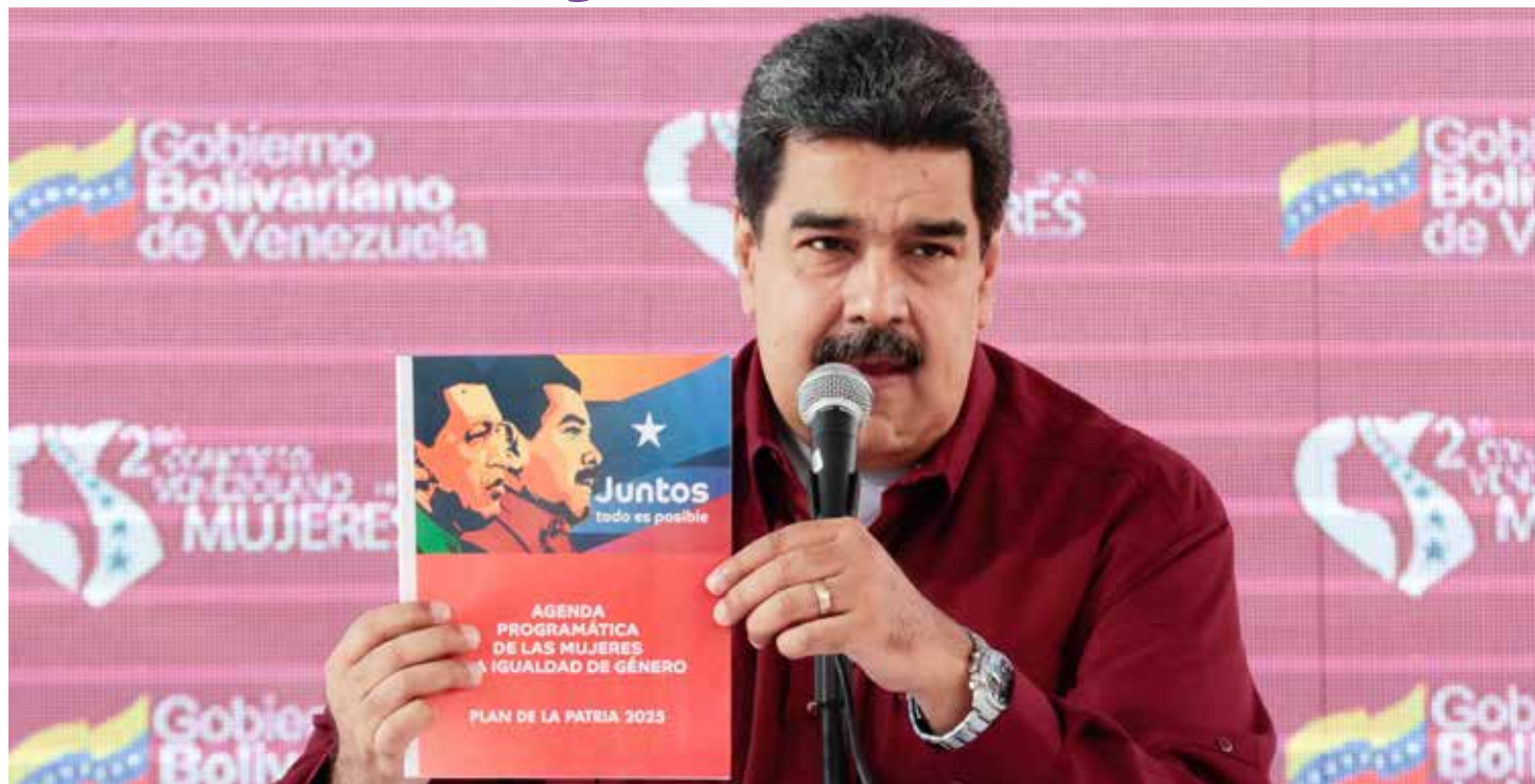
El presidente Maduro ratificó la vocación feminista de la Revolución chavista

“Tenemos que articular a los comuneros, a las mujeres, a los trabajadores, a los estudiantes, a la juventud, a todo el mundo y hacer una gran red en defensa de la Revolución Bolivariana y de la verdad de la humanidad. Tenemos que elevar nuestra capacidad de combate, articular a todo el mundo en sus