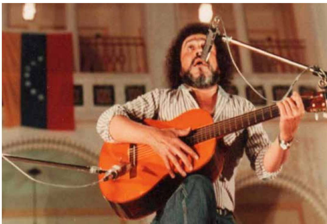
Alí y su canto inmortal

Son 77 años los que suma este 31 de octubre el Cantor del Pueblo Venezolano y su canto luminoso sigue bañando los caminos de la Patria