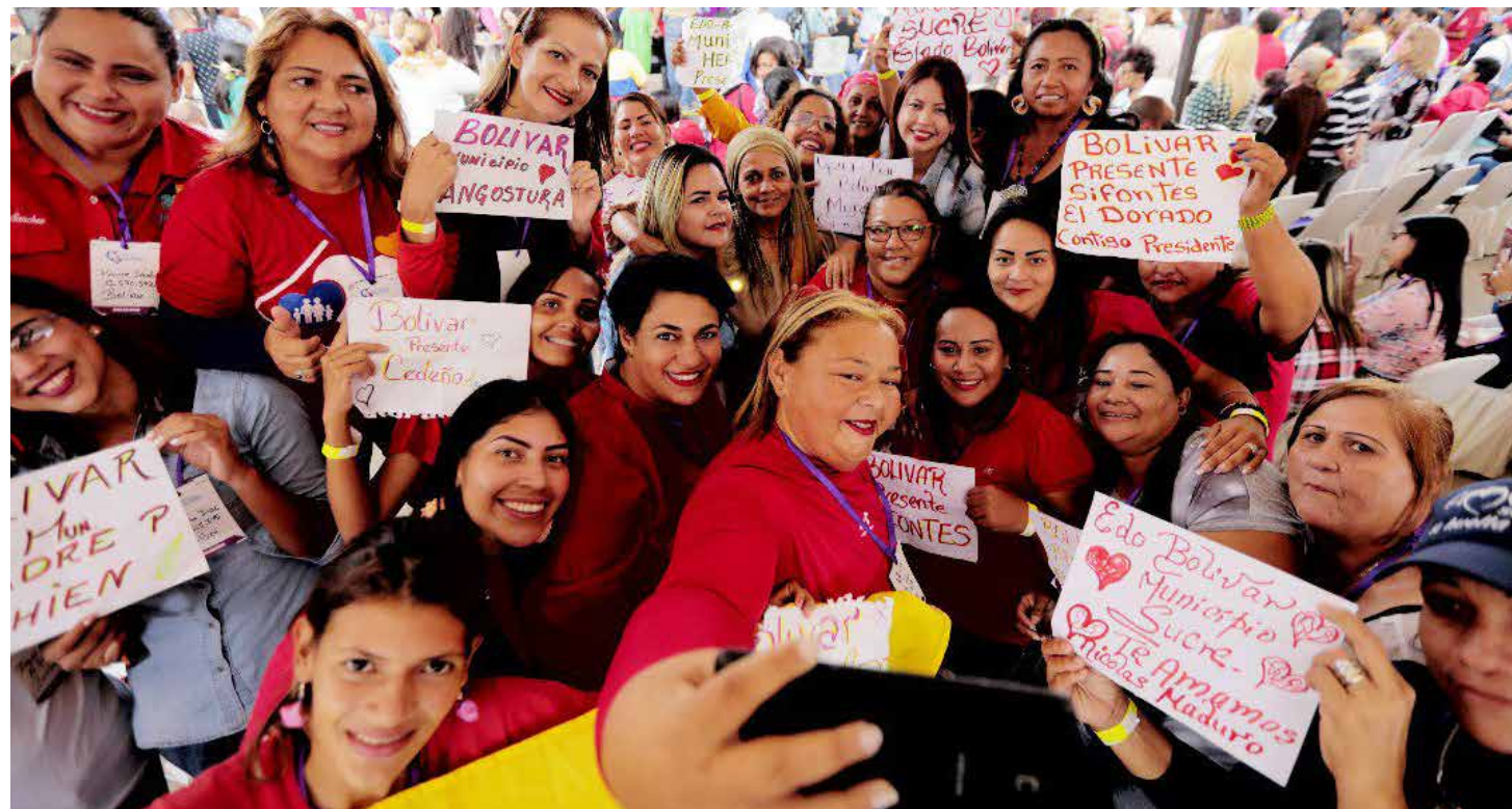
Hacia el socialismo feminista.

Es así como, en el contexto histórico y político que vivimos, marcado por un ataque sistemático y brutal contra el país, sus instituciones y el pueblo mismo, debido al bloqueo y boicot económico, las mujeres venezolanas han logrado, a través de la organización popular, agruparse para analizar, debatir y proponer, una serie de recomendaciones que permitan coadyuvar en la tarea de sacar adelante, no solo el Plan de Recuperación, Crecimiento y Prosperidad Económica, implementado por el presidente Nicolás Maduro, sino también las acciones destinadas a promover el buen vivir y la paz de todas y todos. La mujer venezolana, comprometida con estos aspectos de desarrollo y defensa de la patria, viene trabajando arduamente, desde distintos movimientos femeninos que hacen vida a lo largo y ancho de todo el territorio nacional, realizando una serie de asambleas municipales y parroquiales, donde tuvieron