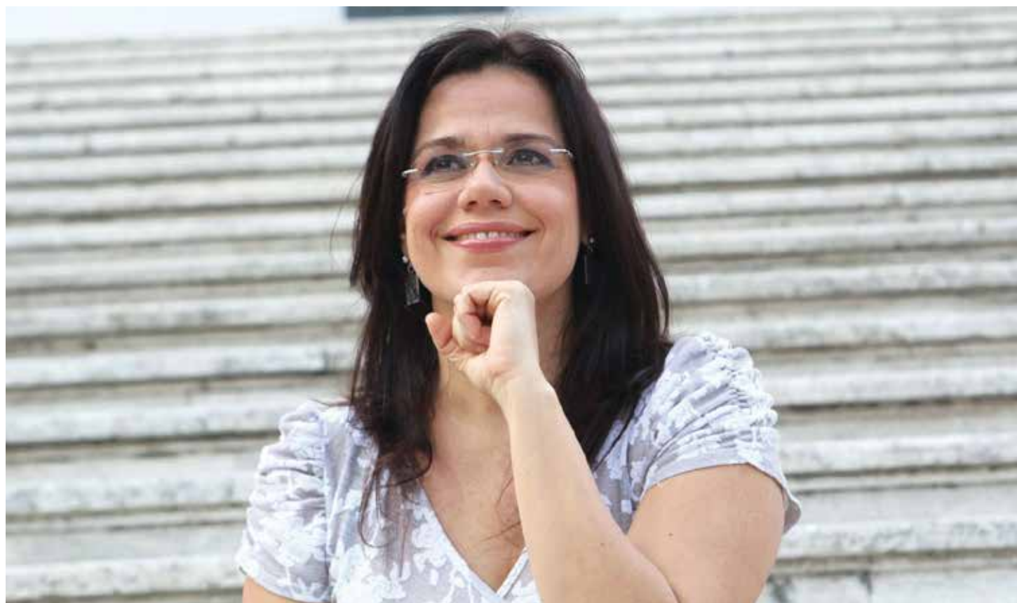
El espíritu solidario está presente en la comuna

Por tal razón, rechaza tal aseveración del mencionado funcionario, por ser “vergonzosa, no tiene sentido y es injerencista”. •