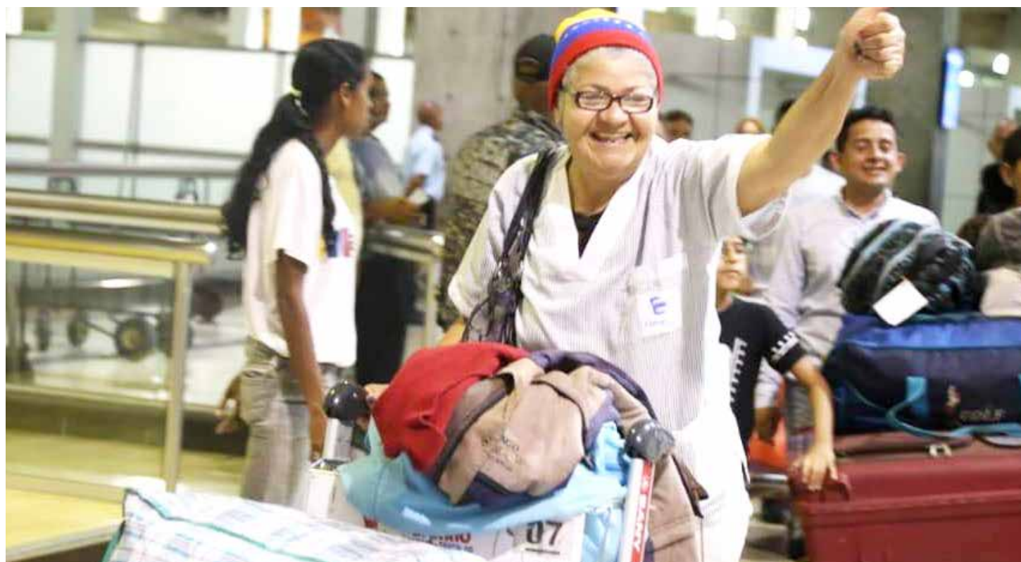
Una venezolana celebra su vuelta a la Patria.