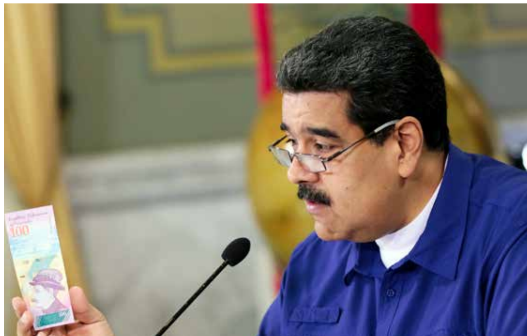
Nicolás Maduro: Hemos dado un paso histórico.

sufriró un duro golpe con la depresión de los precios del petróleo y con la infiltración de PDVSA por sectores mafiosos y corruptos dirigidos desde el exterior. "Le hicieron daño a la industria y la dejaron en un estado de postración que ya vamos superando y sacando adelante gracias a la Clase Trabajadora. Vamos hacia una PDVSA nueva, sana y honesta, nacionalista y patriota, y sobretodo muy productiva, ya la estamos viendo en el horizonte inmediato".