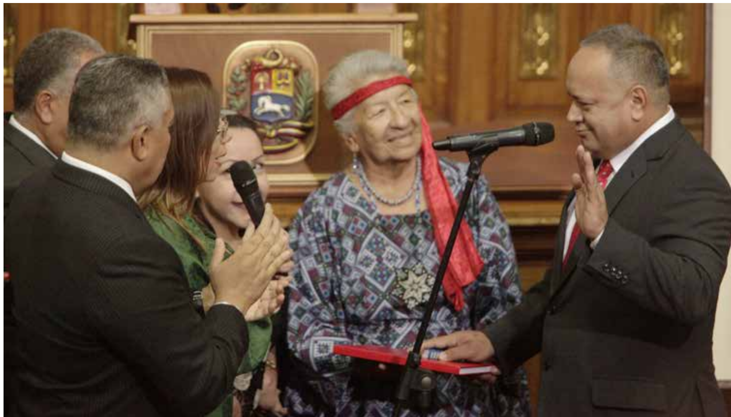
El presidente de la ANC llamó a los diputados a contribuir a edificar el nuevo comienzo.

Advirtió sobre las consecuencias que tendría un nuevo gobierno de derecha en Venezuela. "Cada vez que a la derecha se le da una oportunidad y llega al poder termina en el fascismo tratando de sembrar el caos en esta Tierra. Pero nosotros vamos a seguir y vamos a vencer". •