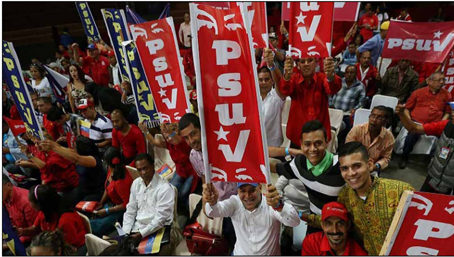
Venezuela emprenderá un nuevo comienzo hacia la superación de trabas que impiden el avance del socialismo.