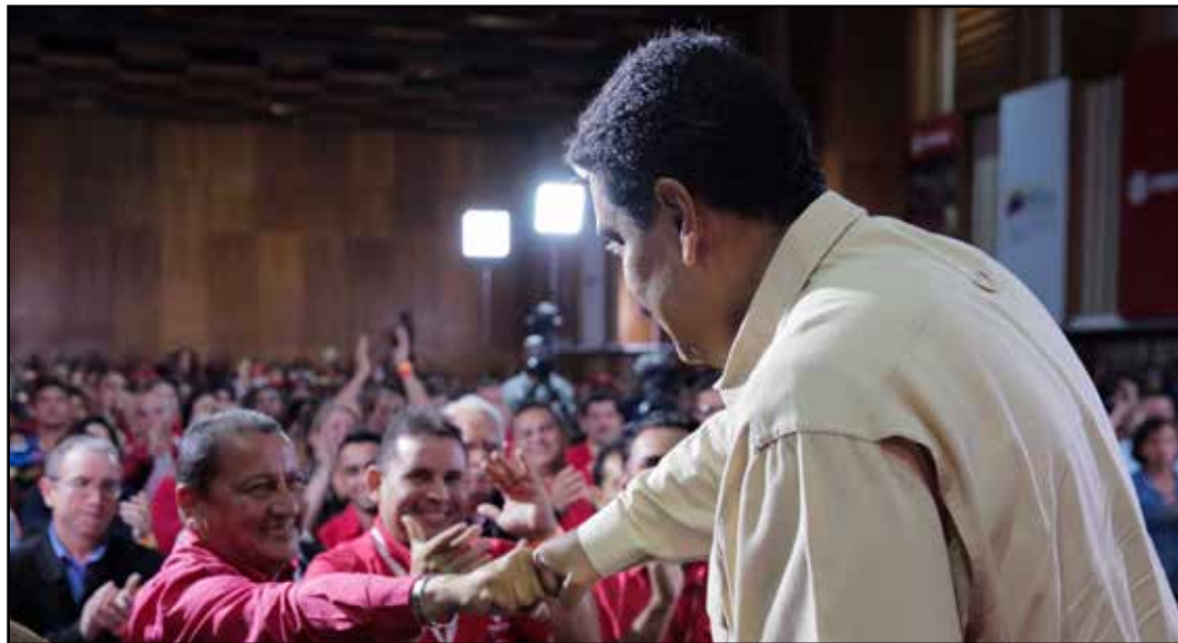
Trabajadores petroleros se comprometieron a recuperar la producción.