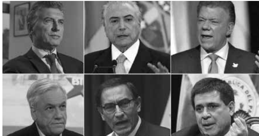
Los presidentes de Argentina, Brasil, Colombia, Chile, Perú y Paraguay pusieron condiciones para su regreso al organismo suramericano.

A pesar del revuelo mediático y títulos grandilocuentes que hablaban de retirada o abandono de la mitad de los miembros de la Unasur, lo que apuntaba a su desintegración, el documento emergía como un ultimátum a la solu-