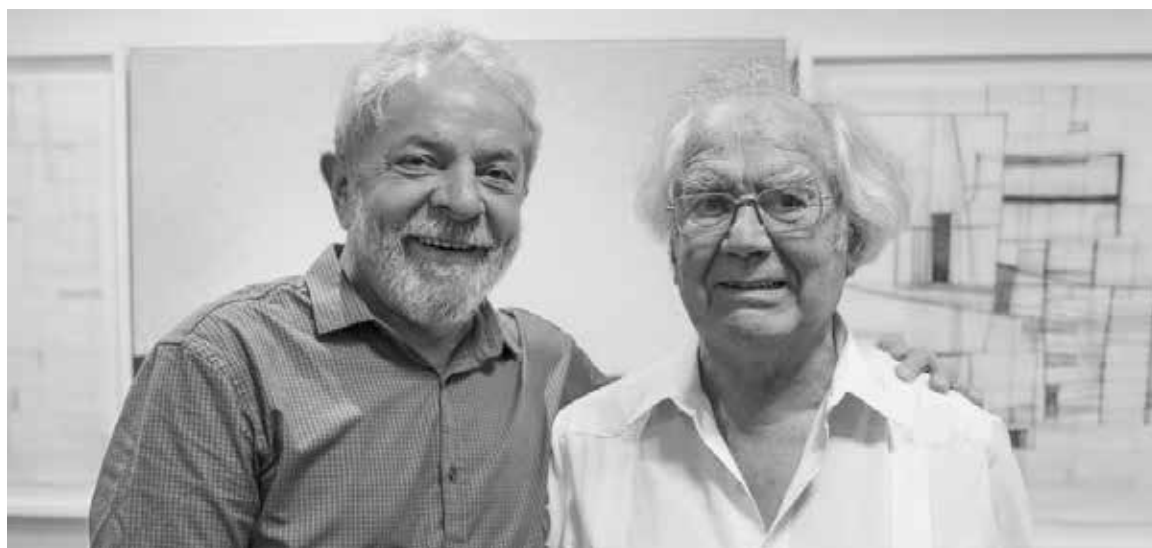
La iniciativa de Adolfo Pérez Esquivel (derecha) cuanta ya con más de un cuarto de millón de firmas.

Programas como ‘Hambre Cero’ y ‘Bolsa Familia’ sacaron de la pobreza extrema a más de 30 millones de personas, convirtiendo a Brasil en un modelo exitoso mundialmente reconocido por organismos internacionales como la Organización de las Naciones