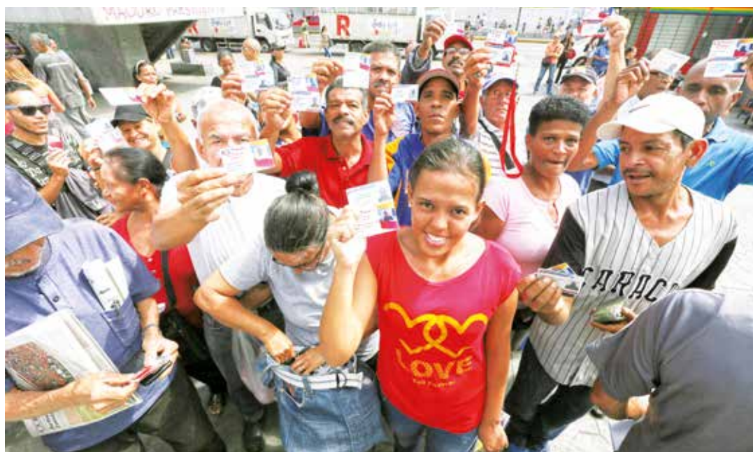
Se superaron las expectativas iniciales.

"Tenemos una gran afluencia", recaló la titular del ente rector del Poder Electoral, al tiempo que señaló que esto es muestra de la voluntad del pueblo de ejercer su derecho al sufragio, contemplado en la Constitución Bolivariana. "Al pueblo de Venezuela le gusta votar, le gusta decidir, le gusta tomar las riendas del país a través del sufragio, y por eso los simulacros son cada vez más concurridos", señaló. Para la jornada de este domingo se habilitaron 500