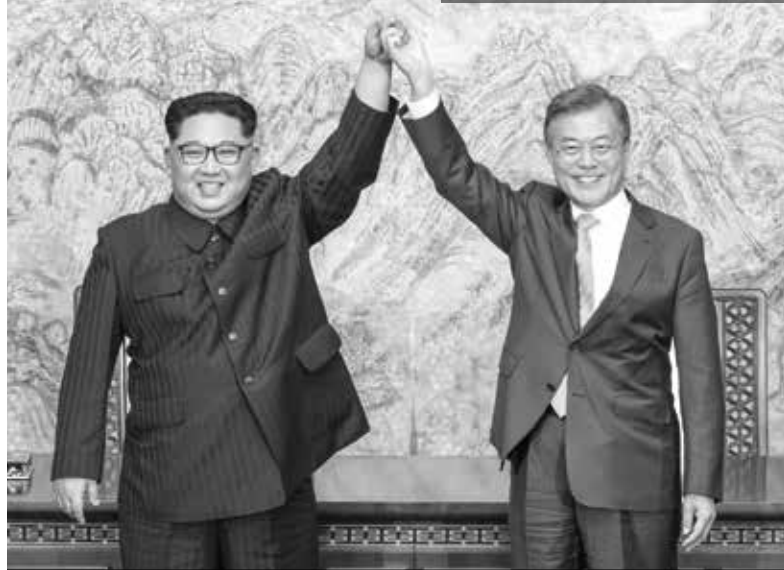
Las partes reanudarán en breve los diálogos y negociaciones a fin de tomar medidas para poner en práctica los acuerdos de la Cumbre, subraya la Declaración Conjunta.