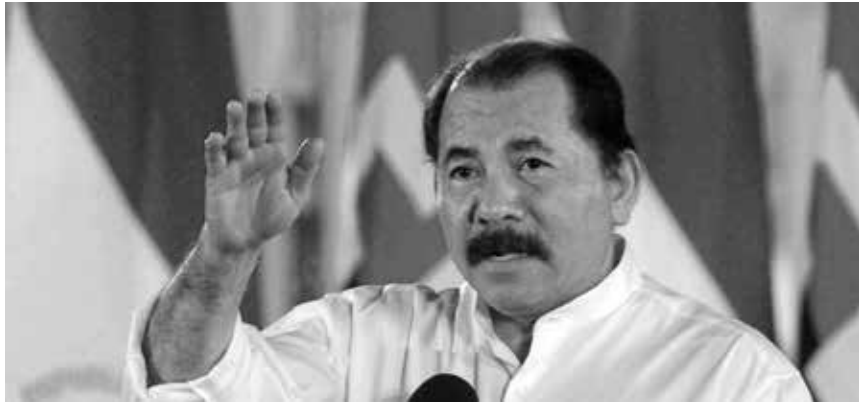
El diálogo, la alianza y el consenso son prácticas que el gobierno sandinista ha promovido en todos los espacios posibles desde que Daniel Ortega ganó las elecciones en 2007.

Nicaragua conoce bien lo que implica un conflicto violento entre hermanos, años de guerra sangrienta han dejado lecciones que algunos parecen olvidar, sin embargo, la mayoría se empeña en recordar; solo la paz trae bienestar.