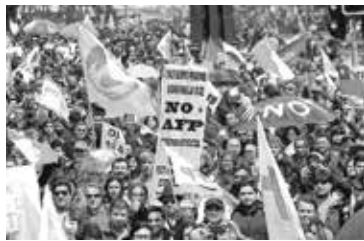
Movimientos sociales alertas ante corriente neoliberal.

Pero el segmento más temido por Piñera es el estudiantil. Contrario a lo esperado, el mandatario se decantó por Gerardo Varela como ministro de Educación, un abierto defensor del lucro para el sector. Las primeras señales de mantener privatizaciones en detrimento del sector público, recibieron una contundente respuesta con marchas estudiantiles a mediados de abril, algunas de las cuales terminaron con enfrentamientos con la policía de carabineros. Pese a los esfuerzos de los líderes estudiantiles, en Chile determinados elementos en-