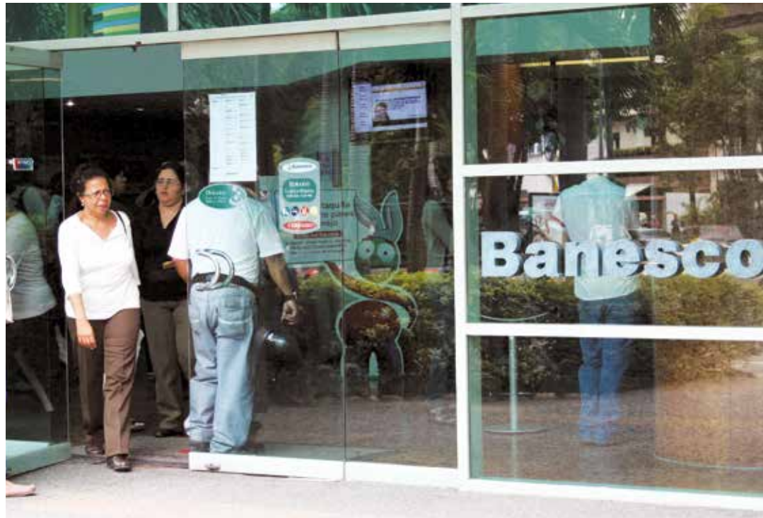
Los clientes de la entidad financiera no se verán afectados.

"Esta es una medida de intervención donde la entidad financiera mantendrá todas sus operaciones sin ningún problema; la idea es preservar y que la institución conserve su actividad bancaria y continúe brindando sus servicios a todo sus usuarios con absoluta normalidad", expresó el sábado 05 de mayo el presidente de la Superintendencia de Bancos, Antonio Morales. El funcionario llamó a la población mantener la calma y no hacer caso a los rumores, y menos a aquellos que difunden por redes digitales. "Los ahorristas tendrán su dinero garantizado ahí, sin ningún problema, no tienen por qué movilizarlo si no lo necesita, la intervención es a puertas abiertas. El banco va seguir operando con toda normalidad", aclaró. Señaló que esta intervención se debe acciones