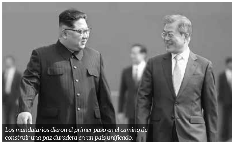
Los mandatarios dieron el primer paso en el camino de construir una paz duradera en un país unificado.

Ambos lo escoltaron en sus conversaciones oficiales con Moon,