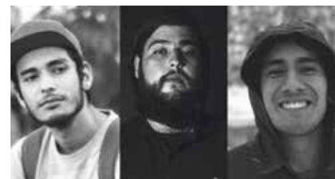
Similar a lo ocurrido hace 43 meses con los normalistas de Ayotzinapa, el grupo del crimen organizado que asesinó a los tres jóvenes los creía miembros de un cartel rival.

La Secretaría de Cultura y el Instituto Mexicano de Cinematografía, candidatos a la presidencia de la República y a otros puestos para las elecciones del 1 de julio, así como actores sociales y de la vida pública condenaron el crimen, contra el que se anuncian nuevas manifestaciones.