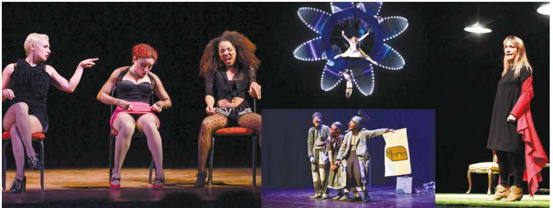
Se calcula que un millón de personas asistió a las obras del Festival.

Diez días de rumba escénica que confirmaron que la democracia participativa y protagónica también se bate en las tablas