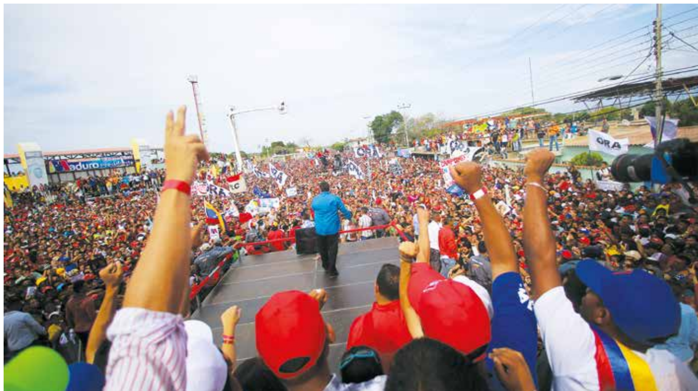
El candidato chavista en campaña por la paz y la soberanía.

El problema es que el centro de gravedad del conflicto no reside en Venezuela. El análisis de los derroteros opositores permite entender una parte menor del asunto. Sus decisiones no son muchas veces suyas, en particular cuando es financiada de manera directa, como los 16 millones de dólares que recientemente le aprobó el Gobierno norteamericano -eso es solo lo público-. El epicentro del conflicto está en el frente internacional, dirigido por los Estados Unidos, con sus aliados de la Unión Europea, y los Gobiernos subordinados del continente. Ahí se planifican las tácticas, la dirección central de los ataques, la construcción de sus escenarios, actores, ángulos de tiro.