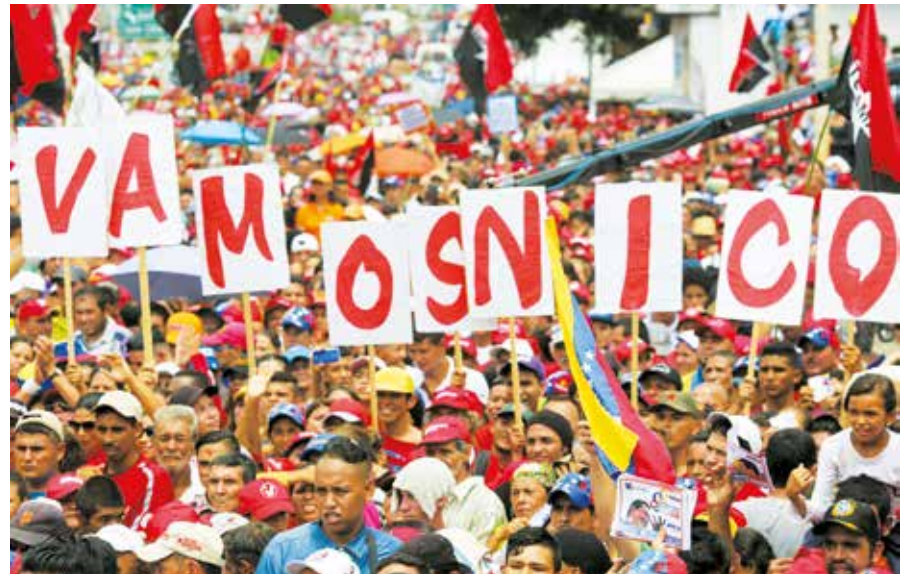
Lo que pase en Venezuela afectará a todo el planeta.

¿Qué significa para el chavismo ganar elecciones en ese contexto? Esta-