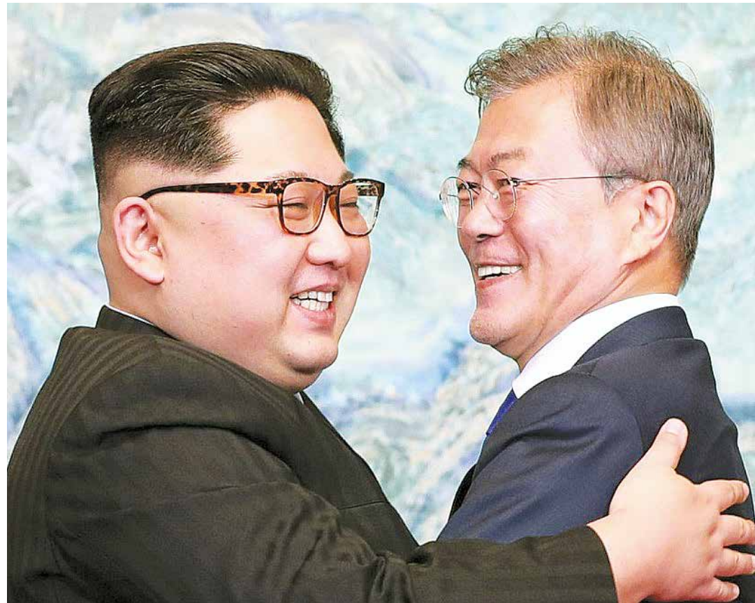
Un histórico encuentro.

El momento en que el presidente Kim cruzó la línea de demarcación militar por primera vez en la historia, Panmunjom dejó de ser un símbolo de di-