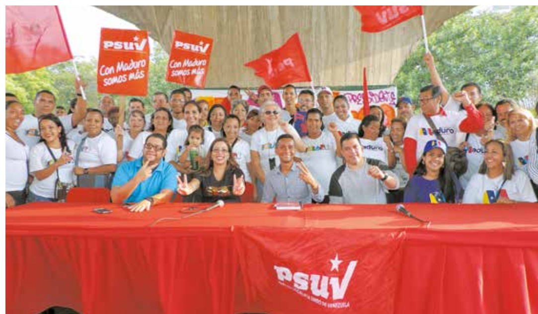
El PSUV se moviliza en defensa del voto.

- Lo primero que estamos diciendo a los ciudadanos es que la Revolución es inclusiva porque da paso a las nuevas generaciones. Los dos candidatos del Circuito 3 somos jóvenes que vienen de las bases. Nuestra propuesta es seguir trabajando sobre el Plan de la Patria, enfocado en el fortalecimiento de la economía venezolana. Igualmente, contamos con enlaces a nivel estatal con el gobernador Héctor Rodríguez y a nivel nacional con el presidente obrero Nicolás Maduro, que permitirá sacar adelante los proyectos a favor de los sectores populares. •