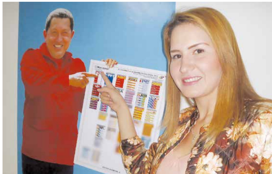
Francis llama a votar por la paz y la soberanía.

- Yo creo que va a ser bastante alto porque el pueblo venezolano está claro de que en este momento no solo estamos definiendo un cargo político en el Ejecutivo, sino que estamos dando la batalla porque sean los pueblos los que elijan sus caminos y no factores externos quienes determinen lo que debemos hacer los venezolanos. Después de 18 años, hay mucha conciencia en el pueblo que sabe