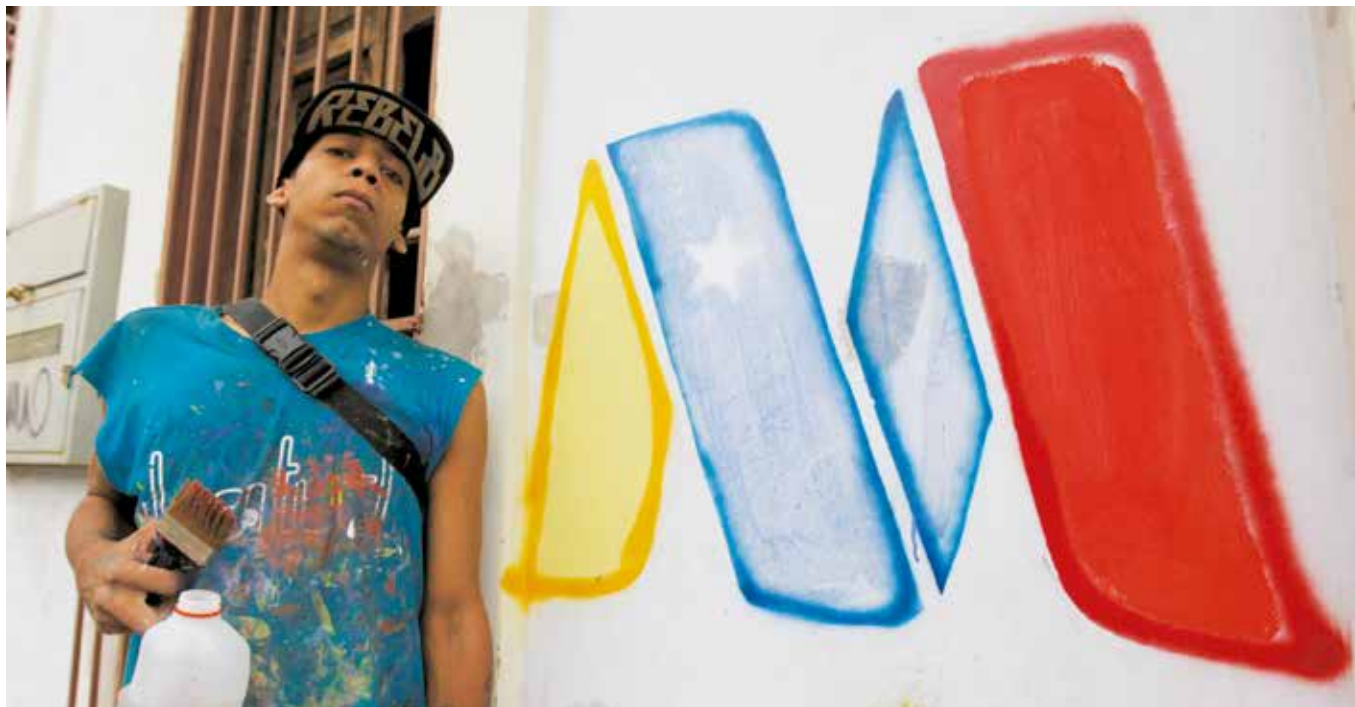
Votar por Maduro es ser leal con nuestra historia y con nuestro futuro.

Venezuela es una necesidad continental. Lo que acá pasa impacta sobre el horizonte americano, su retroceso, empate o avance. Los Estados Unidos lo tienen claro. Votar a Maduro es una lealtad necesaria con nuestra propia historia, nuestras posibilidades por venir. •