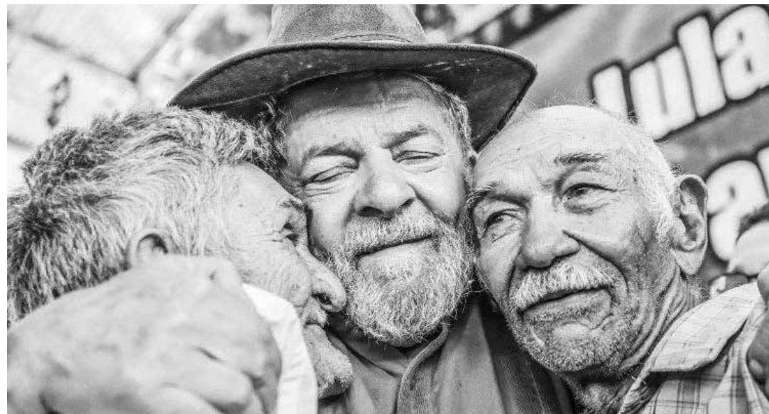
Lula ha recibido la solidaridad de los pueblos.