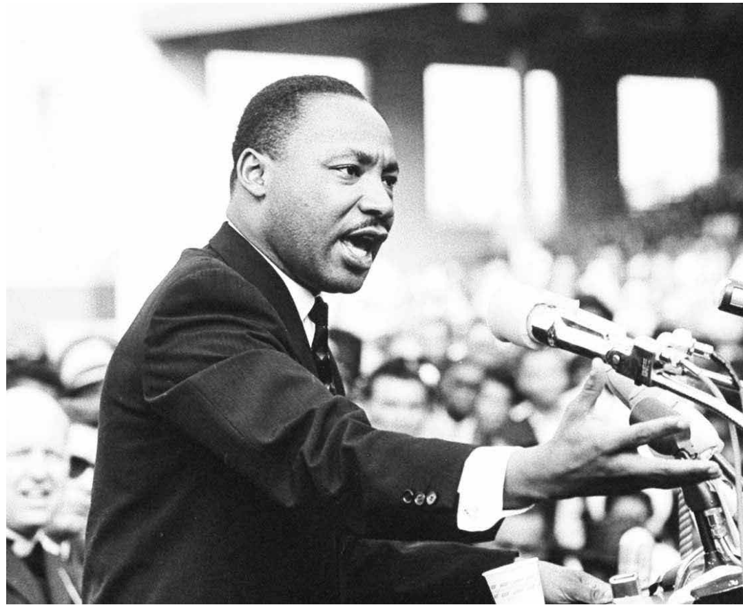
Persiste la violencia contra los afrodescendientes.

Martin Luther King fue un activista del siglo XX que luchó contra la discriminación racial, el capitalismo y el imperialismo estadounidense. Nació el 15 de enero de 1929 en Atlanta, Georgia. Su pedagogía emancipadora se sustenta la economía. Cuando le habla a los poderosos es claro: "ustedes no pueden hablar de una resolución del problema económico de los negros sin hablar de millones de dólares. Ustedes en verdad falsean la realidad porque tienen negocios con los capitanes de la industria. Eso significa ahora que ustedes se mueven en un mar agitado, porque eso significa que hay algo que no funciona con el capitalismo. Debe haber una mejor distribución de la riqueza". Martin Luther King cree en un Estados Unidos más cercano a Abraham Lincoln que al emporio bélico de Thomas Jefferson, los hermanos Charles Foster y Allen Dulles, Henry Kissinger y Joseph McCarthy. "Hemos guiado a los misiles y desviado a los hombres", dice. Tiene plena consciencia de que "lo que se obtiene con violencia, solamente se puede mantener con violencia" y de la arrogancia imperialista ya que "Estados Unidos es el mayor exportador de violencia en el mundo" porque ejerce terrorismo de Estado, practica el genocidio, planifica la eliminación de gobiernos inconvenientes a Estados Unidos, y prioriza los intereses corporativos de Wall Street.