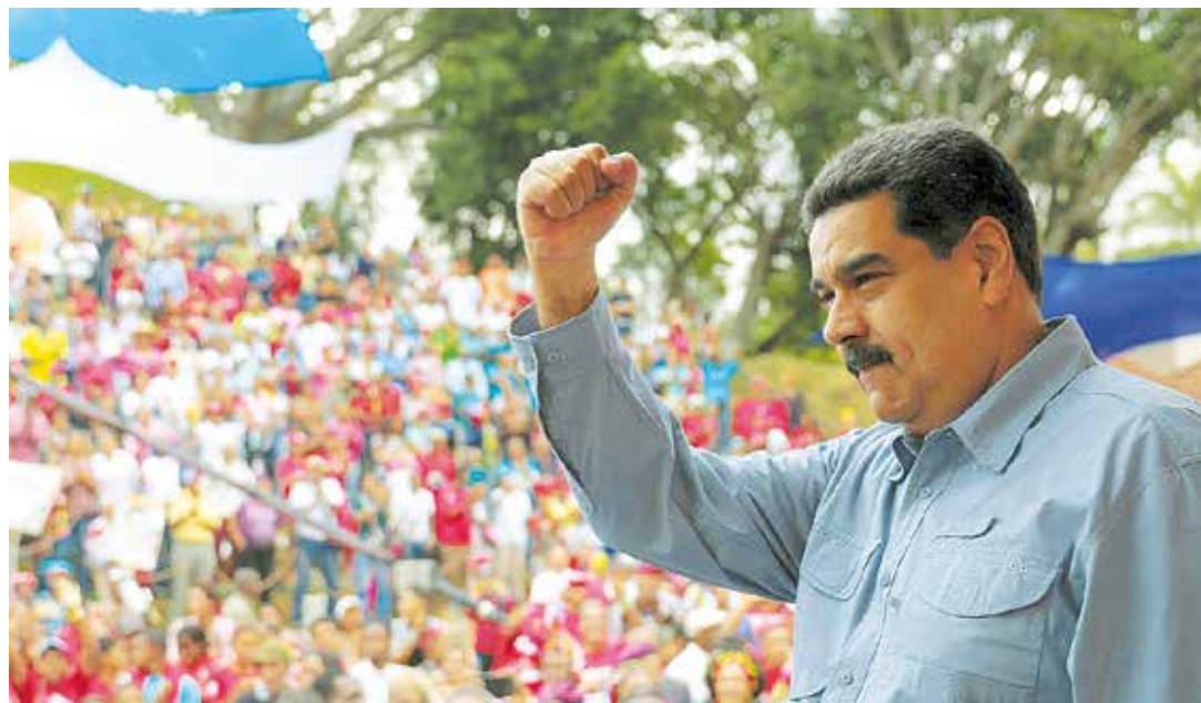
Venezuela no se convertirá en una colonia gringa.

"Hemos logrado la unión perfecta, la unión perfecta es la unión política en un proyecto, el Plan de la Patria 2025, la unión perfecta es la unión histórica en las raíces de Bolívar, en las raíces revolucionarias de Zamora, en las raíces revolucionarias del legado del comandante Hugo Chávez, tenemos una unión perfecta en lo histórico", resaltó Maduro en el acto, en el cual llamó a los venezolanos a prepararse a la lucha comunicacional e informativa por la verdad de Venezuela ante los ataques