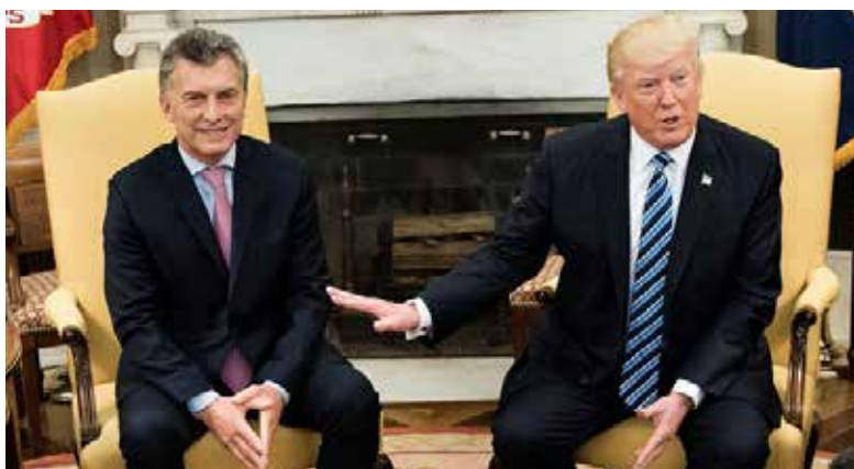
Donald Trump y Mauricio Macri, presidentes de EE. UU. y Argentina, respectivamente.

del Arco Minero del Orinoco (en donde, hace pocos días, se certificó la existencia de la cuarta mina de oro más grande del mundo, de la que se podrían extraer 1480 toneladas del metal precioso).