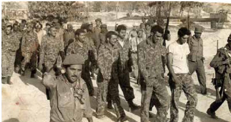
Primera derrota de EE. UU. en América Latina.

En el marco de la reunión de Ministros de Finanzas del G20, recientemente en Buenos Aires, funcionarios brasileños y colombianos promovieron la tesis de un "plan de reconstrucción económica para Venezuela", bajo esquemas de crédito de organismos financieros internacionales y colocando como garantía -¿o botín?- las enormes riquezas