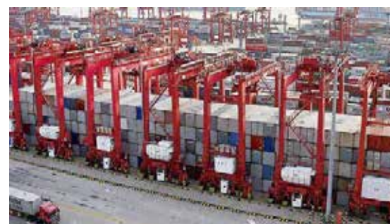
CHINA - EE.UU.