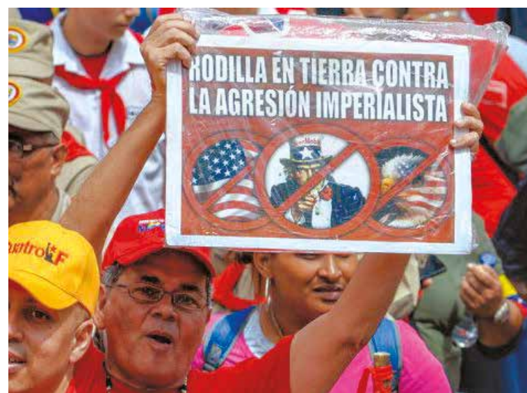
Movilización contra la agresión imperial.