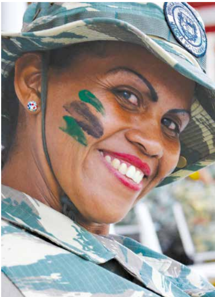
Mujeres milicianas en defensa de la Patria.

atentaron contra la democracia aquel 11 de abril, son los mismos que hoy se levantan contra la Patria solicitando al imperio “bombardeos humanitarios” contra nuestro pueblo, porque el golpe continúa.