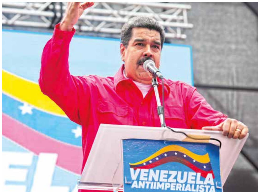
El primer mandatario condenó el ataque contra Siria