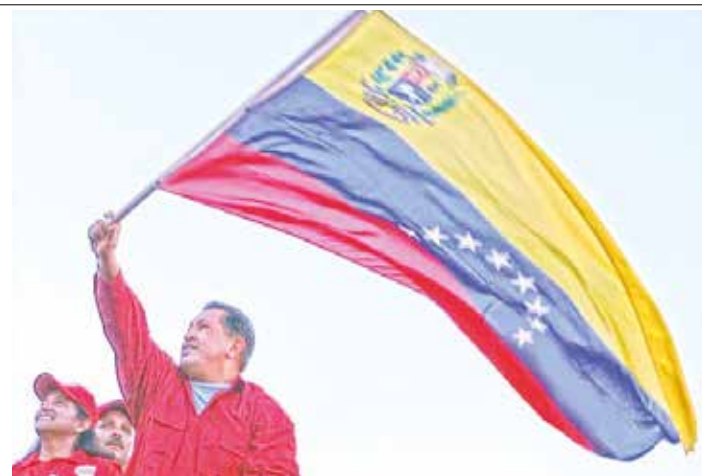
Hay que elevar la conciencia revolucionaria.

Es esa misma conciencia revolucionaria, es ese mismo espíritu democrático -el de la deliberación en todos los espacios, el de la construcción