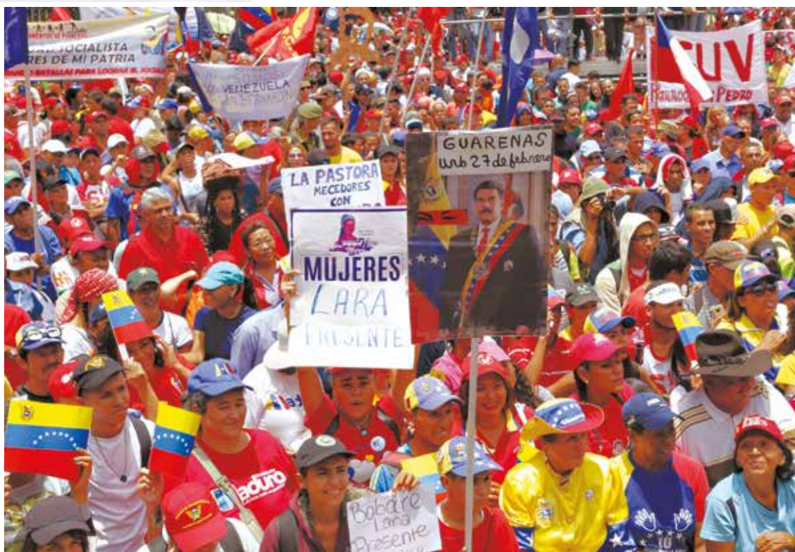
Todo 11 tendrá su 13.

“La batalla es construir un país, hemos echado las bases, pero la Patria Grande está por construir... ¿La va a construir Julio Borges y Ramos Allup?”, se preguntó.