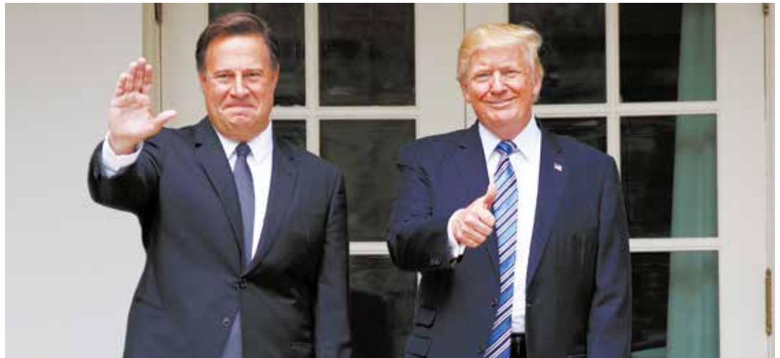
El presidente de Panamá sigue las directrices de Trump.

Protección a la economía El Gobierno de la República Bolivariana de Venezuela suspendió por 90 días las relaciones económicas con otras 50 empresas panameñas, como una medida de protección de la economía nacional. La Gaceta Extraordinaria número 6.372, que circuló este jueves 12 de abril, indica que estas 50 empresas