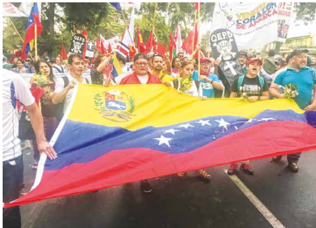
En defensa de la dignidad.

"Solo el pueblo salva al pueblo" decía Chávez, que ha sabido interpretar y modular la voz de los sin voz. Solo el pueblo organizado puede defender ahora la trinchera constituida por Cuba y Venezuela. Una trinchera asediada con armas y con mentiras