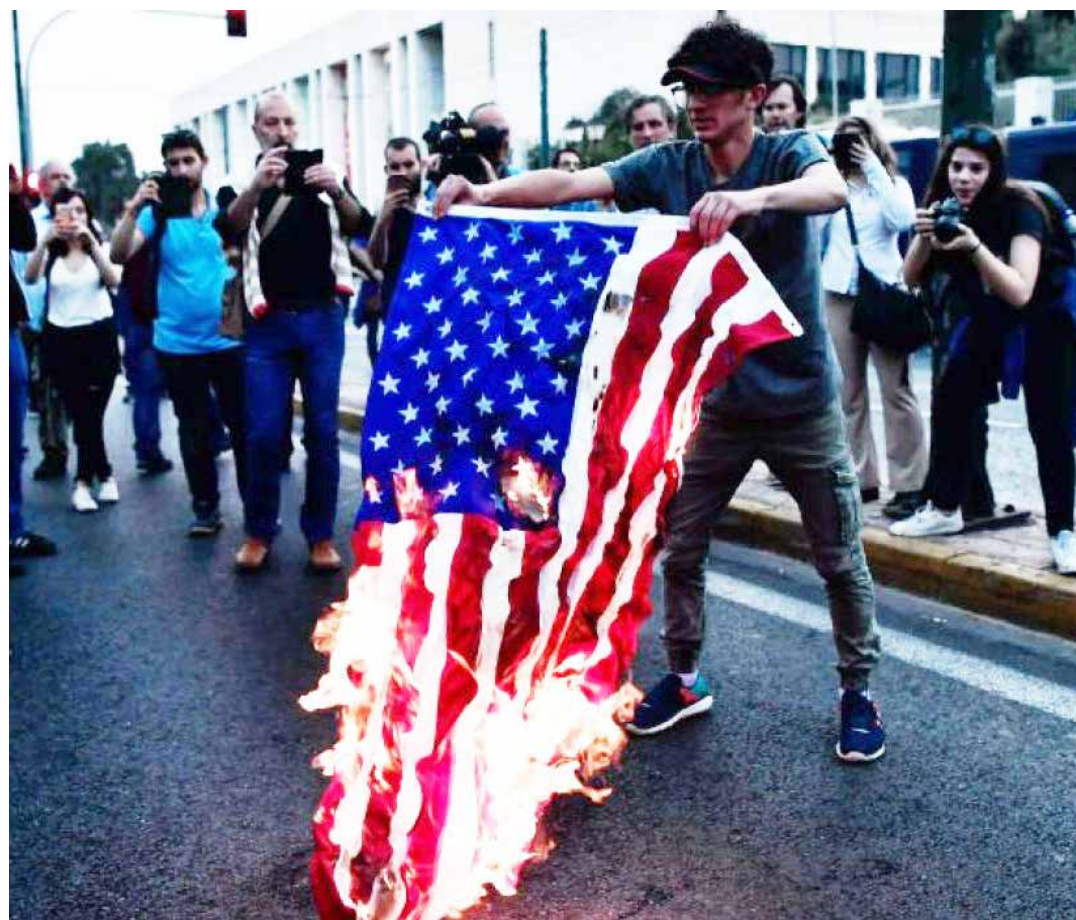
El mundo se ha levantado contra la agresión injustificada a la nación árabe.

cen hoy en Siria, pretenden hacerlo contra Venezuela los agentes de la derecha y el neoliberalismo regional que buscan a toda costa una intervención militar en la Patria de Bolívar y Chávez para derrocar a la Revolución Bolivariana.