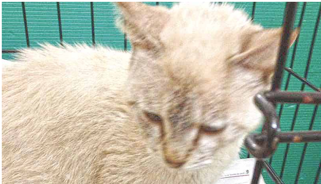
La gatita maltratada es madre de dos cachorros.