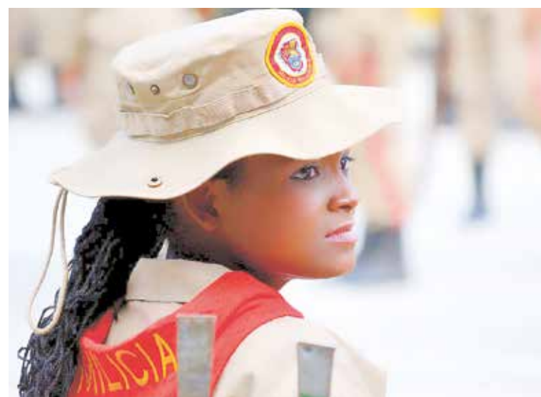
La milicia crecerá a un millón de combatientes.