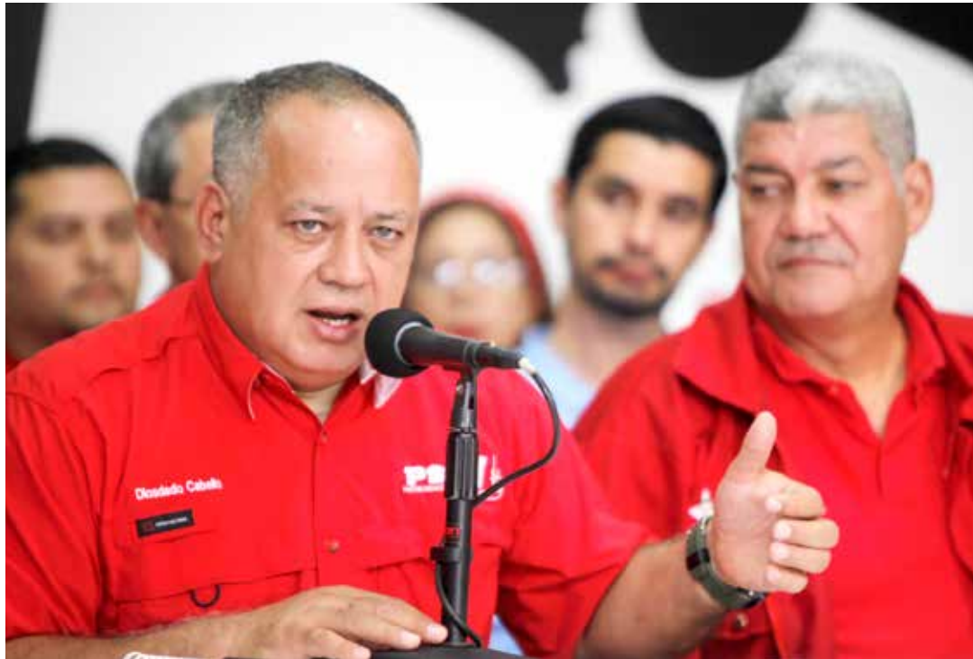
Diosdado Cabello: Borges pide más sanciones para Venezuela.

En lugar de un canal humanitario, pedimos que nos dejen comprar la comida y las medicinas que necesitamos, pedimos que cese el bloqueo