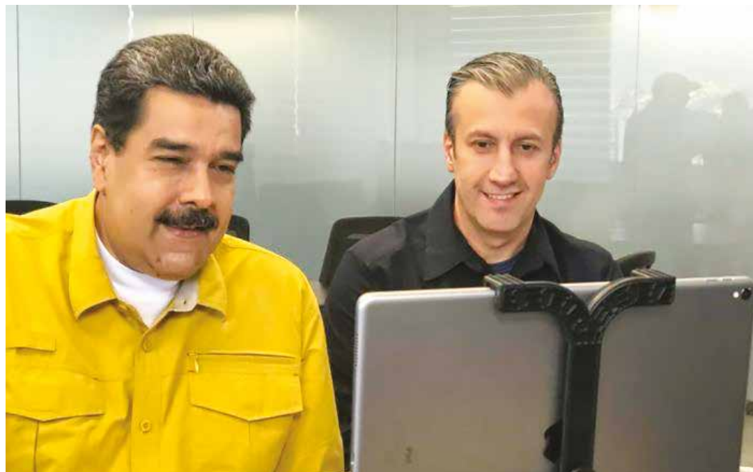
Es el segundo incremento de salario durante este año.