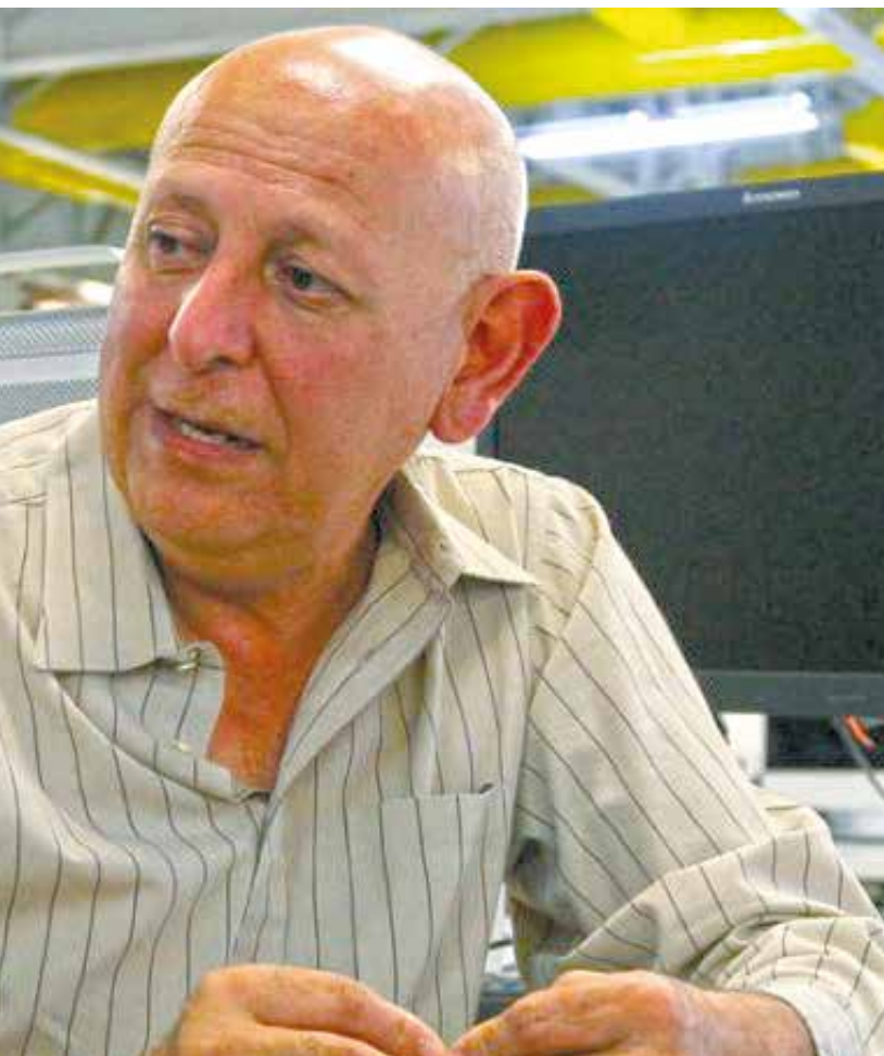
Revolución Bolivariana.

demás luchas nacionalista defendedora del pueblo venezolano. No nos derrotarán.