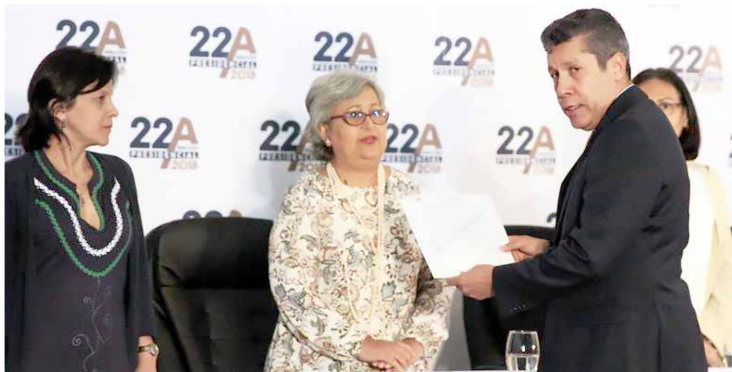
Fue aceptada la postulación de Falcon como candidato presidencial.

"¿No les parece una locura el llamado a la abstención?", inquirió el mandatario, al tiempo que acusó a la oposición de estar "subordinada a Estados Unidos y a la derecha internacional". Destacó igualmente que en los comicios del 20 mayo venidero, cuando se elegirán Presidente de la República, consejos legislativos estatales y concejos municipales, habrá oportunidades y participación de varios candidatos opositores. "Se van a sorprender de cuántos candidatos, decenas y cientos, se