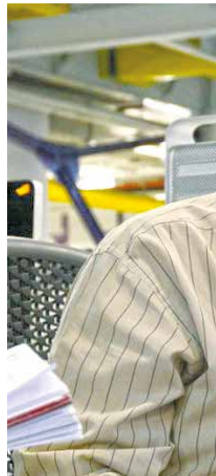
Cárdenas: las petroleras gringas quieren acabar con la

No hay duda que desean destruir el Estado-Nación desde el exterior e interior. Un lugar de eso es la frontera colombo-venezolana, donde el contrabando, especulación y lavado de dinero tiene presencia en el sitio limítrofe. Según investigaciones de los mismos Estados Unidos los bancos Citibank y JP Morgan