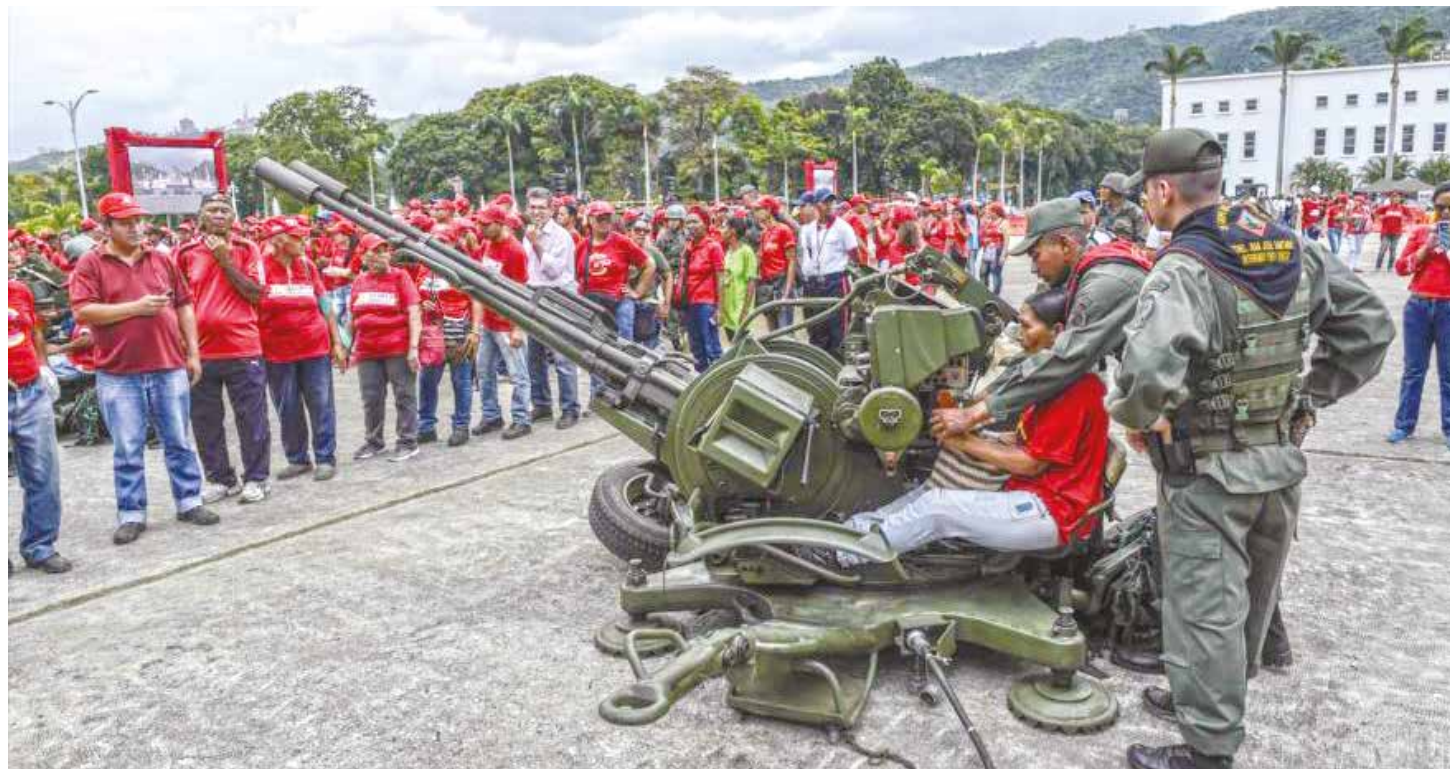
La unión cívico-militar se fortalece ante las amenazas.

Pese a las dificultades que hoy tenemos los venezolanos para cubrir nuestras necesidades básicas nuestro pueblo está consciente de los esfuerzos que realiza el Gobierno Bolivariano para proteger a las mayorías