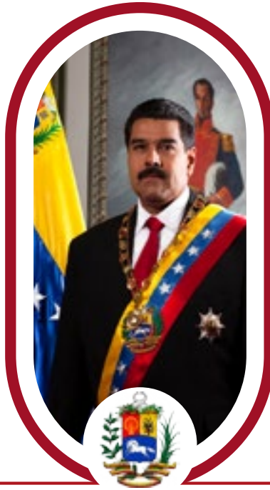
Nicolás Maduro PRESIDENTE

Se consiguió la solidaridad diplomática de la mayoría de los Estados Latinoamericanos y Caribeños.