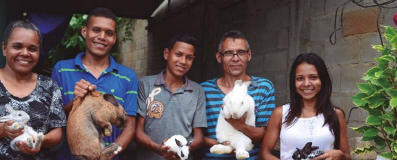
Criadores de conejos del sector Carrizalito, parroquia Magdaleno, municipio Zamora

“...Aquí en la parroquia Magdaleno el 30% de la producción es de conejo y el otro 70% es de madera...”