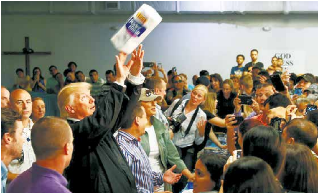
Trump humilló al pueblo de Puerto Rico.