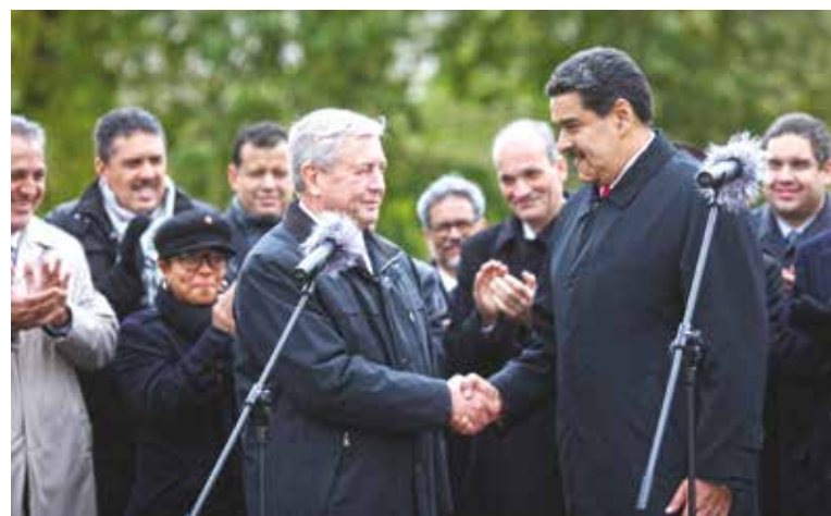
Nuevas alianzas en un mundo multipolar.

- Al pueblo norteamericano siempre le decimos la verdad: Venezuela lo único que exige es respeto. El tiempo del intervencionismo estadounidense en América Latina y el Caribe tiene que quedar atrás. En 1826 el Libertador Simón Bolívar dijo, casi como una profecía, los Estados Unidos de Norteamérica parecen destinados por la providencia a plagar la América de miseria en nombre de la libertad. Y el siglo XIX y XX en nombre de "la libertad" invadieron Haití, República Dominicana, Nicaragua, Panamá, Granada. En nombre de la libertad impusieron a Pinochet en Chile y a Videla en Argentina. Hubo décadas de dictaduras abiertas y democracias represivas. Venezuela desde 1999 tomó su propio camino de independencia política, de construcción de su modelo económico y de identidad cultural y social. Nosotros llamamos a nuestro camino: Revolución Bolivariana. Venezuela es el objeto más deseado de los círculos