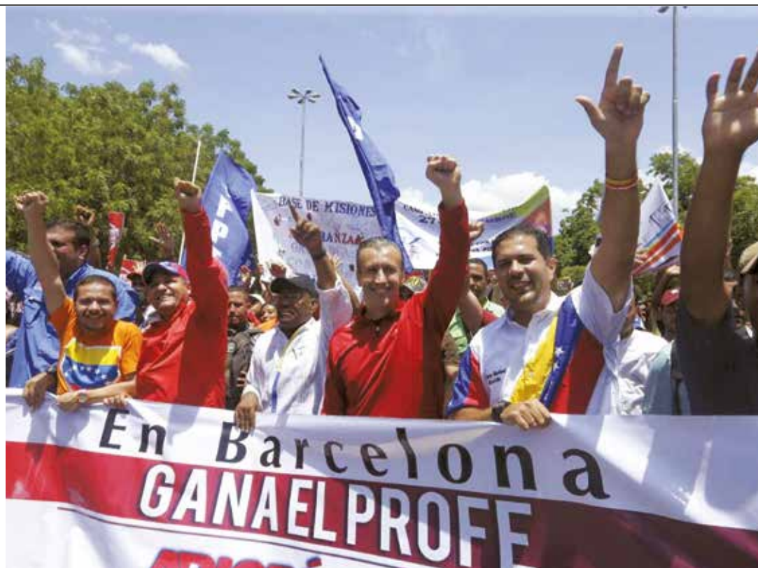
El pueblo en la calle

Las acciones violentas de la MUD durante 2017 y que preceden estas elecciones, dejan claro al chavismo que ningún espacio político regional debe desperdigarse o someterse a los designios de los factores antichavistas. No nos imaginemos el horror para los habitantes de estados como