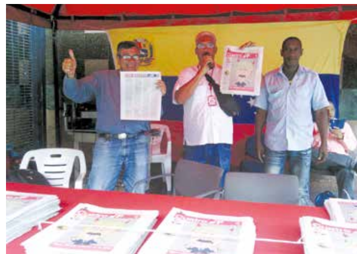
Equipo político del Ministerio de Finanzas.

Con el apoyo de VTV se distribuyeron más de tres mil constituciones cuando el proceso constituyente, y se han repartido más de mil ejem-