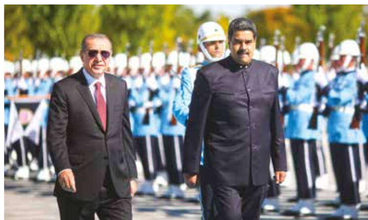
Maduro se reunió con el presidente de Turquía

"Tengamos claro que la conciencia anticolonialista, antiracista y antiesclavista se forjó tras siglos de lucha y hoy son parte de los valores de la humanidad, por eso hay un gran rechazo a los ataques del gobierno de Estado Unidos que pregona la supremacía imperial", explicó. •