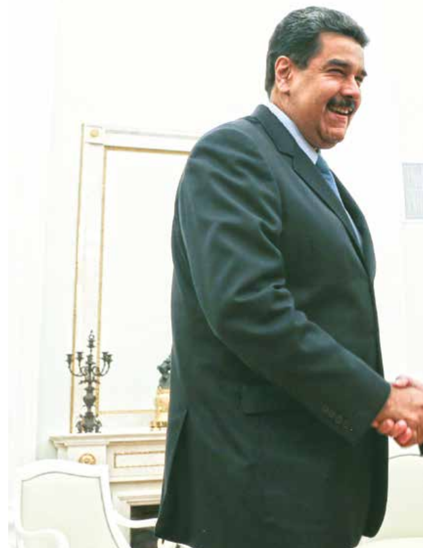
Se estrechan las relaciones con Rusia

Me gustaría preguntarle de nuevo, si le preocupa que los