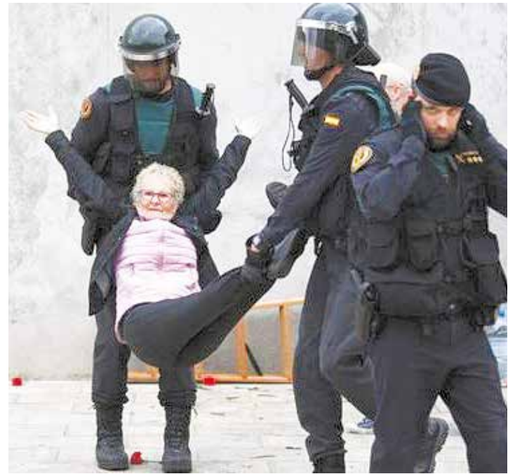
La Guardia Civil española en acción.

El presidente catalán ha añadido que "las instituciones catalanes tienen el deber de respetar e implementar lo que hoy han decidido sus ciudadanos". •