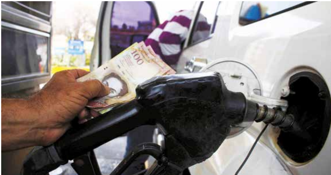
Los combustibles en Venezuela entre los más baratos del mundo.