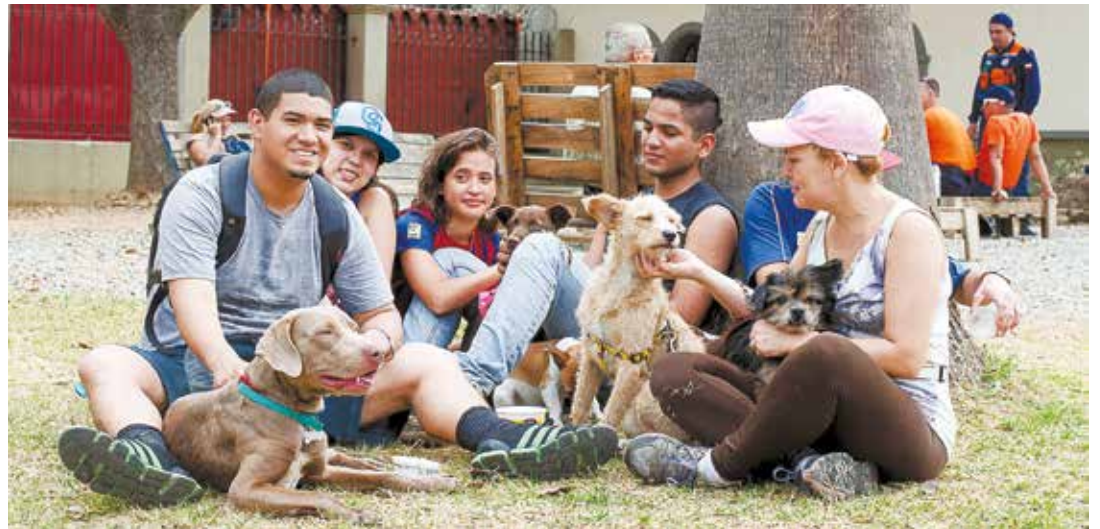
Se trata de implementar el quinto objetivo del Plan de la Patria.

La Misión Nevado, creada y desarrollada como política del Gobierno del Presidente Nicolás Maduro, ha significado un salto cualitativo en la lucha por los derechos de los animales en nuestro país, despertando conciencia en cientos de miles de personas que han participado tanto de nuestras actividades como