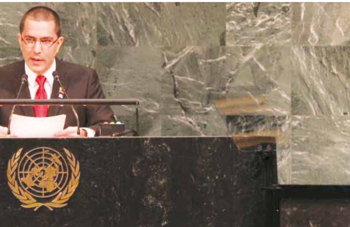
La voz de Venezuela retumbó en la ONU.

Dentro de la estrategia intervencionista de los Estados Unidos, con el apoyo de políticos locales afiliados a la MUD, se busca aislar a Venezuela en el ámbito internacional, con la finalidad ulterior de proceder a una intervención para imponer un gobierno títere que les garantice el acceso a las reservas petroleras de Venezuela, las más grandes del mundo.