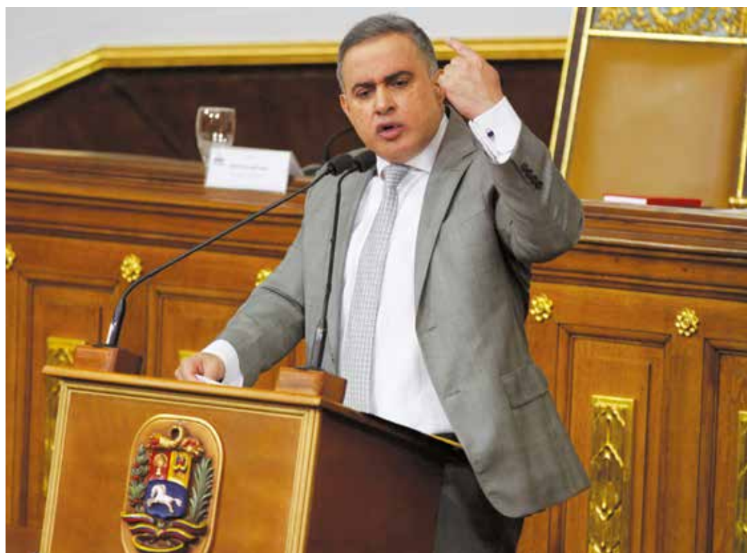
El Fiscal ha denunciado la inacción de Ortega Díaz

menzó con 19 involucradas en sobre facturación de precios y otros delitos estimulados en las leyes venezolanas.