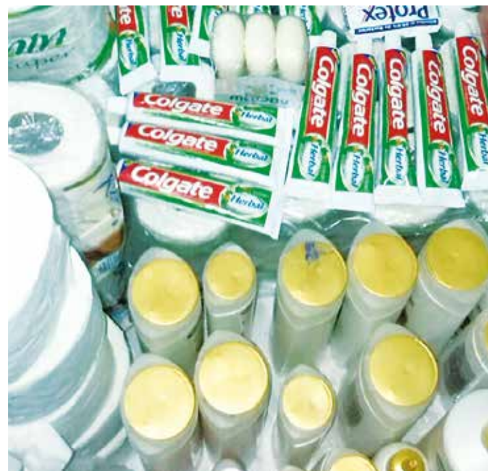
Los 50 en el ojo del huracán.