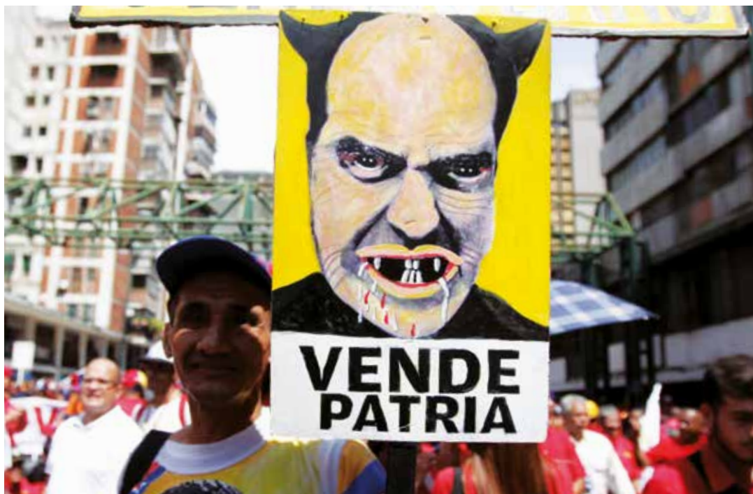
El imperio tiene aliados locales.

con la Asamblea General de la ONU y con la agresión del nuevo "Hitler" de la política imperial "el magnate se cree dueño del mundo, pero a Venezuela no la agrede nadie".