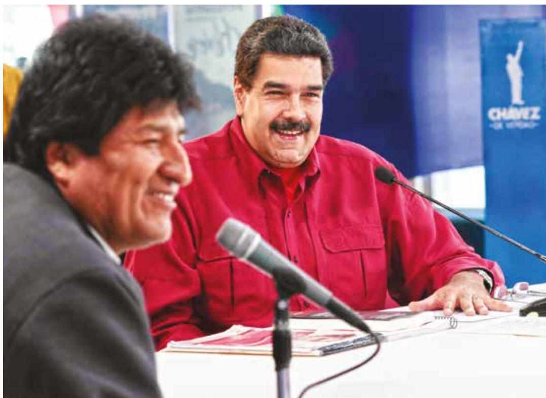
Nicolás Maduro compartió con Evo Morales.

Celebró la jornada "Todos Somos Venezuela" que se activó desde el sábado 16 de septiembre con la participación de más de 200 delegaciones de diferentes países de los cinco continentes, con la misión de defender el proceso social que impulsa la Revolución Bolivariana, ante las imposi-