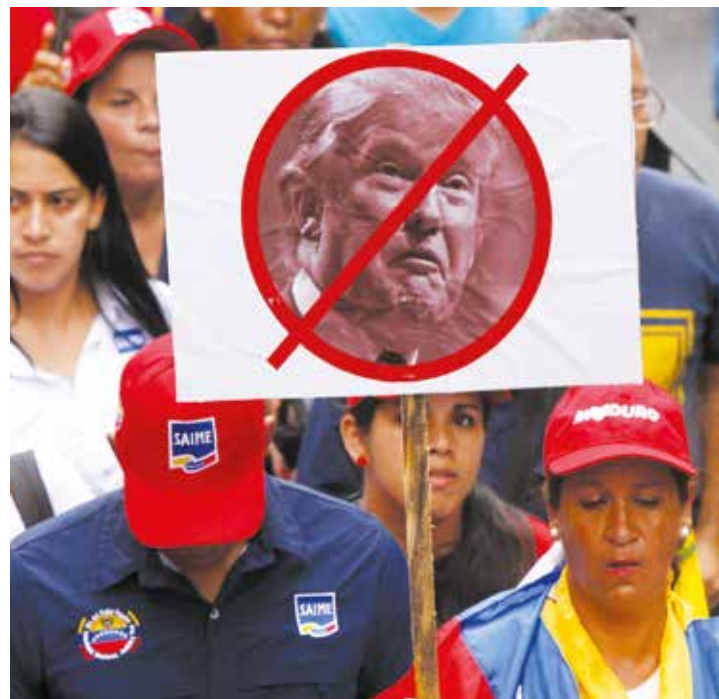
Trump no conoce a los venezolanos.

Tenemos fuerza, poder económico y el apoyo del mundo nuevo para que no nos hagan daño con sus sanciones aseguró el primer mandatario. Explicó que el evento Todos Somos Venezuela, coincidió