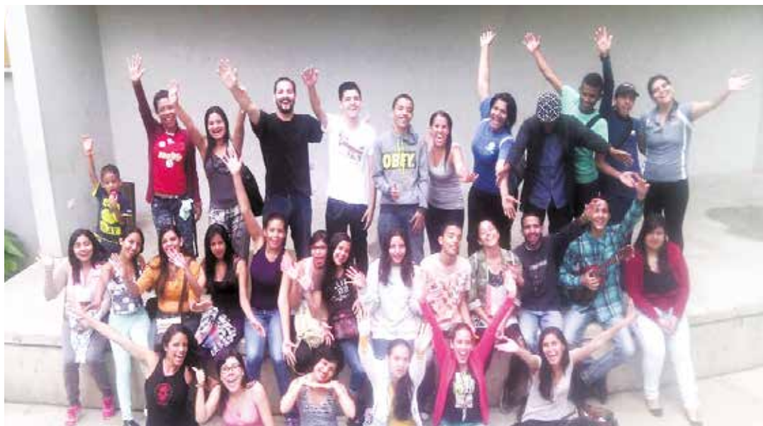
Los jóvenes en acción.

Allí, a la sombra de sus árboles y favorecidos por el acogedor clima que nos acompañó durante los cuatro días de actividad, las y los facilitadores de Comunicarle compartimos saberes en las disciplinas de actuación, expresión corporal, estatismo, música y creación plástica; que serán algunas de las áreas que el naciente "Chambearte Los Teques" comenza-