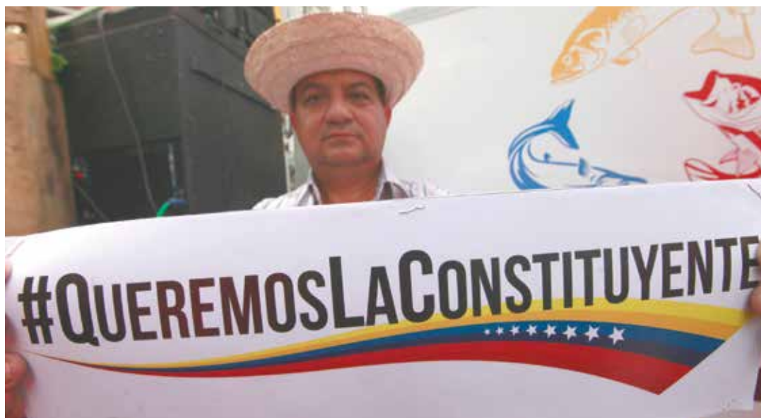
Un pueblo con conciencia de clase supera cualquier contrariedad.

El maleficio no ha sido exorcizado. Cada vez que convocan a una Asamblea