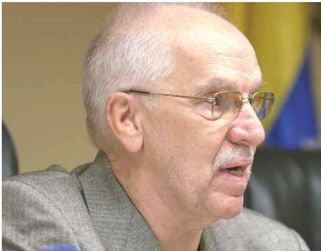
El diputado explica que la Constituyente es una oportunidad.