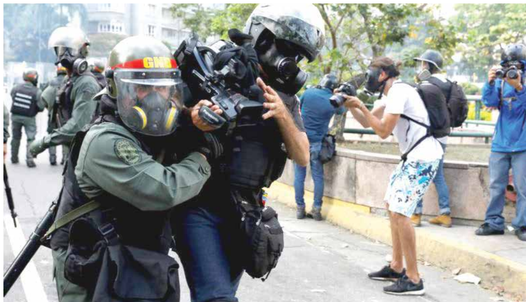
Un heroico guardia nacional rescata a un camarógrafo.

Pero el asesinato de Niumar no fue un hecho aislado, limitado geográficamente o producto de alguna actuación individual. Desde ese día, 19 de abril, hasta la segunda semana de mayo, más de 70, sí, setenta, guardias ha resultado heridos. La mayoría por piedras y objetos contundentes, pero llama