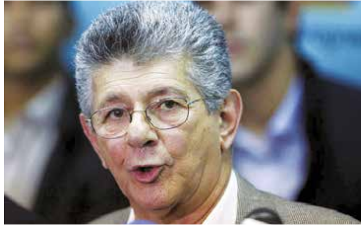
El dirigente adeco vaticina muertes.

El diputado del partido Acción Democrática y expresidente de la Asamblea Nacional, brindó declaraciones con el lenguaje en extremo agresivo y violento que lo caracteriza, en el que volvió a llamar “ladrones, narcoterroristas y asesinos” a líderes del Partido Socialista Unido de Venezuela, como Diosdado Cabello y