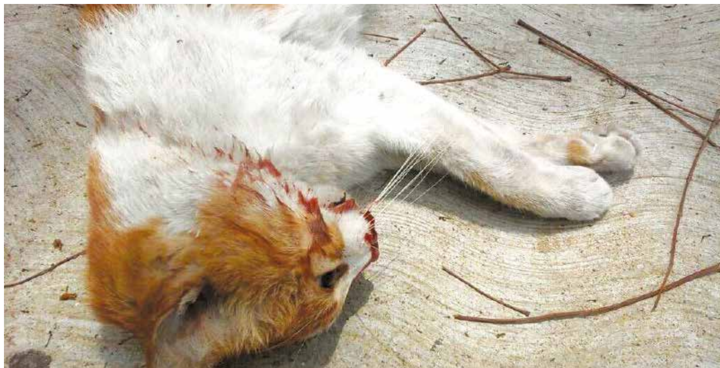
Kity fue asesinada brutalmente.

Descansa en paz querida Kity. Tu no eras ni chavista, ni opositora. Tu no debiste ser una mártir de esta locura que otra vez sacude a Venezuela. •