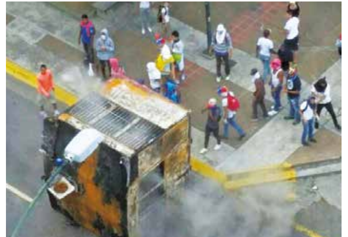
Fascismo contra el sistema Metro de Caracas.