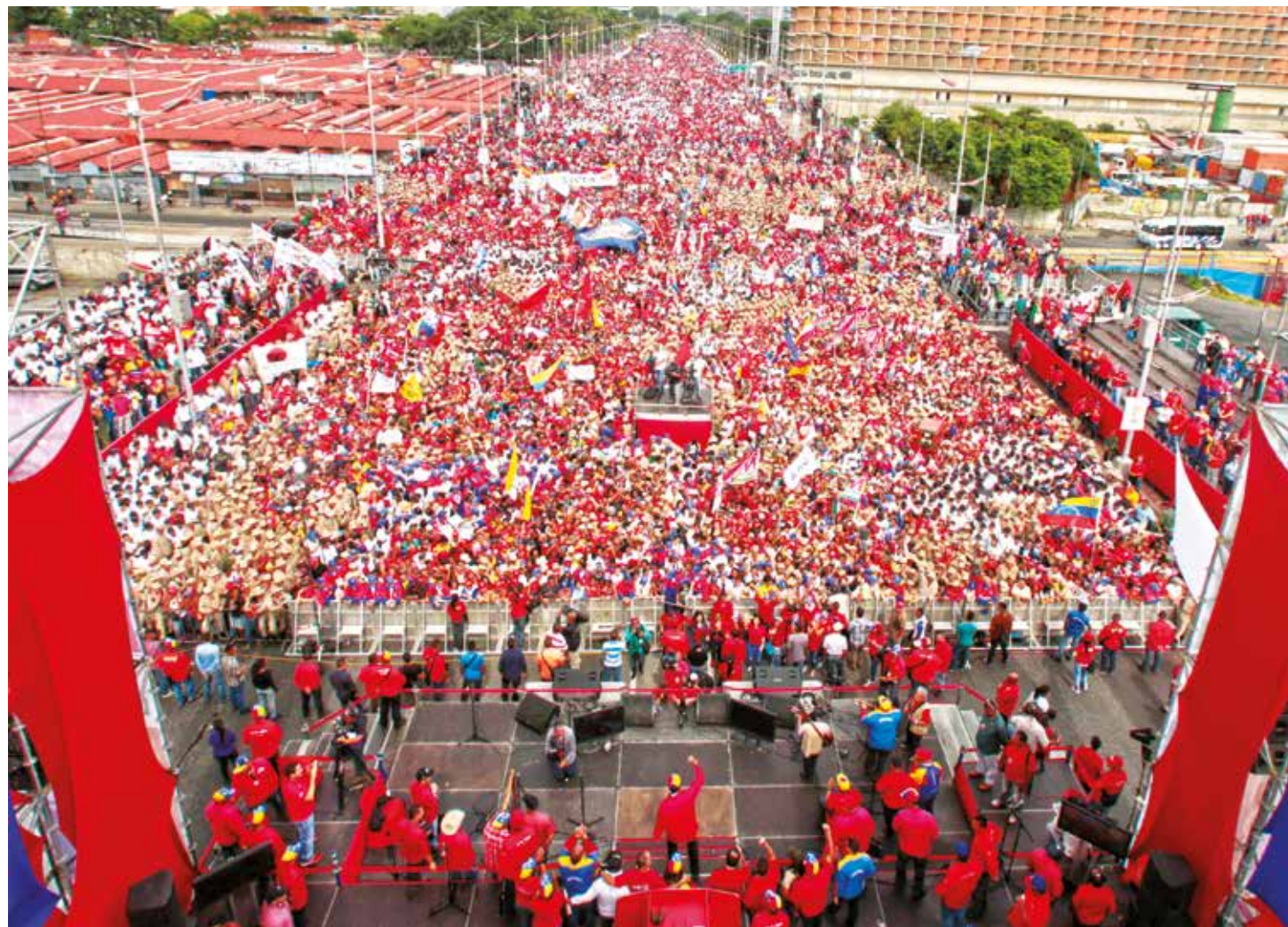
El 19 de abril el pueblo salió en defensa de la Patria.

"Hoy me han respondido por cuatro vías distintas. Están dispuestos a sentarse en el diálogo, me parece justo. Se lo han dicho a importantes personalidades internacionales", reiteró el Mandatario nacional desde el centro asistencial de la Misión Barrio Adentro María Eugenia González, ubicado en Fuerte Tiuna.