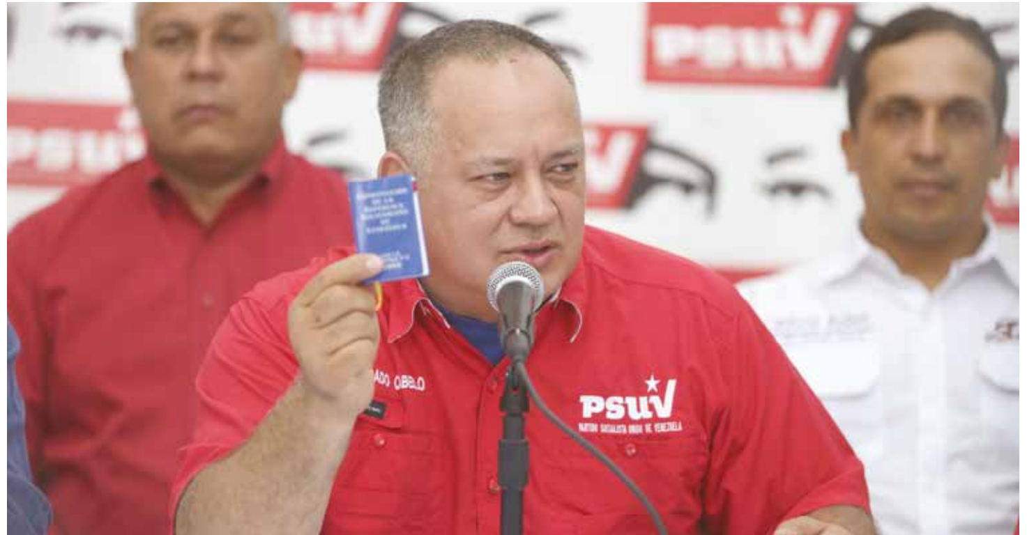
El vicepresidente del PSUV instó a aplicar todo el peso de la ley a los terroristas.

"Que dice la Ley Orgánica contra la delincuencia organizada y financiamiento al terrorismo: 'Aquel acto intencionado que por su naturaleza o su contexto pueda perjudicar gravemente un país... cometido con el fin de intimidar gravemente a una población, obligar indebidamente a los gobiernos a realizar actos o abstenerse de hacerlo, o desestabilizar gravemente o destruir las estructuras políticas fundamentales constitucionales económicas o sociales de un país...' 'por eso nosotros decimos que no son guarimberos, son terroristas' señaló Cabello.