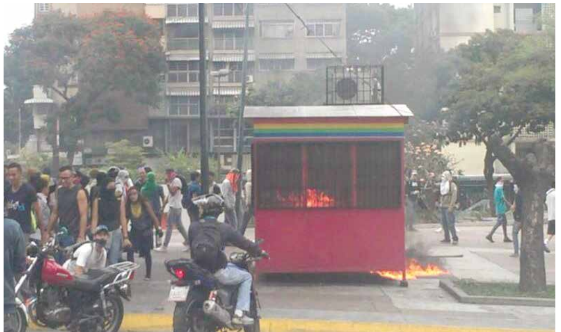
Puesto de control de Altamira fue incendiado.

En horas de la tarde de este lunes 10 de abril, tras una movilización convocada por la autodenominada Mesa de la Unidad (MUD) en la plaza Brión de Chacaíto, grupos de choque se concentraron a la altura de Altamira, en el municipio Chacao, donde atacaron el puesto de control de las unidades de Metrobús, desde donde operan las unidades de transporte a distintas zonas