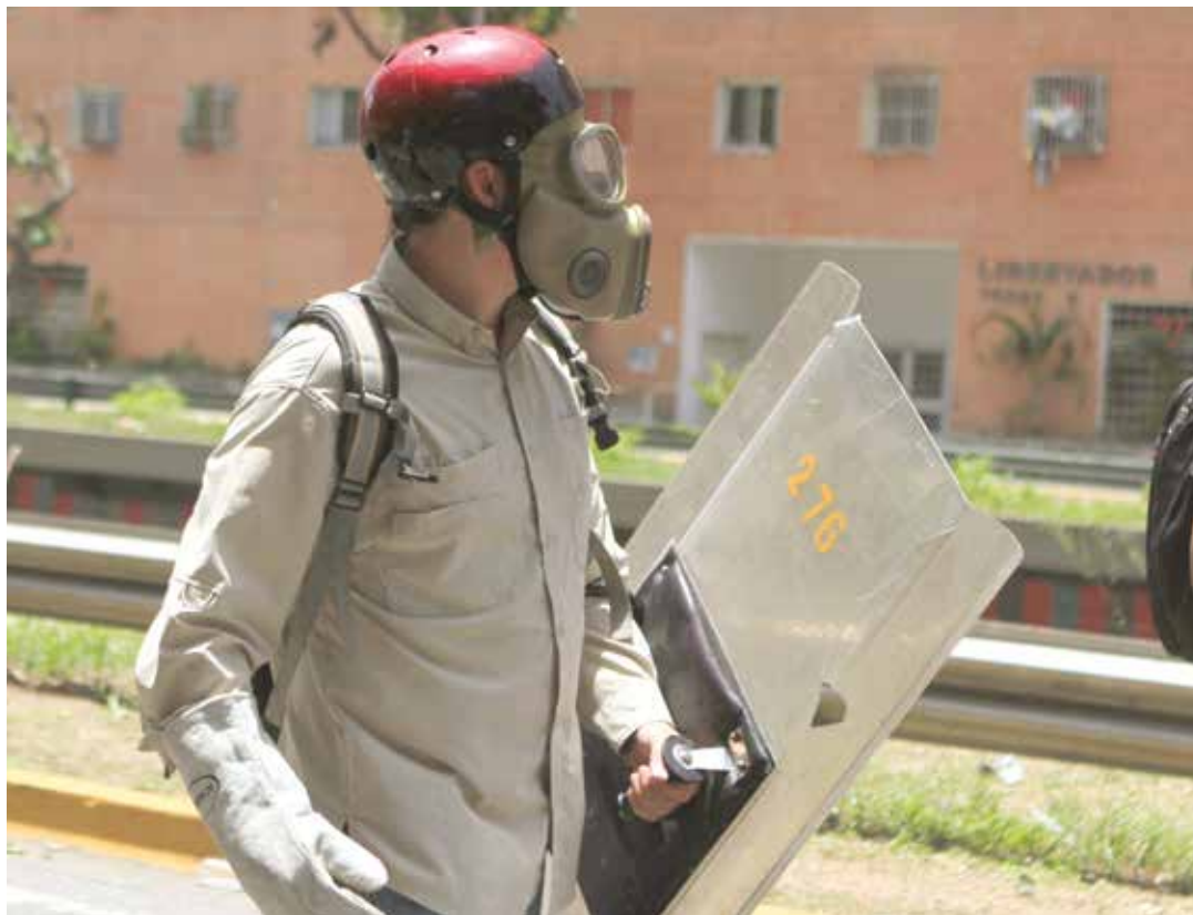
Se pretende aplicar el guión ejecutado en Ucrania.

de forma absoluta el derecho a la manifestación pacífica, impidiendo así la realización de cualquier tipo de reunión o manifestación. Por lo tanto, cualquier concentración, manifestación o reunión pública que no cuente con el aval previo de la autorización por parte de la respectiva autoridad competente para ello, podrá dar lugar a que los cuerpos policiales y de seguridad en el control del orden público a los fines de asegurar el derecho al libre tránsito y otros derechos constitucionales (como por ejemplo, el derecho al acceso a un instituto de salud, derecho a la vida e integridad física), actúen dispersando dichas concentraciones con el uso de los mecanismos más adecuados para ello, en el marco de lo dispuesto en la Constitución y el orden jurídico".