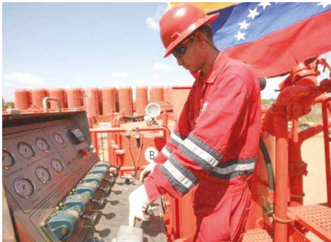
Venezuela está en el ojo del huracán.

Pero el cálculo de las reservas venezolanas tiene otra arista a saber. La base de cálculo de las reservas en la Faja yace en un factor de recobro calculado de 20%. Es decir, los tan mencionados casi 300 mil millones de barriles de petróleo es el 20% extraíble de lo que hay ahí que en términos de la materia se denomina "Petróleo Original en Sitio (POES)". Por tratarse de crudo extrapesado, se cuantifica un 20% que es extraíble con las tecnologías actuales. Pero la