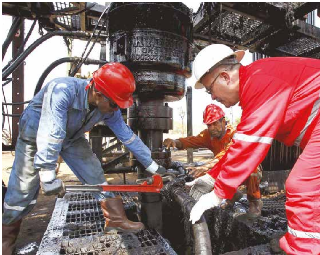
Las reservas de crudo de Venezuela son las mayores del mundo.

su consumo el crudo venezolano. La cuestión de la Faja del Orinoco es para el mediano y largo plazo de manera tal que en un futuro no muy distante habrá sólo un puñado, una decena de países, que contarán con reservas cuantiosas y a ellos acudirán unos 190 países consumidores esperando no quedar relegados al ostracismo energético y de las materias primas.