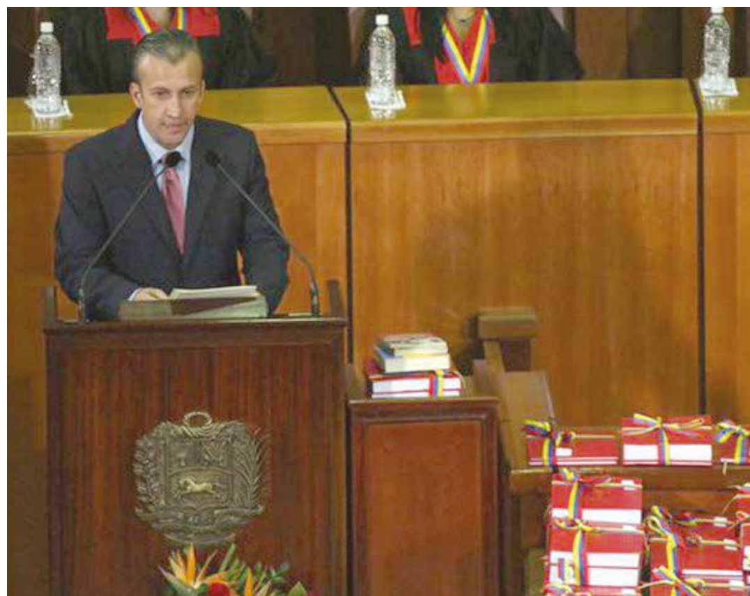
Destacó la conciencia popular como arma contra la guerra económica

"Este golpe se montó sobre una estrategia para bloquear financieramente las operaciones y transacciones realizadas por la República a los efectos de evitar que cumpliéramos con los proveedores de distintos bienes, materias primas para abastecer de medicamentos, alimentos y servicios al país" explicó. Las reiteradas declaraciones de los llamados "analistas de inversión" se inscriben dentro de esta estrategia, señaló, poniendo como ejemplo el caso de intercambio de bonos