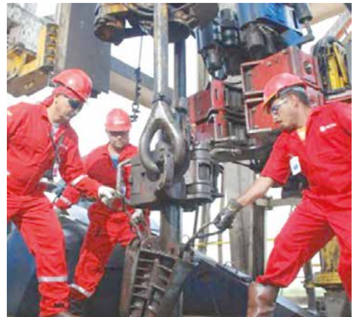
El petróleo apalanca el gasto social.

La guerra por el petróleo en Venezuela está en curso. Parece política, pero no es. Parece pacífica, pero no es. Es la explicación al duro momento, a la dura etapa en que vivimos y a nuestras encrucijadas. La guerra cae fuerte sobre nosotros, cuestión que nos demanda tomar un lugar, que nos obliga a definirnos concluyentemente, antes que, ojalá nunca, veamos el lado horrendo de las guerras armadas por petróleo que a otros les sobrevino sin tener idea, literalmente, de dónde estaban parados. •