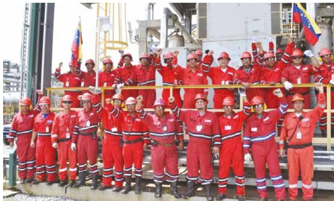
Los trabajadores: fortaleza de la revolución.

Antes de la Revolución Bolivariana las reservas venezolanas se encontraban "aseguradas" a la explotación, aprovechamiento y consumo casi exclusivo de EEUU. Hoy, con la diversificación de la política petrolera, el cambio es significativo si hablamos de la cartera de países que desarrollan actividades petroleras en Venezuela y a los cuales va para