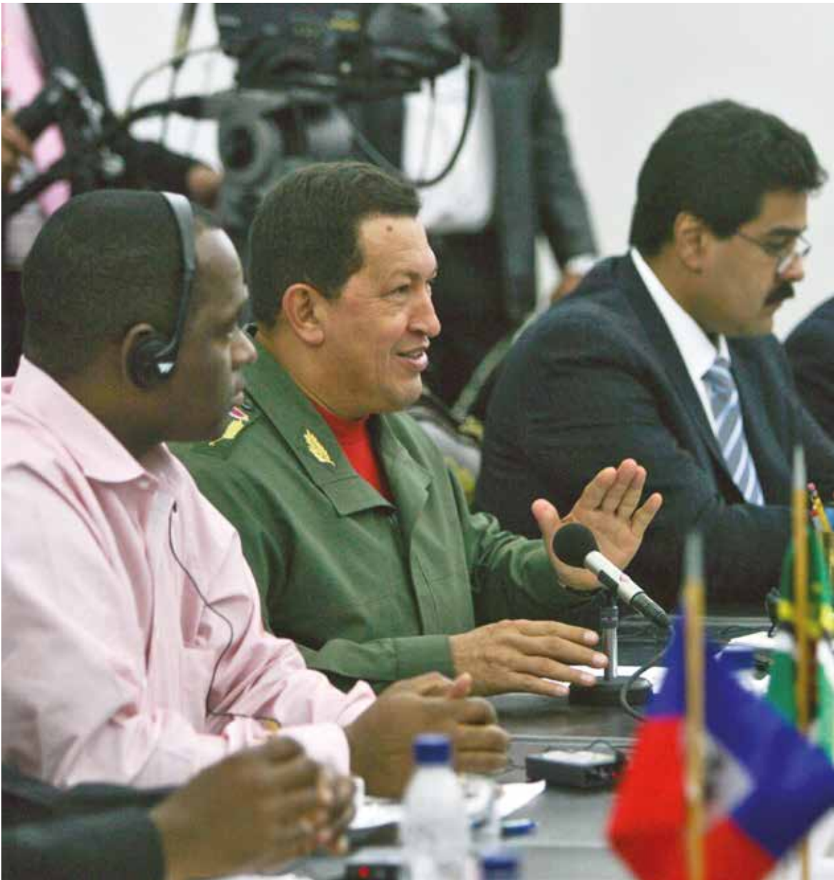
Petrocaribe nace de la mano de Hugo Chávez.

Por eso en aquella primera visita a La Habana, Fidel recibió a Chávez como un jefe de Estado, y no se equivocó.