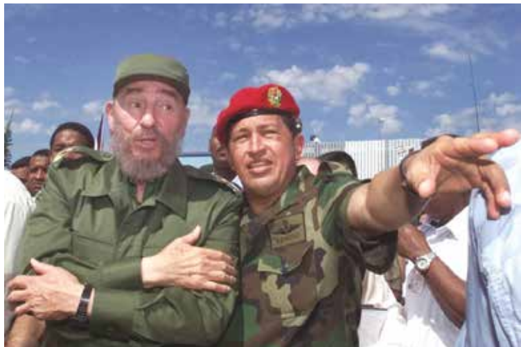
Fidel y Chávez, siempre hermanos.

“Fidel Castro, que ve mucho más lejos que todos nosotros, notó que estaba en presencia de un líder de un quilate diferente”.