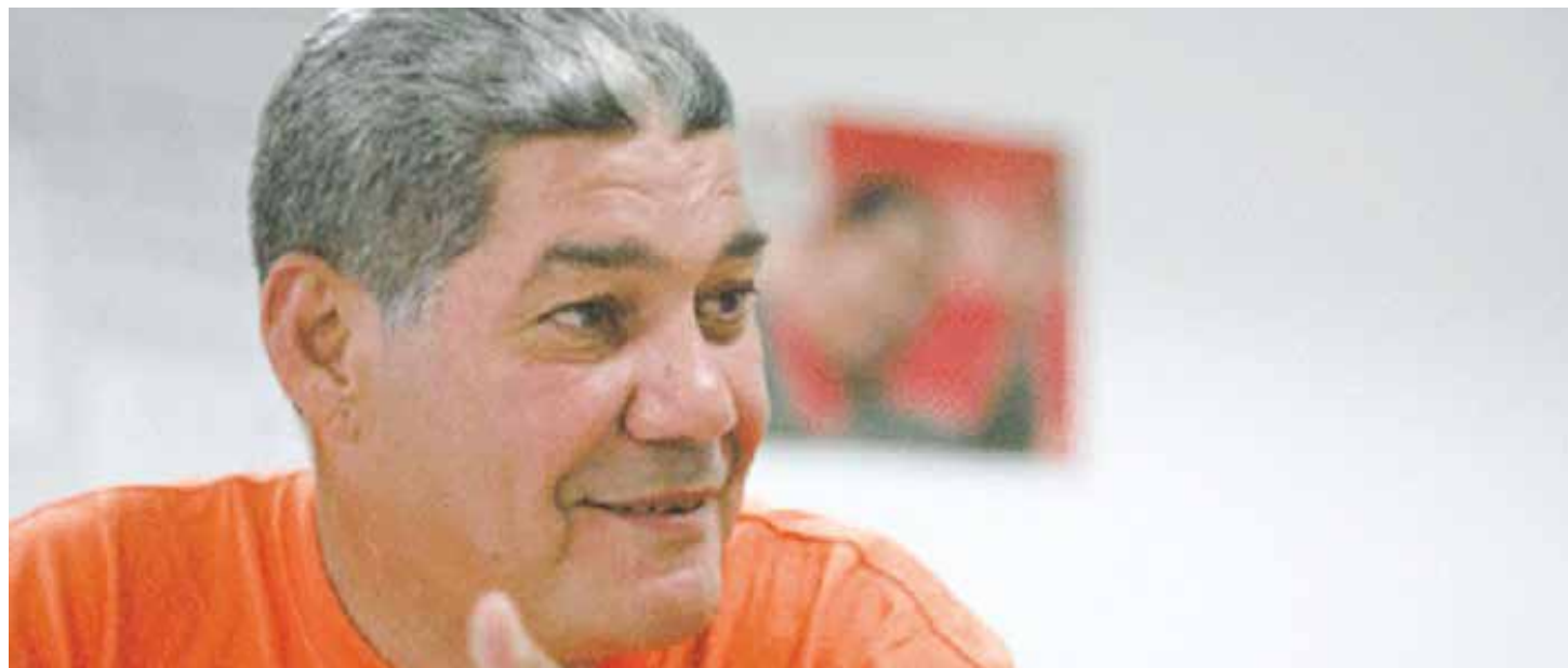
El dirigente del PSUV destaca las fortalezas del venezolano frente a las arremetidas.

“El chavismo es una concreción teórico-práctica que va direccionado a solucionar los