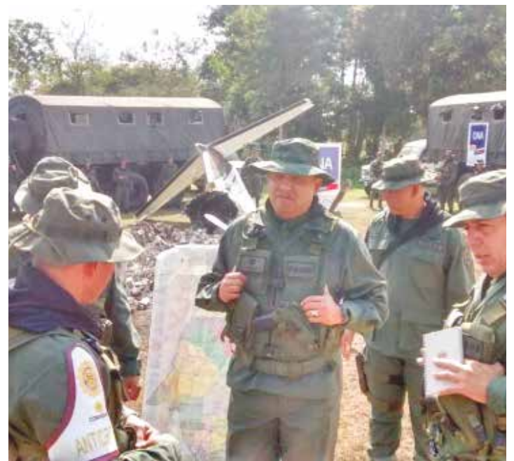
Se presume que la nave iba a cargar droga.

Cuando el blanco se ha vuelto hostil, ha ignorado la interceptación y la persuasión, la Fanb tiene un marco jurídico que le permite derribar el vuelo, y defender el espacio aéreo. •