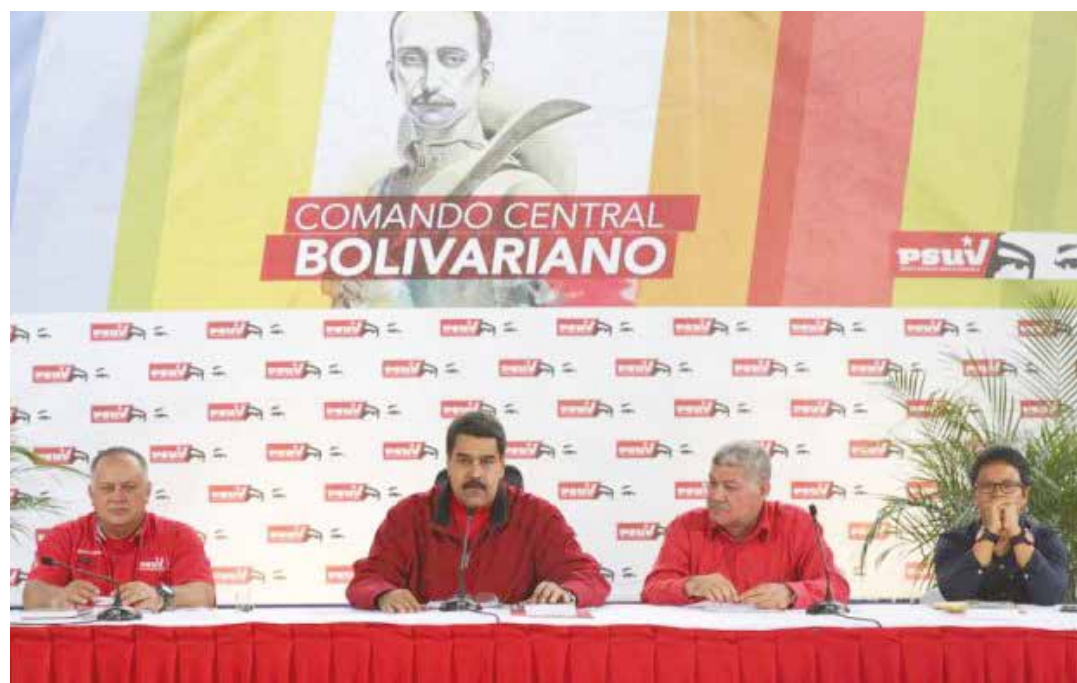
El PSUV busca asegurar las victorias electorales a venir en los próximos años.

“Debemos ir a la fundación de las sedes del partido en cada una de las parroquias. Veremos cuál se destaca. Nosotros debemos ir a cumplir la línea aprobada de fundar las sedes del Psuv que no haya ni una parroquia sin una sede (...) Por qué no,