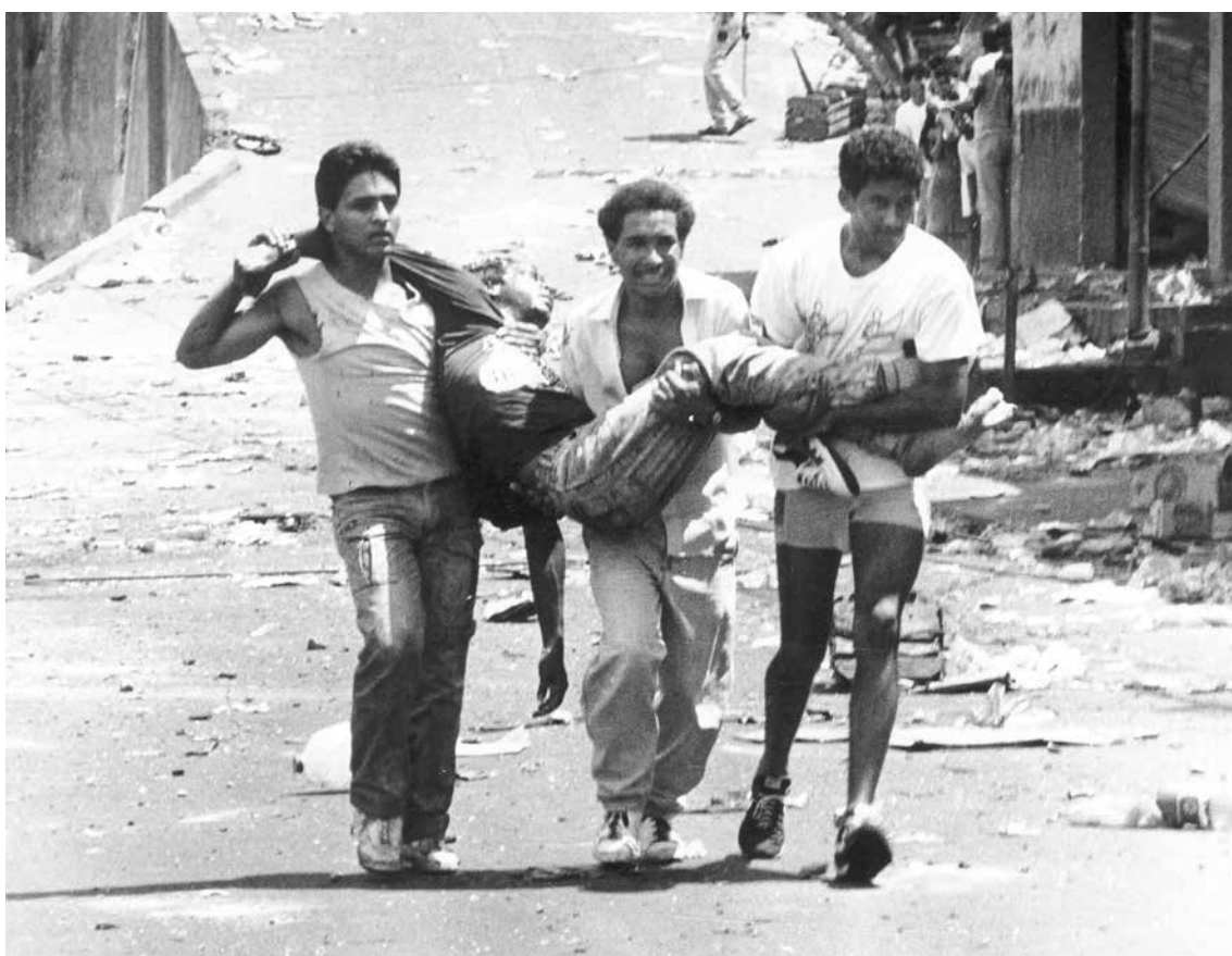
Escenas dantescas se vivieron esa semana.

El 27 de febrero de 2013, la Asamblea Nacional juramentó una comisión para investigar la actuación de policías y militares en 1989, que según cifras oficiales dejó 276 muertos, pero que algunos calculan que los desaparecidos pueden llegar a los dos mil. Ese mismo año la Fiscalía acusó a Virgilio Ávila Vivas (Gobernador del Distrito Capital en 1989) por su responsabilidad en la masacre. En noviembre de 2014 inició el juicio en su contra. •