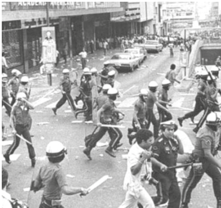
El Gobierno ordenó la represión indiscriminada.

Otro factor que desató la revuelta popular fue el acaparamiento y la especulación con los productos de primera necesidad, lo que causó desabastecimiento e inflación. Por ello, luego de la reacción inicial contra los transportistas, la acción se amplió hacia los supermercados y pequeños abastos, en cuyos depósitos los venezolanos encontraron muchos de los productos que se encontraban en escasez, como leche, azúcar, café, harina, aceite, sardinas, entre otros.