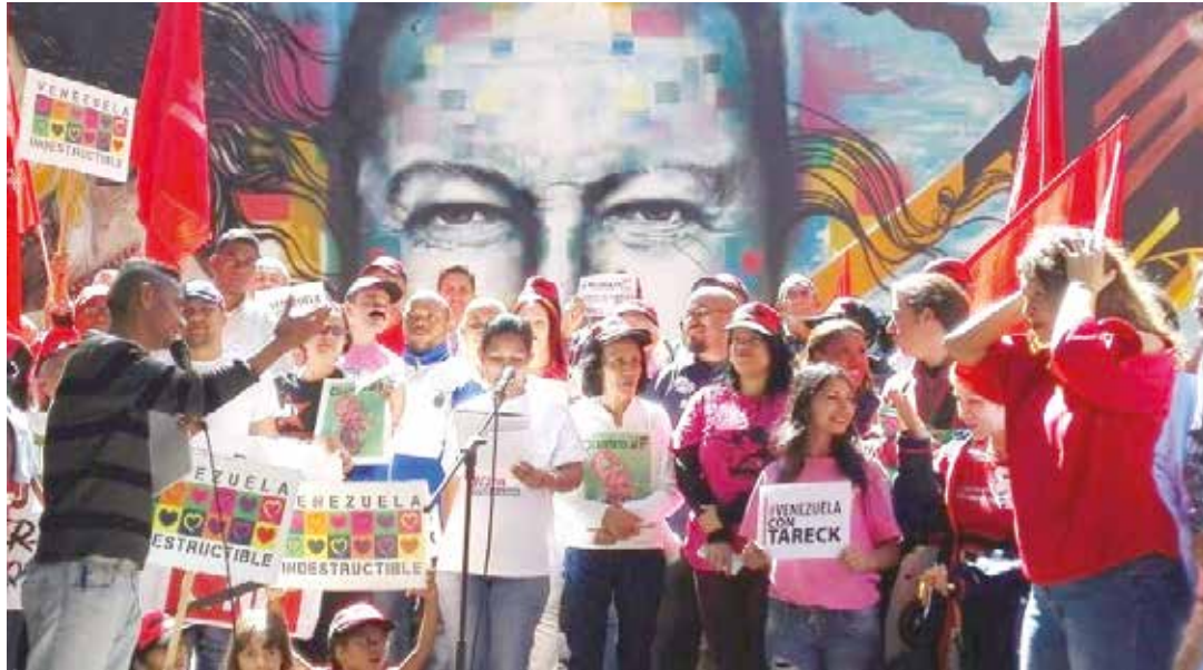
Enfrentan la mentira mediática.