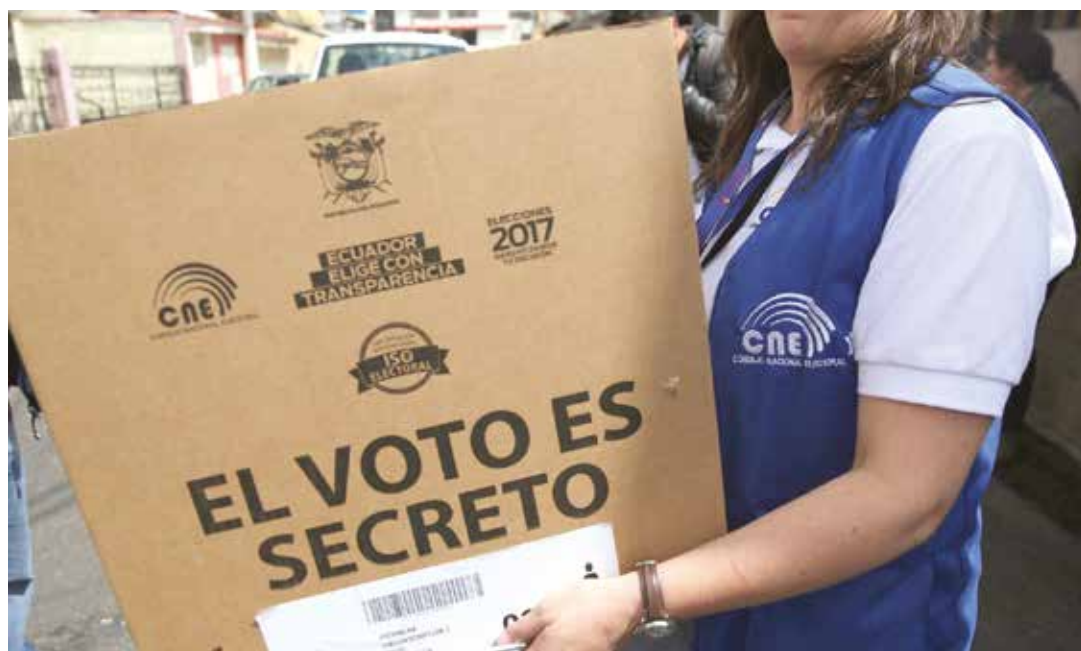
El país andino va la segunda vuelta.