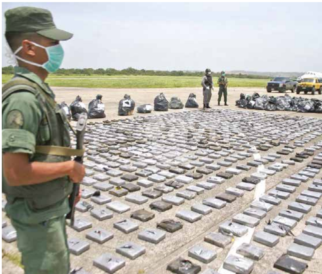
Los decomisos aumentaron luego de la salida de la DEA.

Pero al margen de las consideraciones políticas y geopolíticas, la decisión de la OFAC constituye una grave violación a mis derechos humanos, y lesiona gravemente mi dignidad y mi honor. He hecho mi vida personal, profesional y política en mi país, al que amo profundamente y al que dedico mi vida a través de un proyecto político que tiene como objetivos supremos la felicidad de nuestro pueblo, la igualdad y la justicia social. No poseo bienes ni cuentas en los Estados Unidos ni en ningún país del mundo, y resulta tan absurdo como patético que un organismo administrativo estadounidense -sin presentar pruebas- me dicte una medida de aseguramiento sobre bienes y activos que