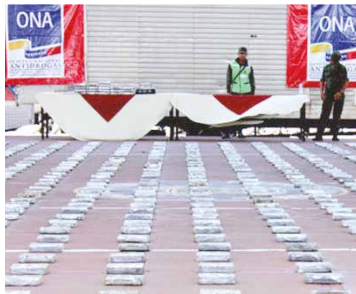
Venezuela es territorio libre de drogas.

Tareck El Aissami Vicepresidente Ejecutivo República Bolivariana de Venezuela