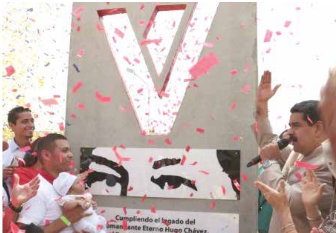
La vivienda se entregó en el estado Miranda.

El presidente Maduro -acompañado por la primera combatiente, Cilia Flores; el ministro del Poder Popular para Vivienda y Hábitat, Manuel Quevedo; y el poder popular- destacó que en esta gran jornada de entrega de viviendas, más de 10.190 familias venezolanas recibirán