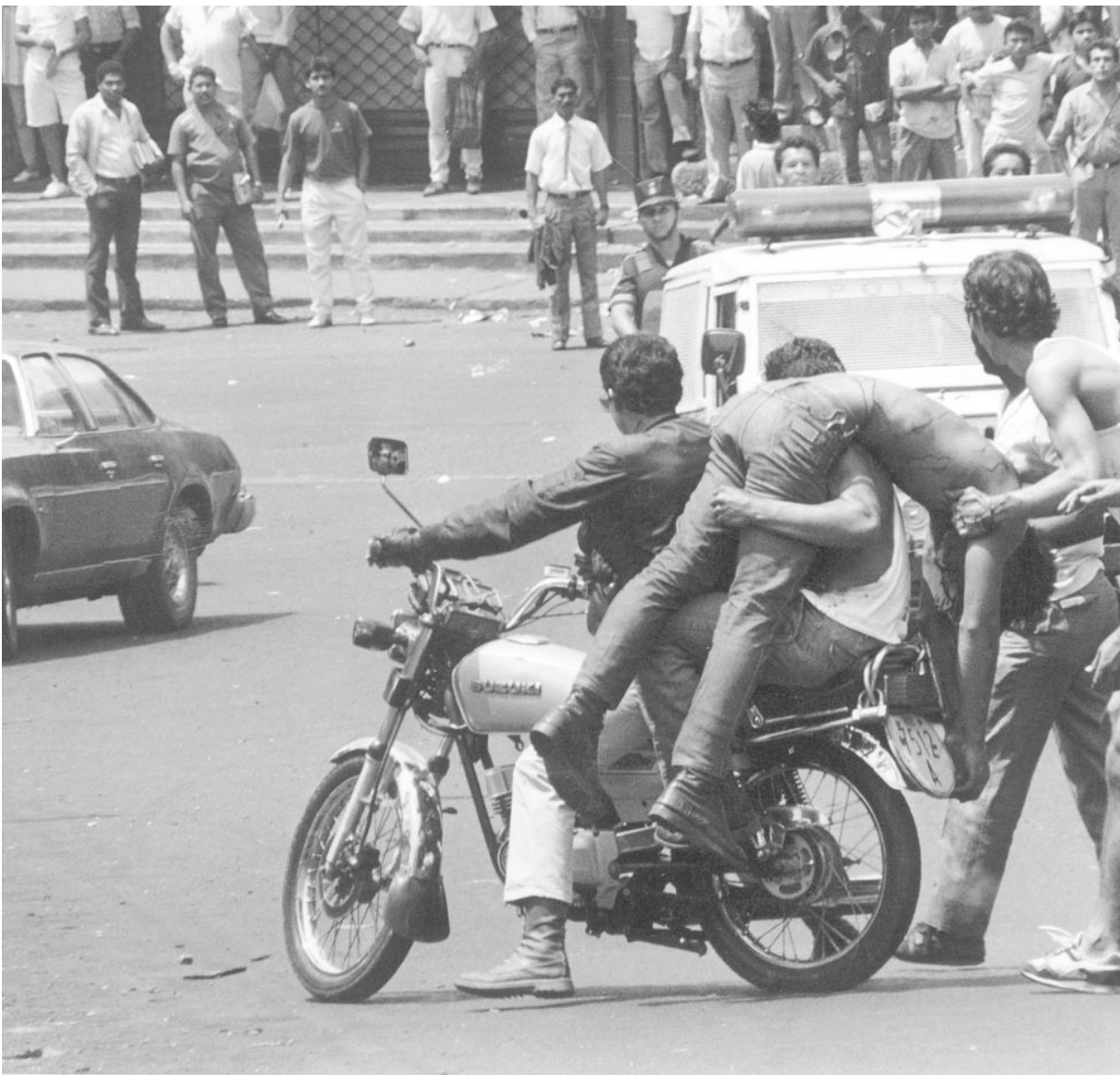
Cuando la muerte se regó por las calles.

Todavía no se conoce el número exacto de muertos, heridos y desaparecidos en 1989, debido al comportamiento del gobierno de esa época.