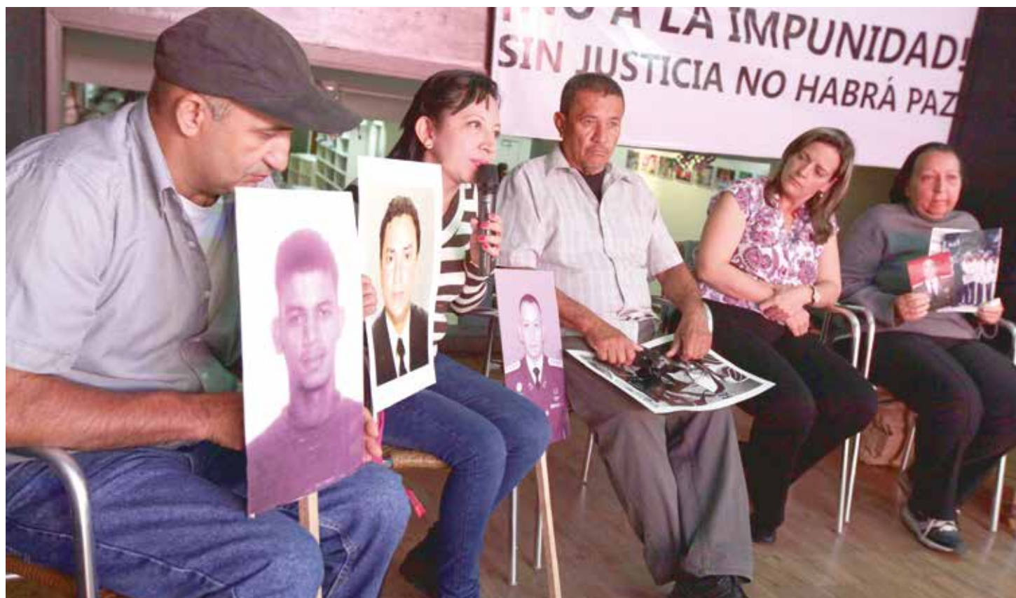
Los hechos violentos del 2014 no deben quedar impunesw.