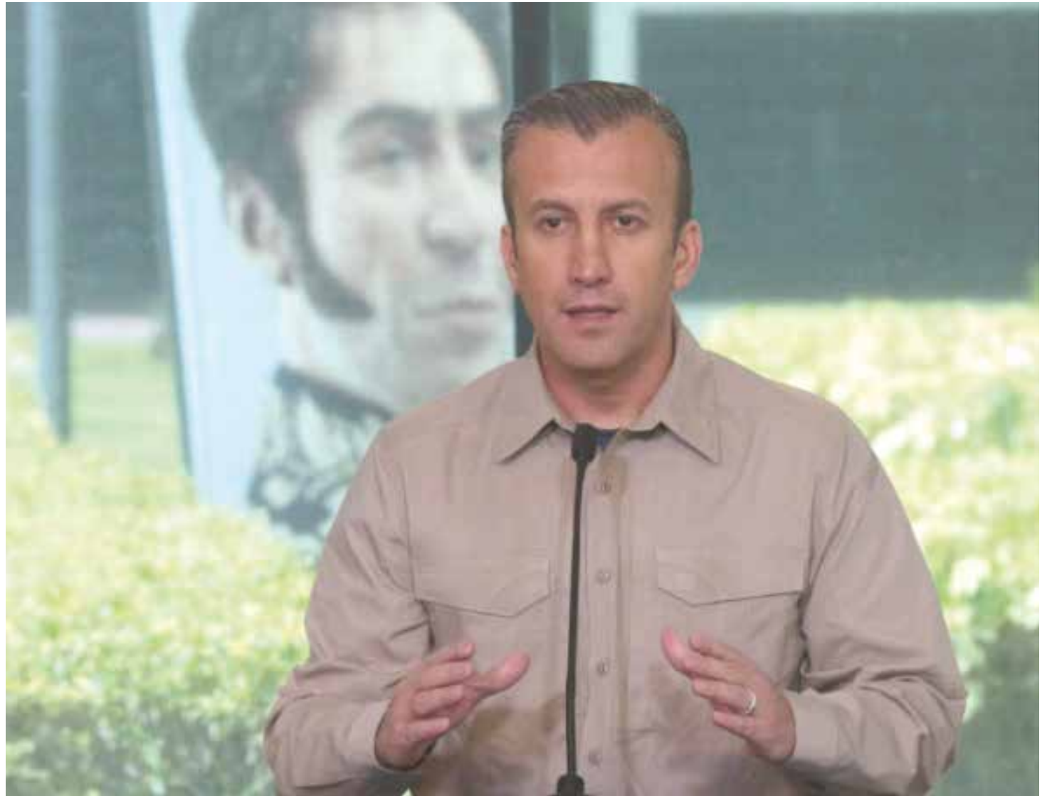
El Aissami: Libramos una lucha transparente contra el narcotráfico.