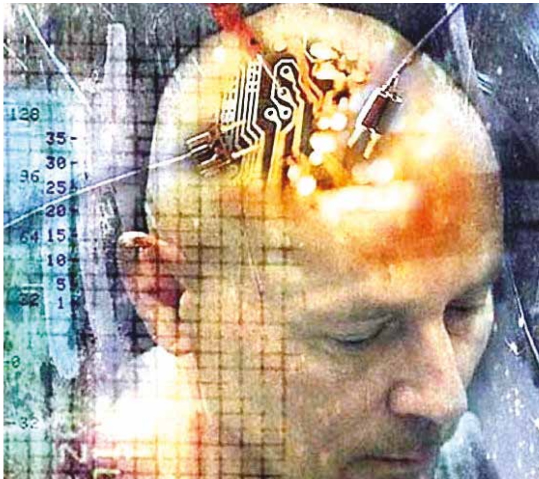
Las próximas guerras se librarán en la mente