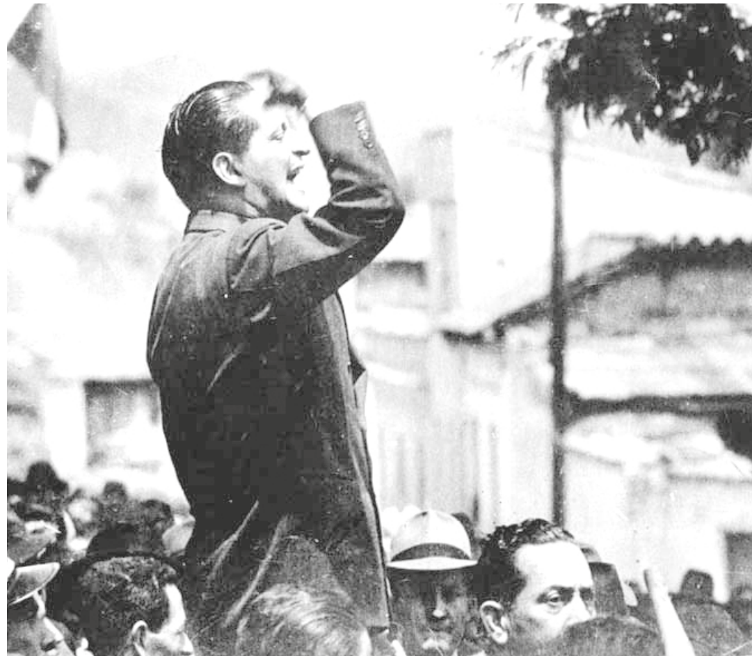
El asesinato de Jorge Eliécer Gaitán marcó la historia de Colombia.

La ingratitud es el crimen más grande que pueden los hombres atreverse a cometer