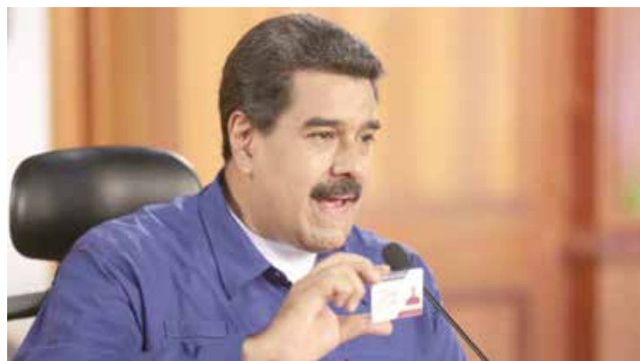
El presidente instó a inscribirse en el Carnet de la Patria.

El ministro de Vivienda, Manuel Quevedo, explicó desde el estado Bolívar que en todos los urbanismos de la Misión Vivienda se está llevando a cabo el proceso de inscripción al carnet de la patria. Por su parte el presidente Maduro señaló a pesar de las dificultades financieras del año pasado producto de la caída de los precios del petróleo se construyeron 360 mil viviendas y se espera llegar este año a la vivienda un millón quinientos mil. •