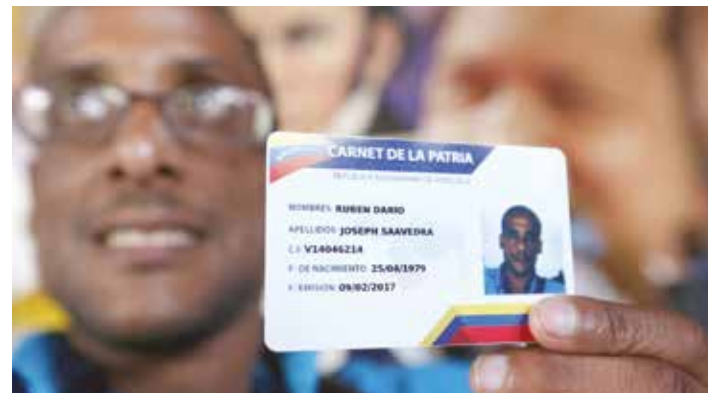
Se evitará la duplicidad de los receptores de las Misiones.

No es que una Misión sea más importante que otra. "Nada humano me es ajeno" debería ser un principio que predomine en el accionar de cualquier revolucionario, y aun cuando los perritos y perritas no son humanos, si vienen a ser parte de nuestras familias cuando los incorporamos al seno de nuestro hogar, por tal razón como un miembro más de nuestro entorno