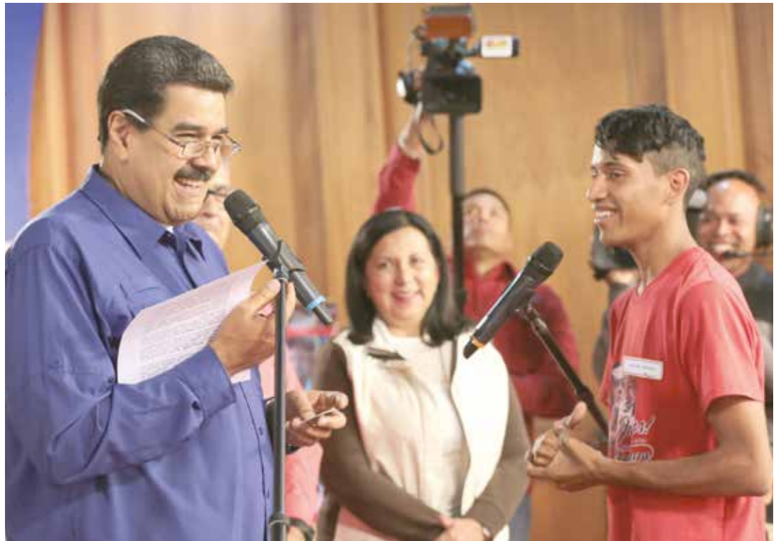
Se potencia el acceso a financiamiento para emprendimientos productivos.