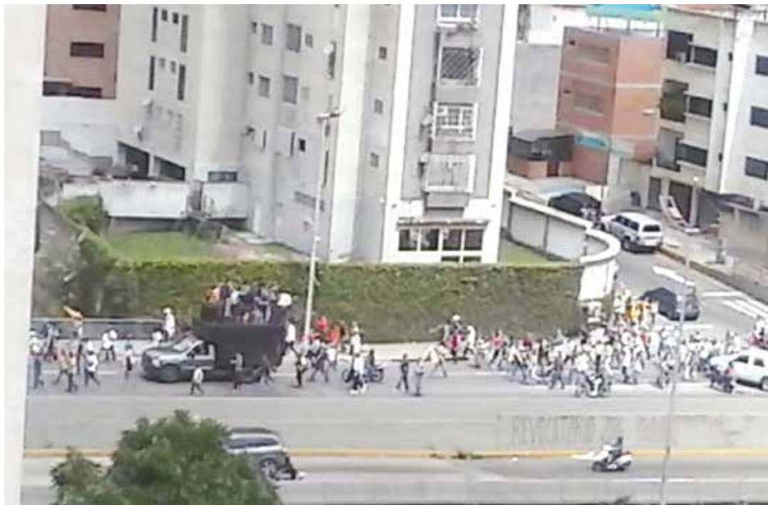
La poca participación de los militantes de la MUD en la marcha del 23 de Enero refleja que van de mal en peor.

Ante tal fracaso y decepción de la MUD, el periodista José Vicente Rangel propuso "estimular a los factores democráticos a organizarse y a actuar, lo que equivale a generar estabilidad, a garantizar que la gestión de gobierno cuente con celosos observadores, con críticos que impidan funestas desviaciones" señala en el artículo El tema de las responsabilidades. •