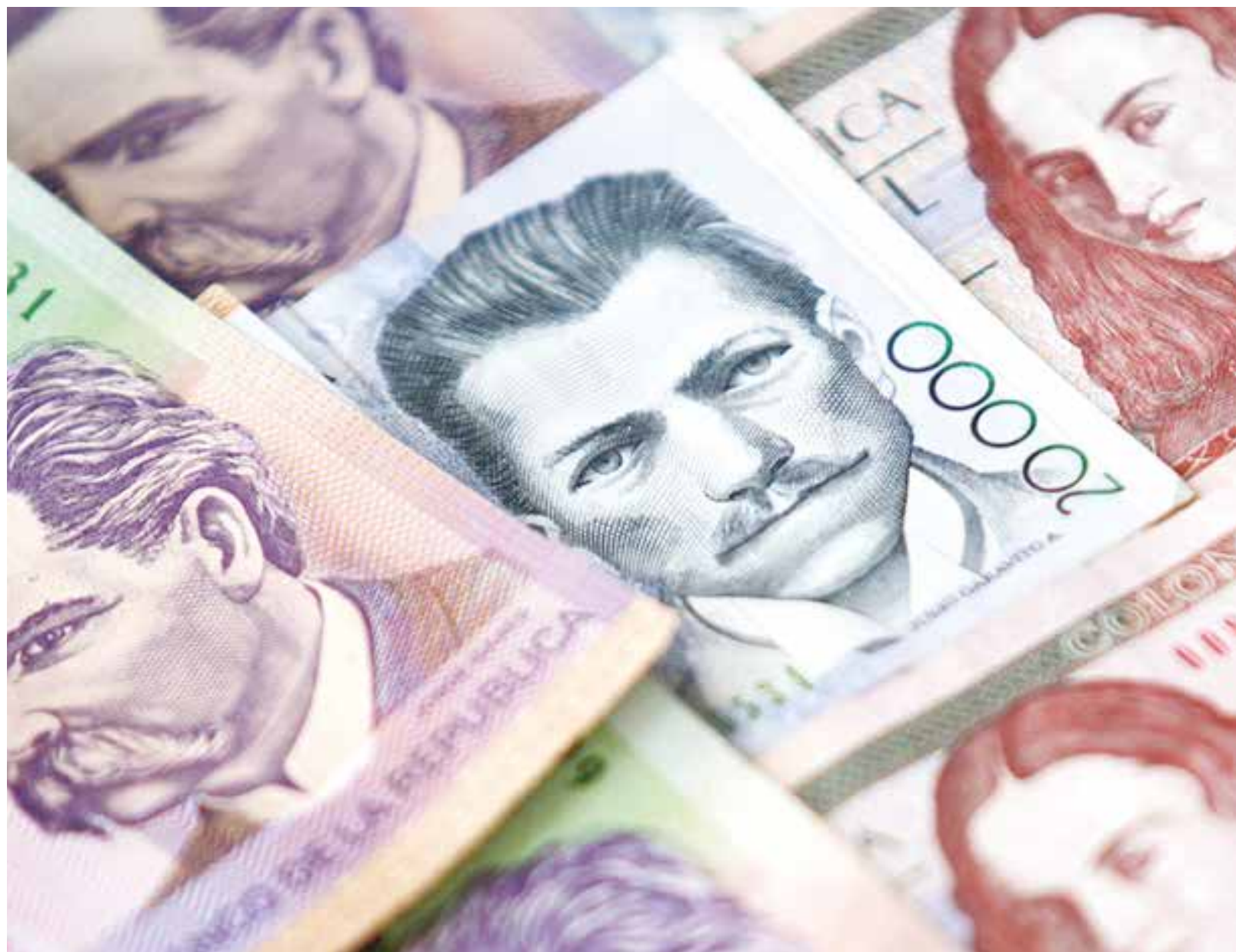
En la frontera con Colombia se libra una batalla por la estabilidad monetaria de Venezuela.

Este número está por encima del dólar flotante Dicom (Bs. 678 por dólar) que determina el Banco Central de Venezuela (BCV) y por debajo del referencial de Bs. 949 por dólar, que surge de la relación entre