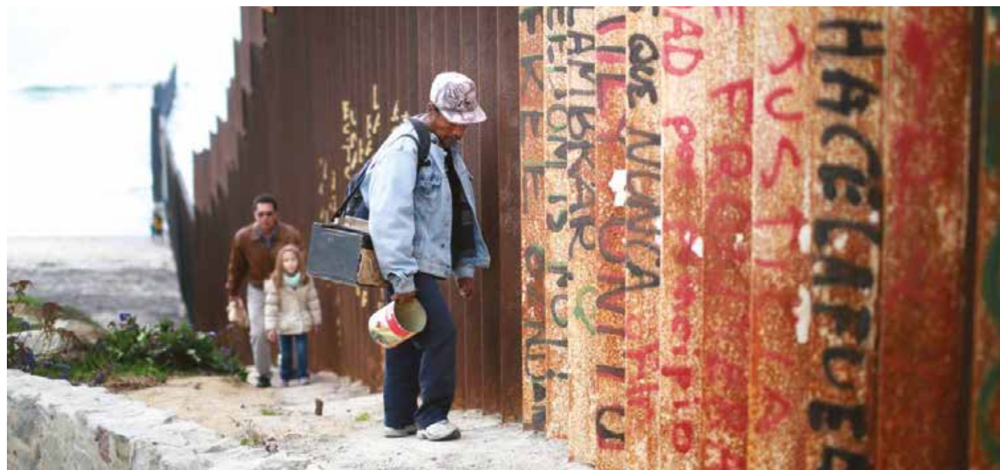
Ya existen muros en la frontera entre México y los Estados Unidos

Cálculos del costo del muro elaborados por expertos oscilan entre 14 mil y 20 mil millones de dólares