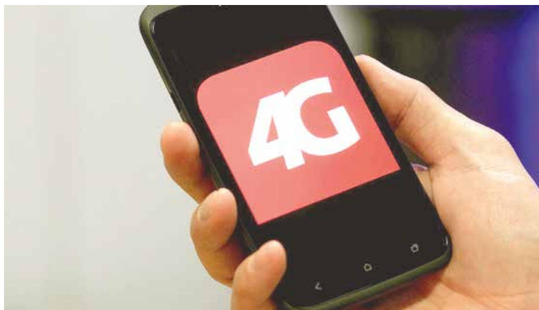
Esta tecnología en manos de la Revolución potenciará el e-gobierno.

El acceso a esta veloz autopista de la información