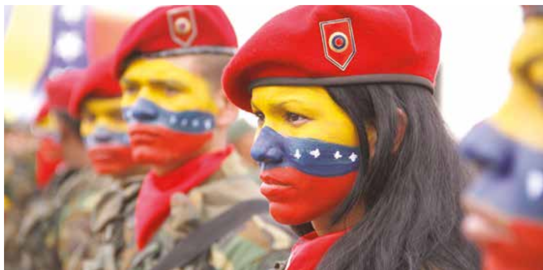
La FANB representa al pueblo uniformado

Incorpora a la Fuerza Armada Nacional Bolivariana y sus profesionales militares al desarrollo nacional, generando una nueva visión de desarrollo de país en el cual, lo militar que sirve para la guerra, debe servir también para el desarrollo de la nación y viceversa