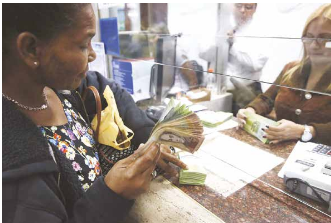
Las casas de cambio en la frontera con Colombia buscan enfrentar la cotización de Cúcuta.

Esto último sería una cuestión a considerar, tiene muchas derivadas, pero hay que analizarlo si entendemos la complejidad de estas situaciones económicas excepcionales. Eso quedará para otra nota, conforme a la evolución de estas cuestiones y a las señales que veamos por parte del chavismo y su directorio económico. •