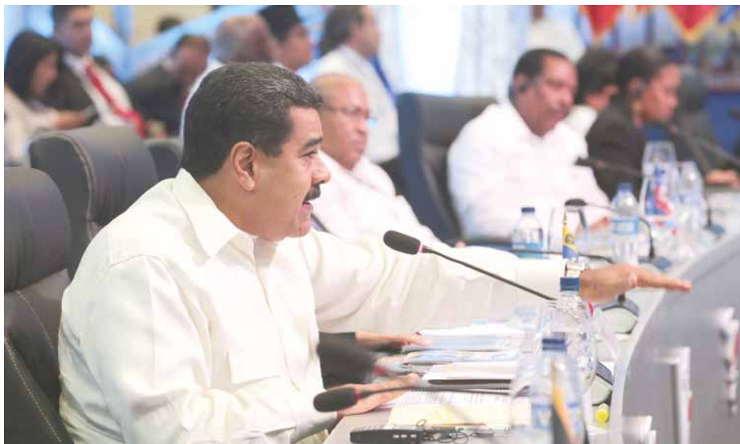
Celac reafirma solidaridad con Venezuela.

Exhorta además a los Gobiernos de Estados Unidos y Venezuela a iniciar un diálogo bajo los principios de respeto a la soberanía, la no injerencia en los asuntos internos de los Estados, la autodeterminación de los pueblos y el orden democrático e institucional