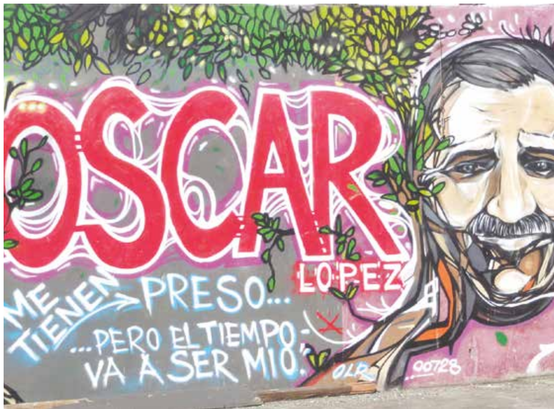
Se hizo justicia.

La férrea unidad del pueblo boricua, más allá de sus diferencias, ha podido arrancar de las cárceles yanquis a uno de sus mejores hijos