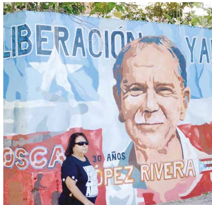
Puerto Rico celebra la liberación de Oscar López Rivera.

Oscar López Rivera se integra a la lucha clandestina en favor de la independencia de Puerto Rico en 1976 como miembro de las Fuerzas Armadas de Liberación Nacional (FALN). En 1981 fue capturado por el FBI y condenado a 55 años, a pesar de haber estado en Vietnam. Más tarde le extendieron la sentencia a 70 años por un supuesto "intento de fuga". 12 años los pasó en aislamiento total. Según el Protocolo I de la Convención de Ginebra de 1949 un prisionero de guerra, como es su caso, "no puede ser juzgado como un criminal común, mucho menos si la causa de tal procedimiento descansa en actos relacionados con su participación en una lucha anticolonial". Si algo le sobra a Oscar López Rivera es valor para seguir luchando por la independencia de Puerto Rico. •