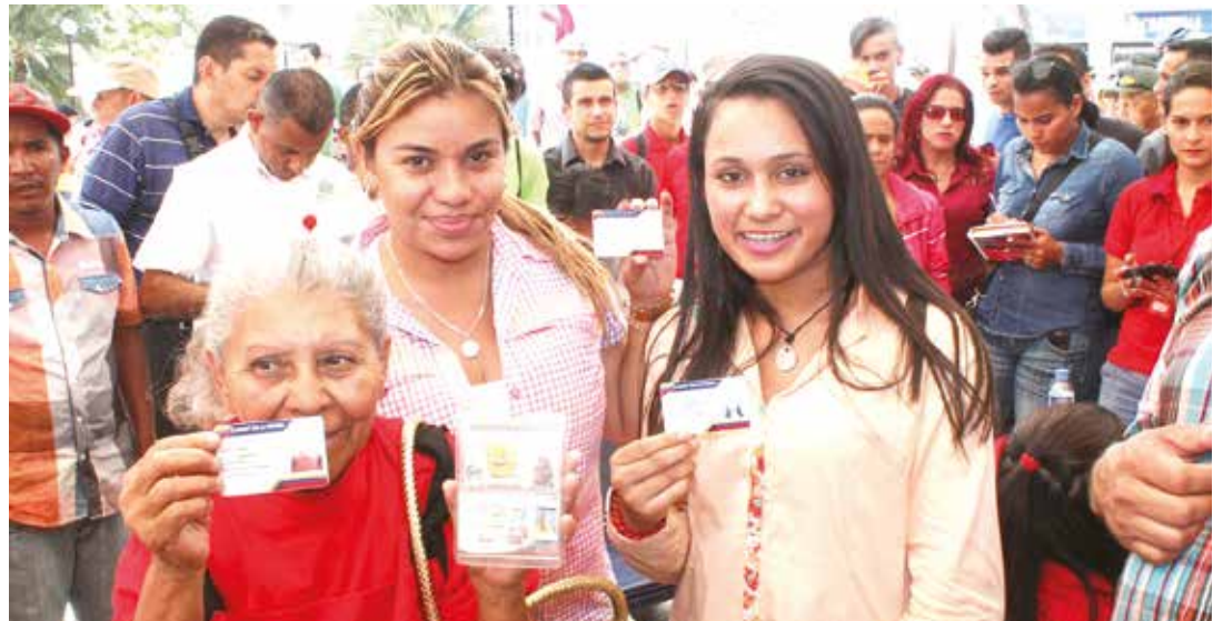
Los caraqueños mostraron orgullosos su Carnet de la Patria.