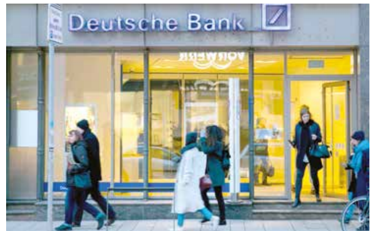
Son los bancos los mayores especuladores.

Considerando el pensamiento revolucionario de la ruptura y superación del