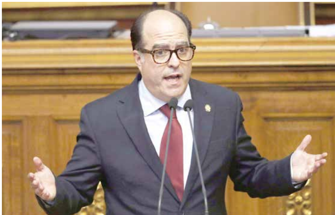
La Asamblea Nacional insiste en llamar al Golpe de Estado.

El TSJ señaló en un comunicado que la instalación de la AN y elección de una nueva Junta Directiva, efectuada el 5 de enero de 2017, no tiene validez porque continúan el desacato a varias sentencias emanada del Poder Judicial