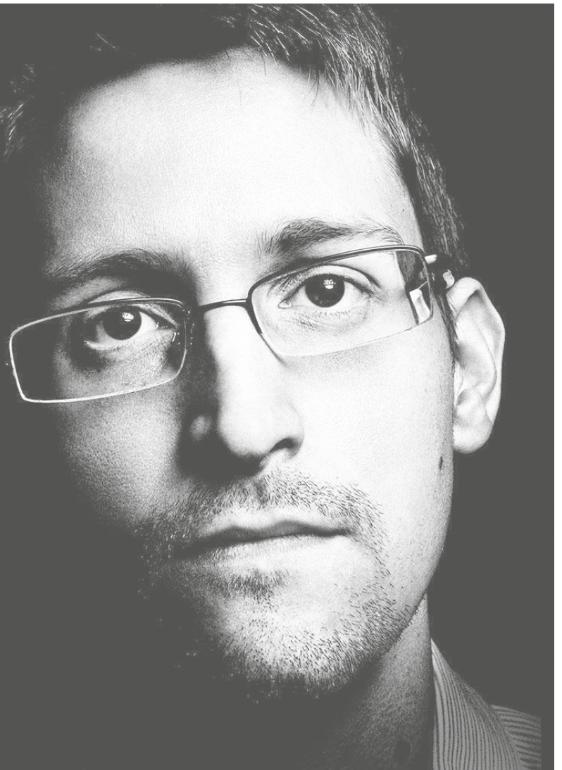
Edward Snowden develó la vigilancia masiva que ejercen los organismos de inteligencia de Estados Unidos.

Los servicios de inteligencia actuaron criminalmente basados en las premisas del Gran Hermano de George Orwell, "juntarlo todo" y "saberlo todo"