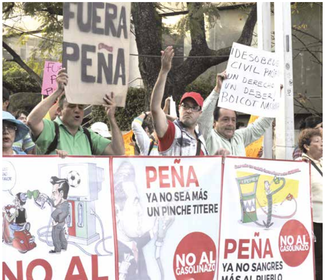
La protesta por el gasolinazo es un hecho inédito.

No, porque, a pesar de todo, lejos de disminuir, el descontento social sigue extendiéndose y no tiene visos de debilitarse en el corto plazo. La relación entre el número de protestas y el de saqueos es, según un recuento de notas periodísticas, al menos de cinco a uno. Y no, porque, la