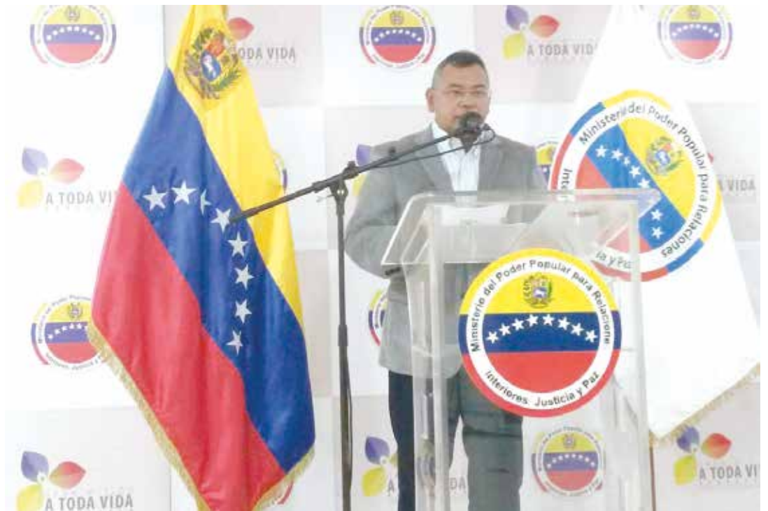
El ministro develó el plan golpista.

"El Comando Nacional Antigolpe en el inicio de 2017, recibió información de diferentes fuentes sobre la intención de generar una acción de