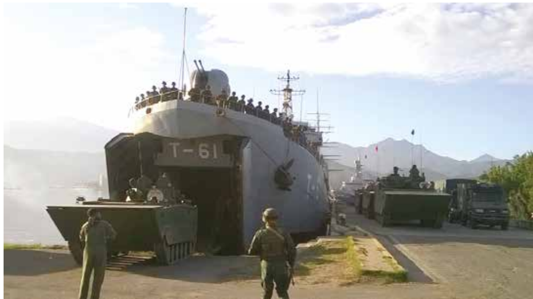
Los ejercicios se realizaron en todo el país.