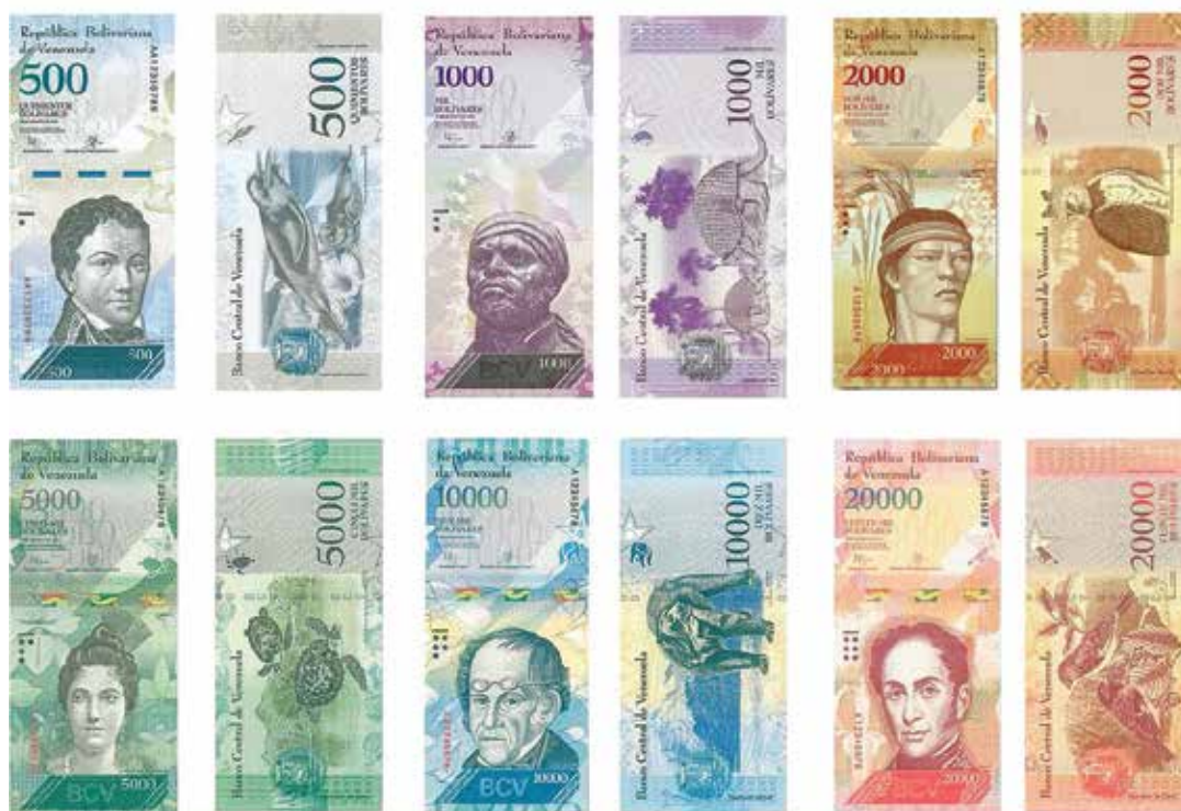
El nuevo cono monetario entrará en circulación de forma progresiva.

Las nuevas denominaciones tendrán elementos sensibles al tacto y marcas para personas con discapacidad visual, marcas visibles bajo luz ultravioleta, microimpresiones y otros elementos de seguridad.