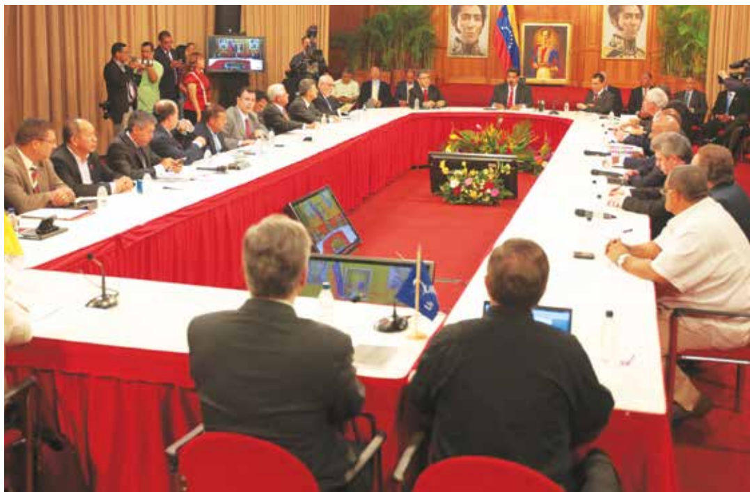
La oposición se volvió a parar de la Mesa de Diálogo.

“...De allí que consideramos que se debe iniciar una etapa que nos lleve hacia la reactivación, consolidación y sostenibilidad del diálogo nacional, para lo cual hemos presentado