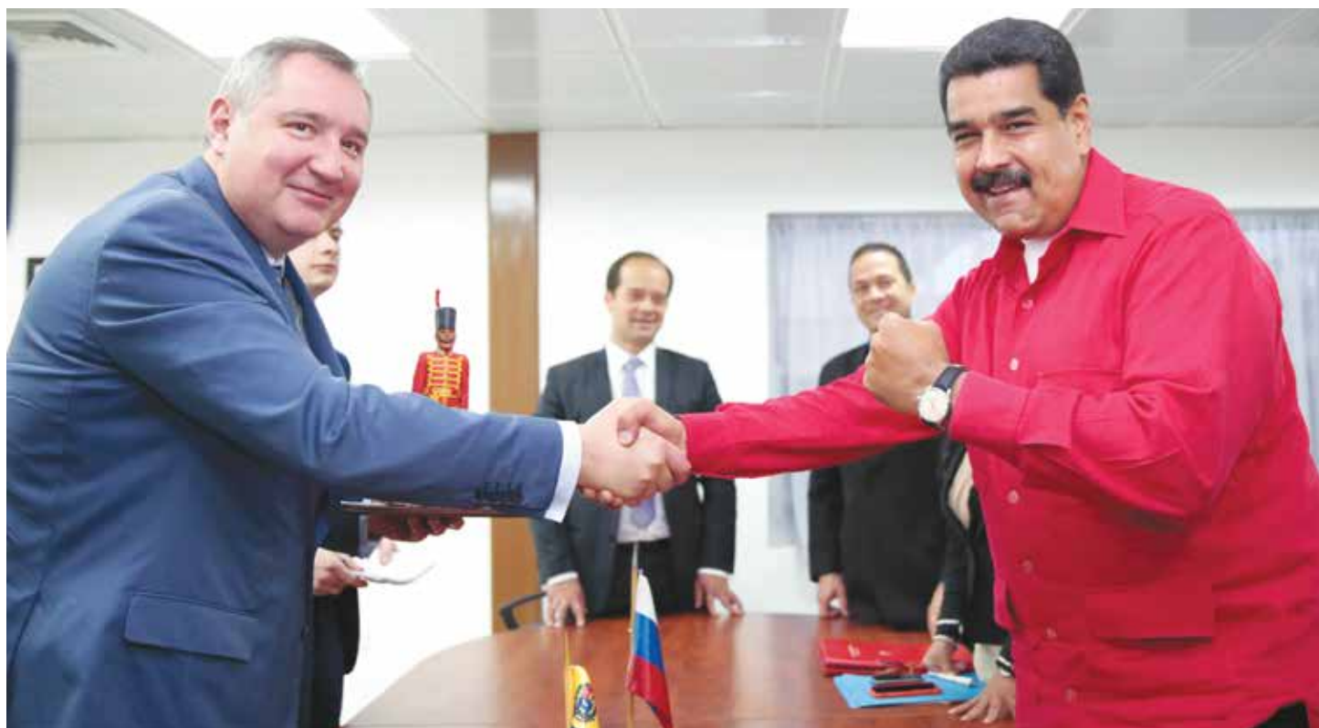
Venezuela ha fortalecido su alianza con Rusia.

"En seis meses volvemos al punto de equilibrio en los inventarios y eso tiene una relación directa con los precios, eso va a llevar los precios de los 60 a 70 dólares, que debe ser un precio de equilibrio en este momento"