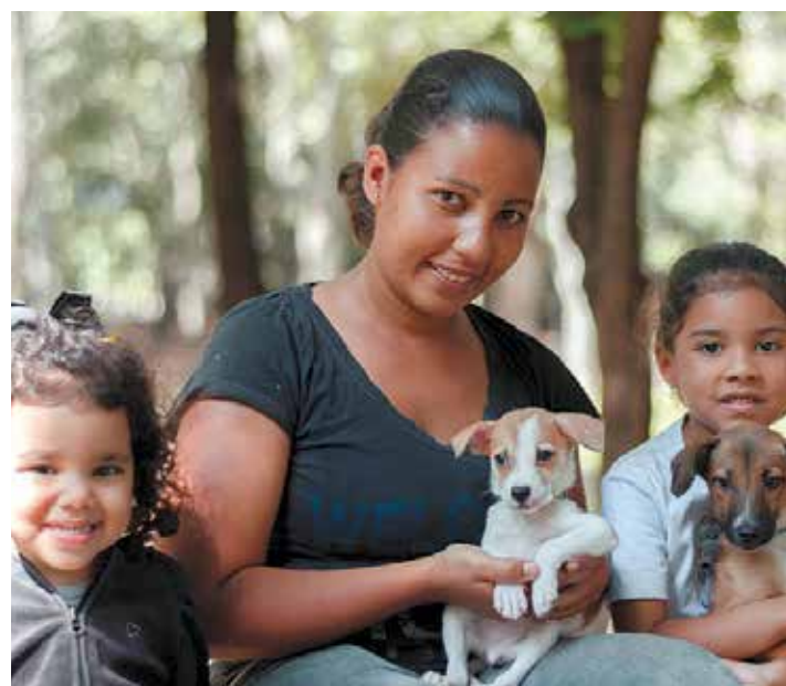
Ellos no merecen ser abandonados.

Vale preguntar: si a algunas de estas personas que optan por "dormir" o sacrificar a sus animales, en una situación de