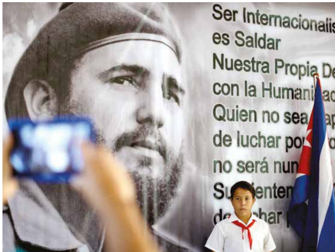
Fidel dejó su pasó indestructible por la historia.

Nuestro querido Comandante en jefe ya no estará para alumbrar nuevos amañados, pero sus ideas, que nadie tenga duda, perman-