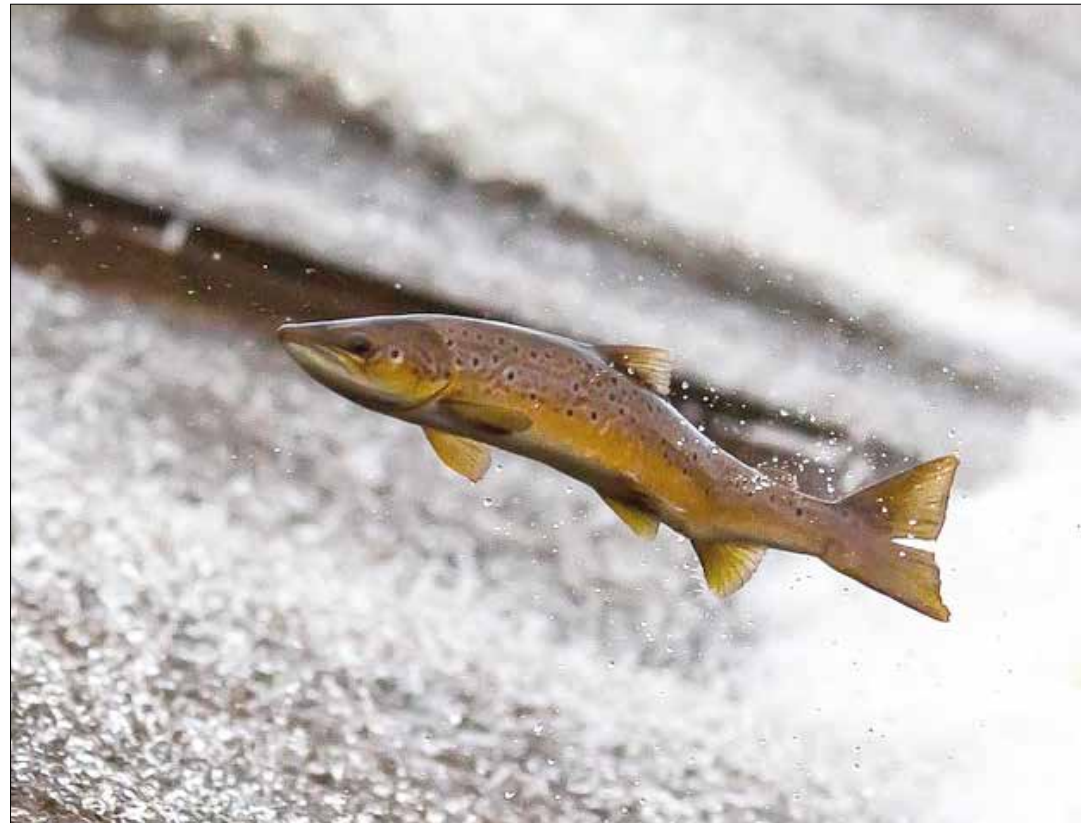
El panorama cambió para la MUD

Lo antes dicho quizá lo explica parcialmente el opositor Luis Vicente León, uno de los defensores de la decisión de la MUD de sentarse en la mesa diálogo, aunque lo hace de manera crítica. León se interroga en torno a las posiciones más radicales de la derecha, que están atacando el diálogo y a los “moderados” de la MUD de manera cada vez más abierta: “... resulta que la alternativa planteada por quienes más duro atacan podría ser peor ¿Ir a Miraflores y sacar a Maduro? ¿Con qué? ¿Cómo pasar las barricadas que te van a poner tan pronto lo anuncies? ¿Cuántas armas tienes? ¿Cuánta gente realmente saldría, no para una marcha pacífica sino para batirse a tiros contra un poder que se defenderá? Y en caso de llegar hasta Miraflores, ¿quién hará el trabajo de sacar a Nicolás Maduro? ¿Quién hará aquello que alguna vez hicieron algunos militares contra Hugo Chávez y que