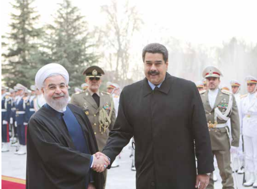
Venezuela jugó un papel crucial en el acuerdo para recortar la producción.

El presidente de Venezuela, Nicolás Maduro denunció desde el año pasado el absurdo de que los productores hagan todo el esfuerzo para extraer y procesar el crudo mientras un grupo de especuladores fijen su precio y por eso emprendió una campaña mundial de diplomacia petrolera con naciones pertenecientes a la OPEP y otros grandes productores como Rusia destinada a lograr un acuerdo de reducción que se concretó el pasado 30 de noviembre.