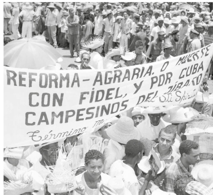
La reforma agraria en Cuba fue obra de la Revolución.

De la mano del mismo Fidel, en la Venezuela Bolivariana conocimos una gran variedad de alternativas tecnológicas que hoy estamos desarrollando, el uso de plantas alternativas a las conocidas y dominadas por las multinacionales, como fuente de proteína y energía para la alimentación humana y animal.