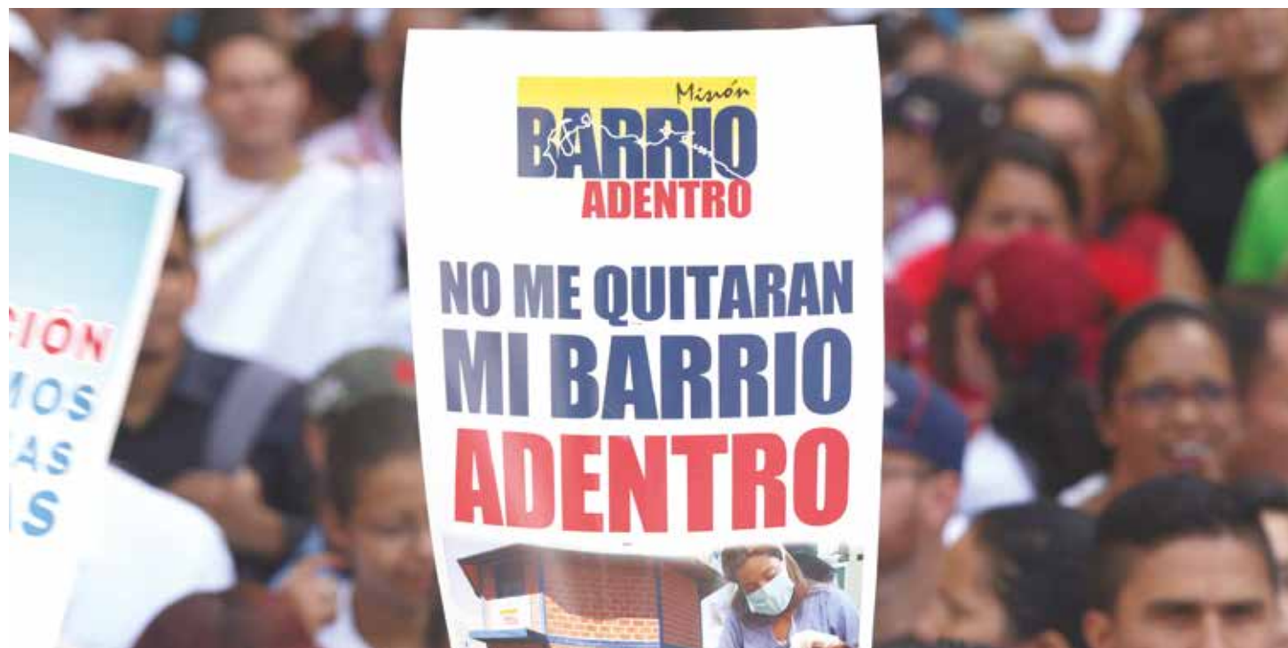
Ambos presidentes alcanzaron una amistad plena y hermandad hasta la desaparición física de los dos.

Ambos dirigentes permitieron cambiar la región, además ayudó a mejorar las condiciones de vida de los venezolanos y cubanos con la firma de convenios bilaterales.