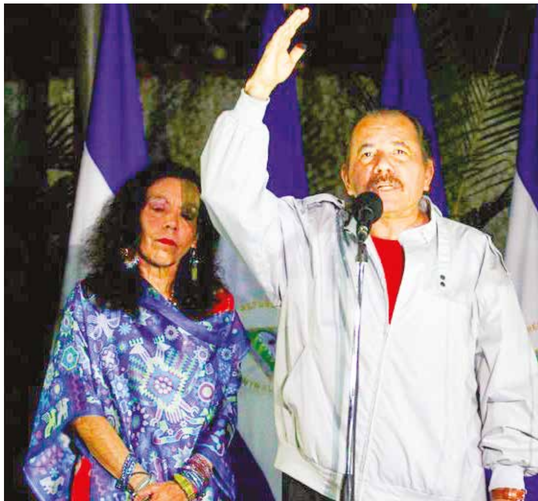
Daniel Ortega junto a su compañera se dirige a su pueblo luego de su tercer triunfo electoral.