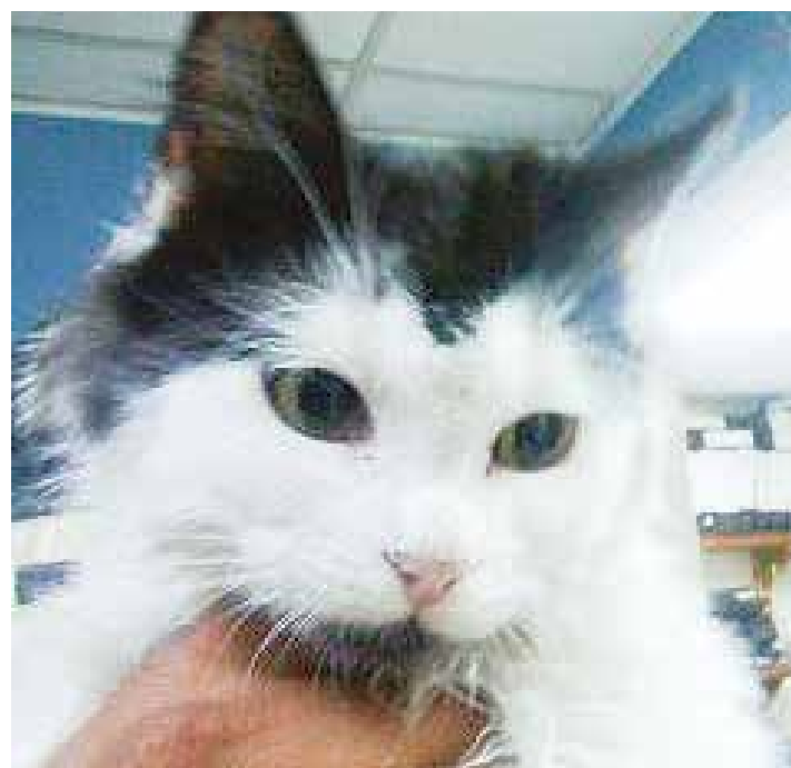
La Revolución respeta a nuestros compañeros de planeta.

brindó cariño y asistencia médica. Hoy son dos seres inseparables. Pero ¿qué hubiera pasado si Clapton no hubiese encontrado un alma bondadosa que se hiciera cargo de él? Tal vez estuviera, al igual que muchos de sus hermanos de raza, deambulando por los tejados o por las calles o quizás peor, podría estar muerto. De allí la importancia de asumir conciencia de que cuando adoptamos a un animal es para atenderlo en las buenas y en las malas. Igual que cuando nos casamos o cuando tenemos un hijo o una hija. Si usted es de las personas que le gusta tener un animal