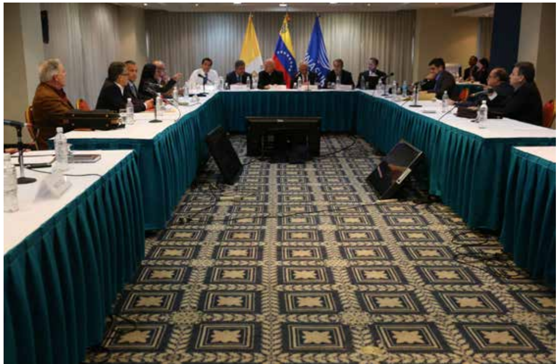
En la Mesa de Diálogo Triunfó el país.

a las acciones que han desencadenado asesinatos, sabotaje terrorista, guerra psicológica, cartelización de medios de comunicación nacionales e internacionales para imponer su matriz destructiva", señala el escrito.