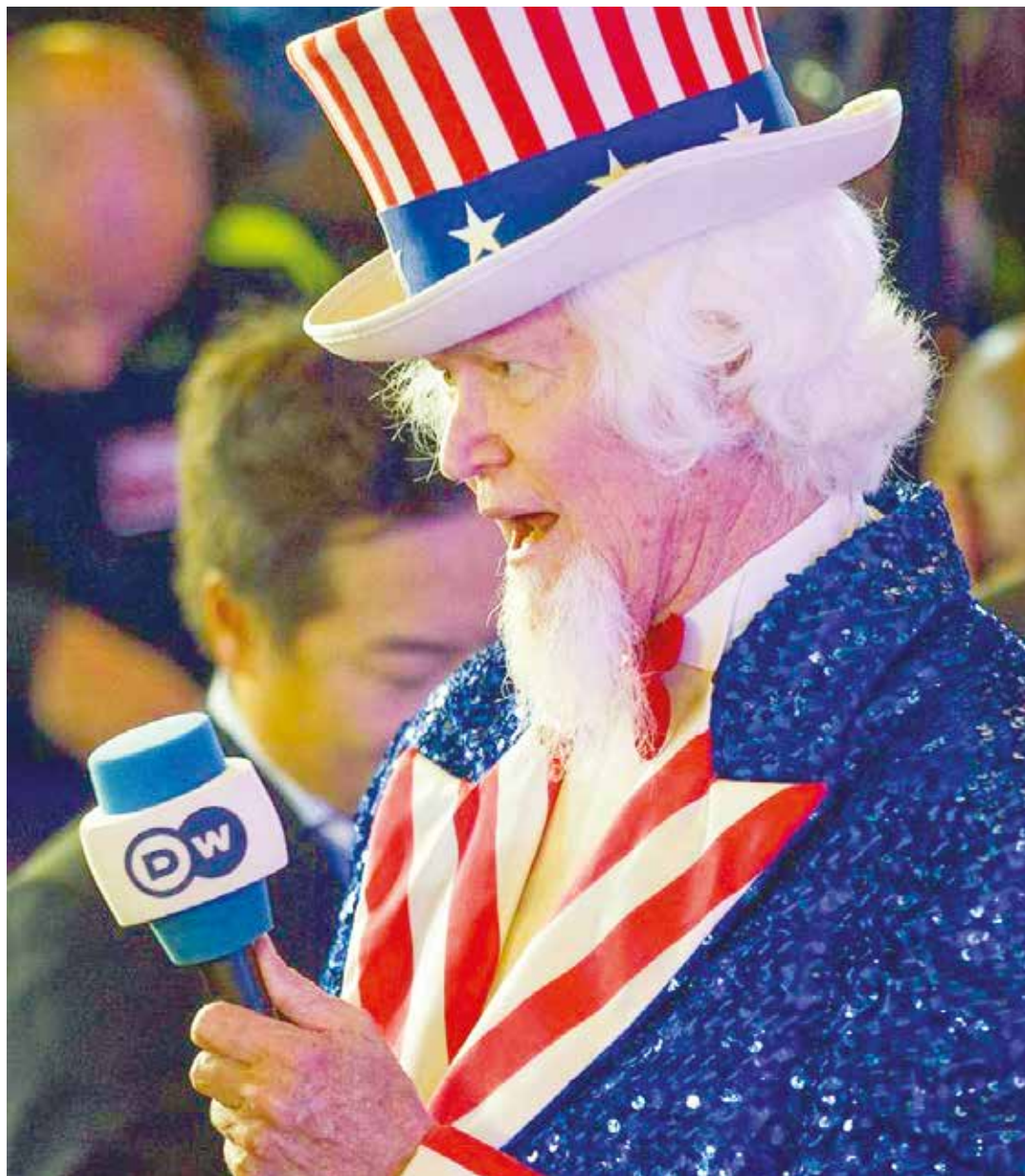
Los grandes medios apostaron a perdedor.

“¿Qué significa Donald Trump? Bueno ahí están unos estudios que se han hecho, yo he estado leyendo todos los estudios en los Estados Unidos, donde universidades prestigiosas dicen que Donald Trump pudiera ganar con el sistema electoral que hay en Estados Unidos, y ustedes ¿saben por qué? Porque Donald Trump está canalizando una fuerza de cambio que está en la sociedad norteamericana oculta”. •