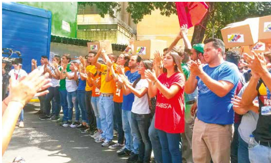
Las concentraciones opositoras son cada vez más minúsculas.

"La tregua que nosotros acordamos, a pedido del Va-