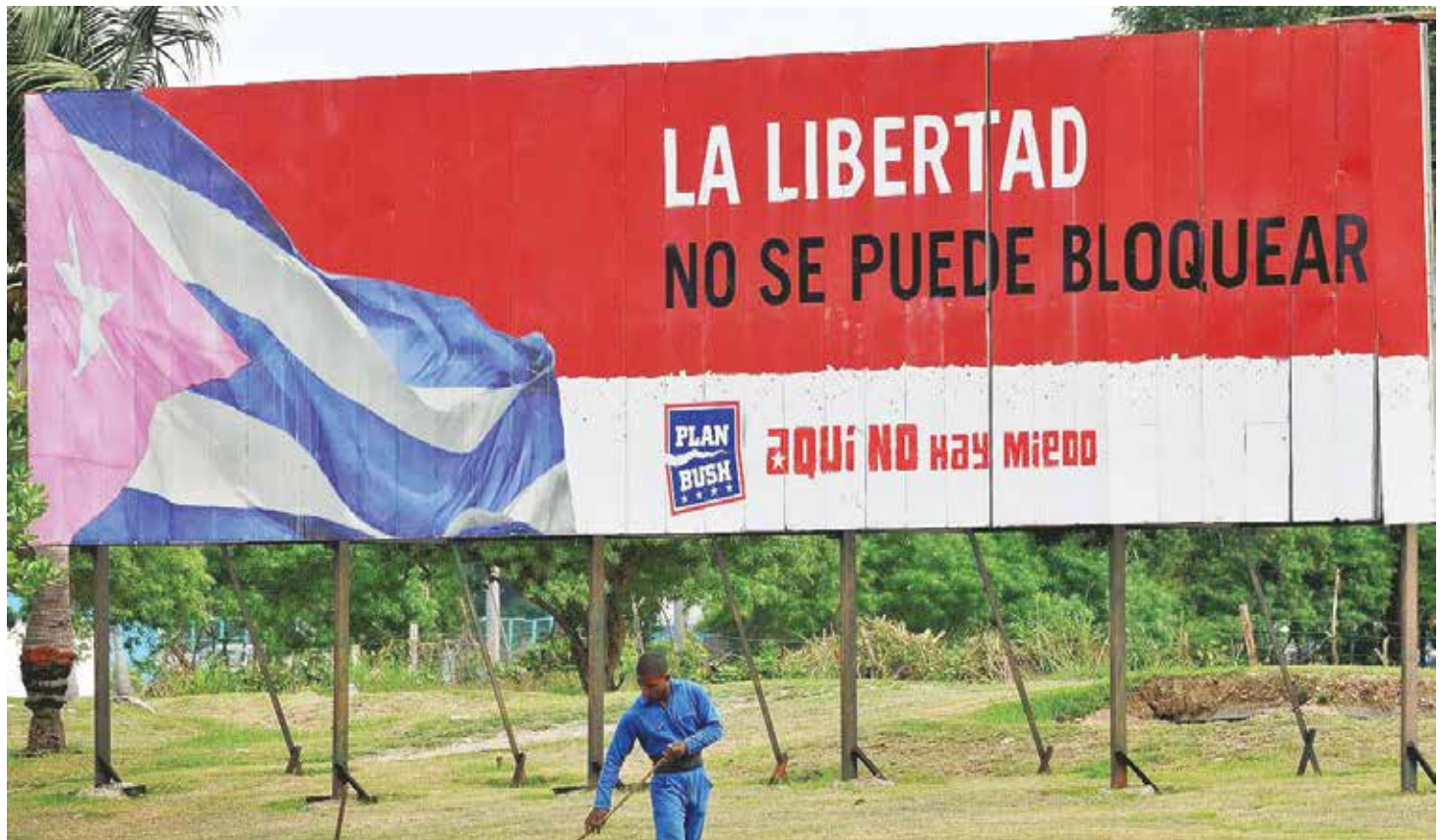
El férreo cerco se mantiene.

Resaltó que aunque el presidente Obama tiene amplias facultades ejecutivas para modificar las regulaciones del bloqueo, solo se han aplicado algunas medidas positivas,