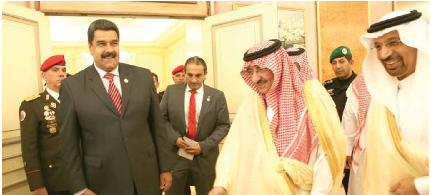
Presidente Maduro en defensa de los precios del petróleo.

“No gana nadie con los actuales precios del crudo, porque son millonarias las inversiones que se están dejando de hacer y bajo el actual modelo podría ocurrir un repunte extremo al cabo de pocos años por la caída de la producción que se generaría”, explicó al tiempo que fijó dos momentos para alcanzar la estabilidad deseada: el primero en los próximos seis meses en donde se espera lograr un equilibrio en las cotizaciones (que muchos analistas del sector sitúan entre 50 y 60 dólares el barril) y luego la creación de un mercado estable de cara a los siguientes diez años, en donde se pueda contar con precios estables que favorecen tanto a los consumidores como a las naciones productoras. “Estamos trabajando en una fórmula nueva para la estabilidad de los precios para los próximos 10 años. Hay que pasar de la ruta de los seis meses de estabilización, la cual estamos