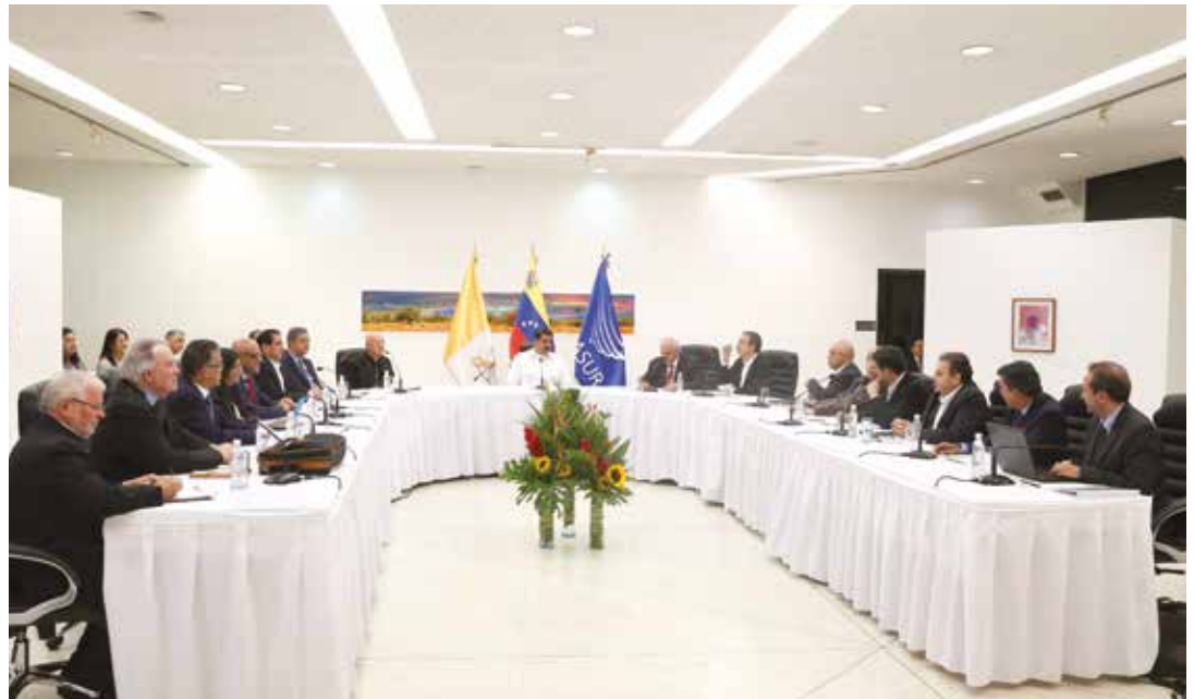
83% de los venezolanos apoyan el diálogo.

que 61% de los ciudadanos cree que una de las prioridades del eventual diálogo sea resolver los problemas económicos del país; 33% consideró que se debe convocar el referendo revocatorio y apenas 4% apoyó que debe aprobarse la Ley de Amnistía.