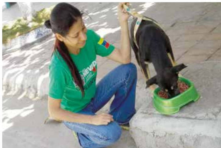
El proteccionismo está cobrando seguidores.

¿Y cómo relacionamos este bienestar animal con nuestra Revolución Bolivariana? El 4 de enero de 2010 se promulgó la ley para la Protección de Fauna Doméstica, Libre y en