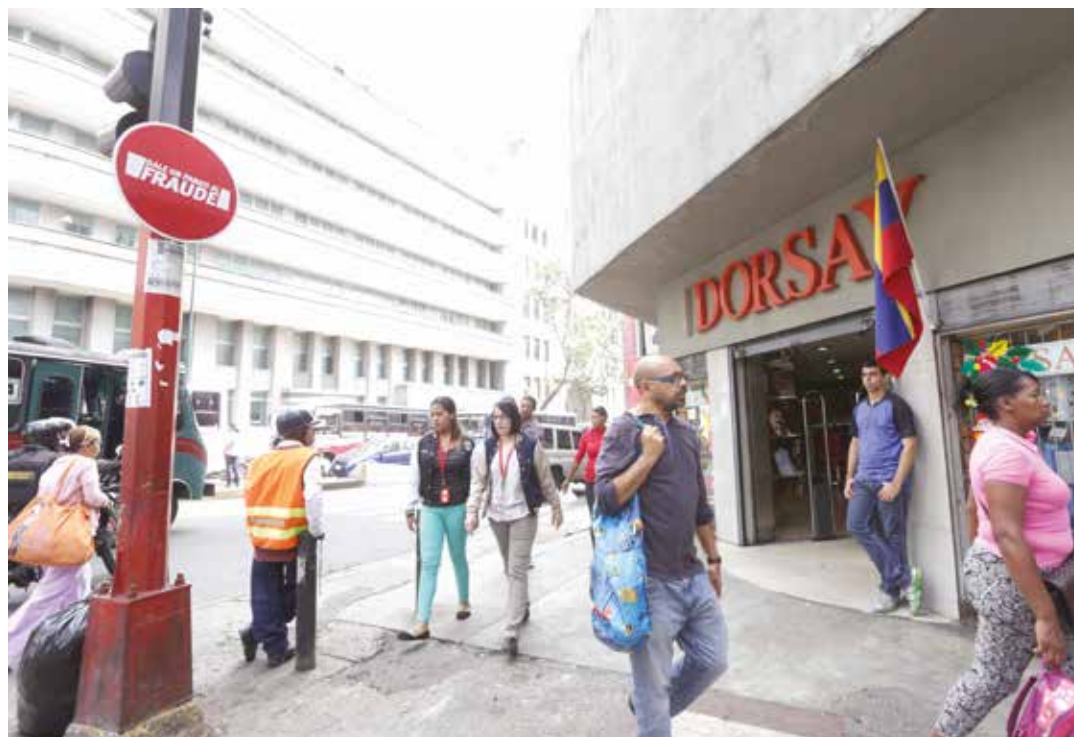
La normalidad se vivenció en las calle del país.

A pesar de que la oposición calificó el Paro como un "éxito" en Caracas, las panaderías, farmacias, supermercados estaban abiertos y en el resto del país, el paro se cumplía a medias. "La dirigencia opositora lo único que busca es la ruina del país. No piensan en su gente que debe trabajar para llevarse un pan a la boca", expresó Miguel Acevedo al