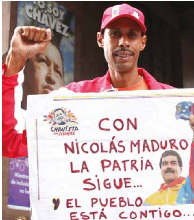
El pueblo movilizado en defensa de la Revolución.