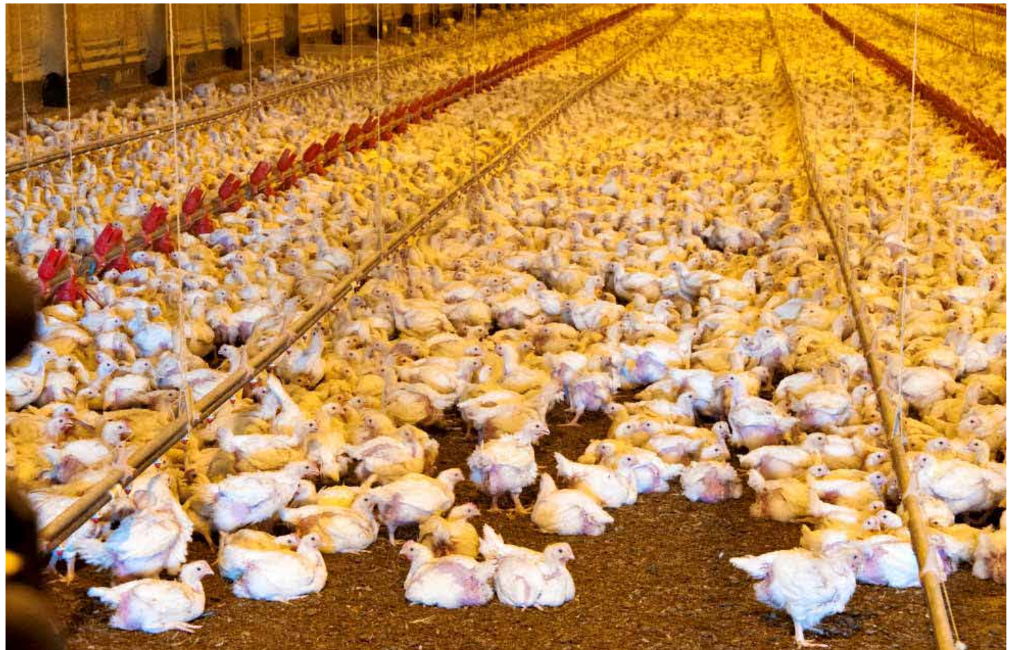
Existe una especulación voraz en los alimentos para animales.

Nadie dice que la misión sugerida sea fácil, pero pueden contar con muchas y muchos ciudadanos