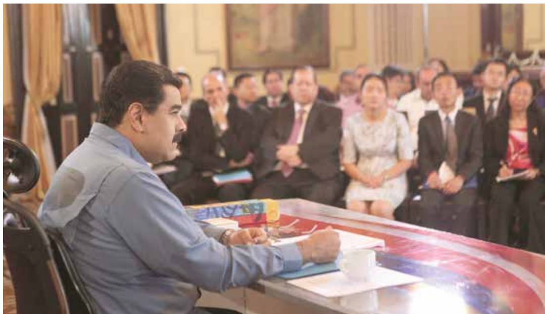
El Presidente indicó que seguirá protegiendo al pueblo.

“La primera línea es proteger socialmente al pueblo de la embestida imperialista; la segunda, apoyar a la Gmass para la revolución productiva, para derrotar la guerra económica y no convencional, y la tercera, el pueblo en la calle, organizado”