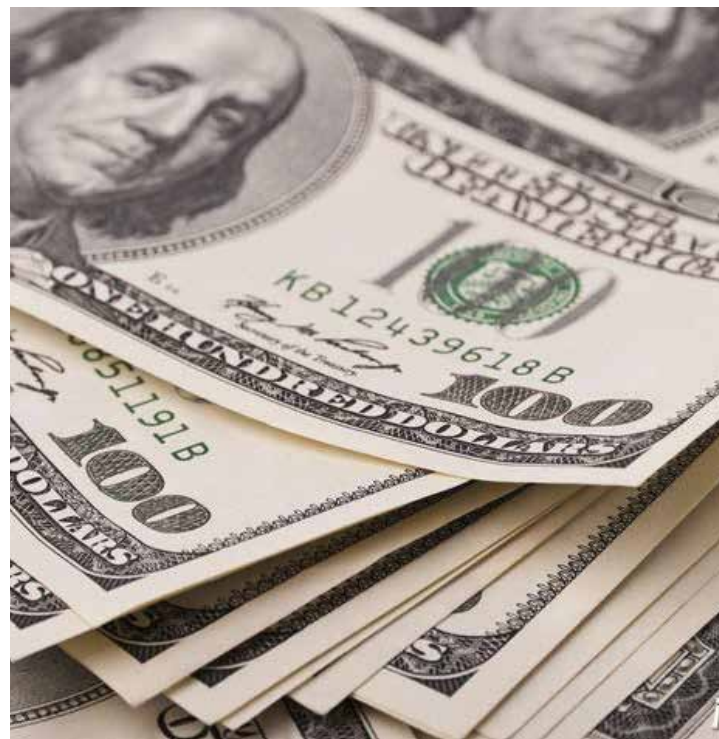
Prometieron dolarizar el salario y ahora no quieren el aumento de sueldo.

cuando se aumenta el salario es el primero en aseverar que eso no sirve. La demagogia se paga a tasa Dolar Today, dígalos ahí Guanipa.