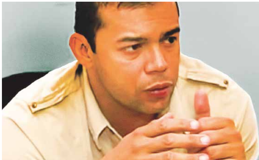
La investigación policial avanza.