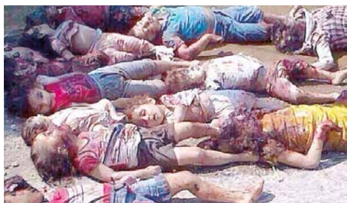
Apuntan a los niños.

carnicero Netanyahu, produce de esta forma un nueva vuelta de tuerca que haría empalidecer al propio Herodes. Apuntan a quienes más temen: la niñez palestina, esos chicos y chicas que por la imposición de la ocupación han reemplazado los juegos y diversiones que son habituales en sus coleguitas del mundo y corren por las calles esgrimiendo el arma más temida: con sus pequeños dedos hacen la V de la victoria. •