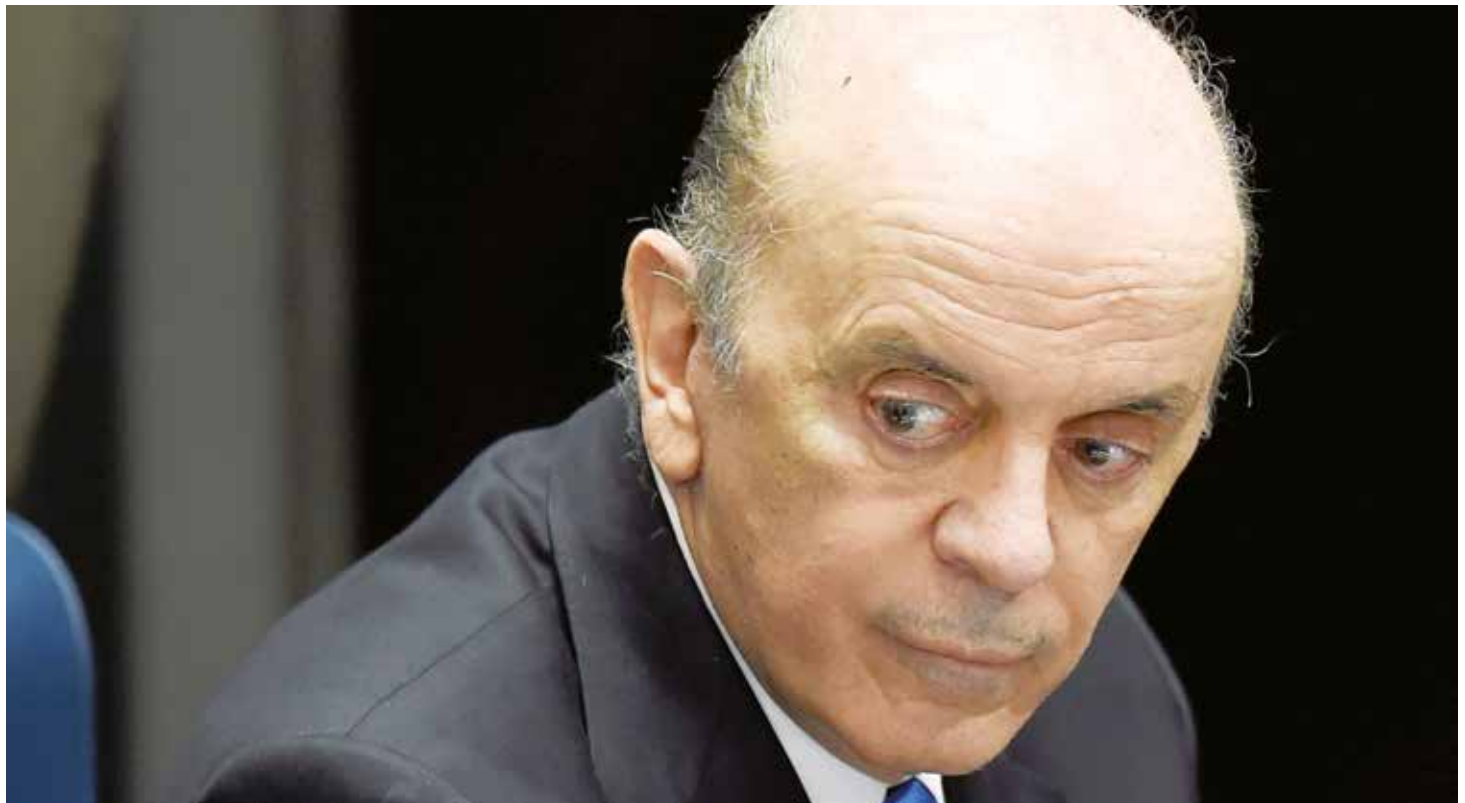
Brasil juega a la diplomacia oscura.

Propio de la politiquería de oficio, fatua, vacía, poco proba en los asuntos de la conducción del Estado, lo que se pone en evidencia es la escasa capacidad que demuestran estos pseudo líderes para hacer una verdadera política exterior que integre al continente latinoamericano en función de los intereses nacionales y regionales ahora tremendamente cuestionados en el seno del Mercosur por las calenturientas acciones de la triple alianza. No se trata ni debe tratarse de cuál gobierno o líder regional se “quede” con el martillo del Mercosur, se busca fortalecer al bloque como instrumento de política exterior a escala regional. Instrumento geopolítico de excepcionales cualidades frente a eventuales negociaciones comerciales con otros bloque de poder a nivel global. Debilitar al Mercosur significa debilitarse a sí mismos. Eso lo saben perfectamente bien los recién instaurados gobiernos reaccionarios que forman parte del esquema de integración, solo que prefieren dinamitar al esquema, antes que compartirlo democráticamente con países de tendencias ideológicas disímiles, en sustancia, la típica actitud histórica de la derecha reaccionaria nuevamente de manifiesto.