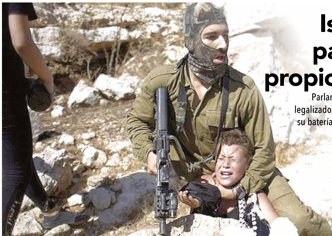
La UNICEF no se ha pronunciado contra los abusos contra los niños palestinos.

Parlamentarios israelíes no solo han legalizado la tortura, ahora apuntan toda su batería represiva contra niños y niñas palestinas de solo 12 años