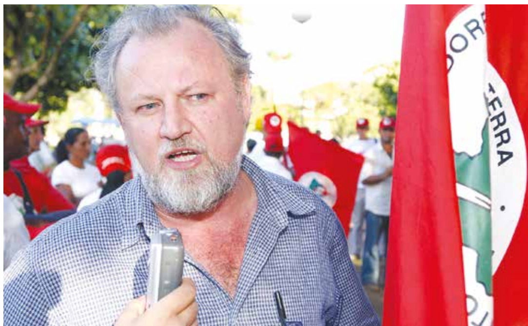
"Temer además de golpista e ilegítimo, es totalmente provisorio".

Temer cerró el Ministerio de Desarrollo Agrario, por donde pasaban todas las políticas públicas hacia la agri-