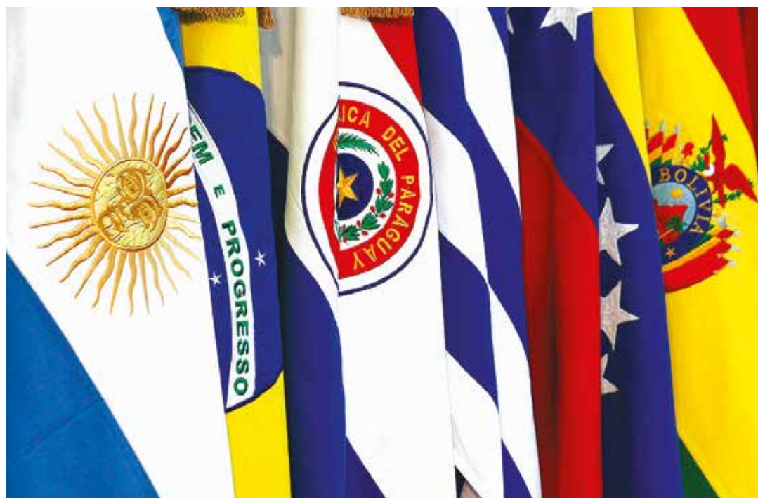
Se busca el desmantelamiento de la estrategia integracionista.

Mercosur constituye un mercado de aproximadamente unos 300 millones de consumidores si contamos las poblaciones de sus países miembros, un potencial mercado que hasta ahora se había manejado dentro de los esquemas de mercado común que beneficiaban con tasas arancelarias preferenciales a los productos de los países miembros frente a terceros. Con la llegada de los gobiernos de izquierda, el Mercosur necesaria y concienzudamente comenzó a incorporar criterios sociales dentro de sus políticas comerciales, tales como la creación de un fondo para ayudas sociales, la creación de una universidad para pensar la integración regional, no solo como propuesta