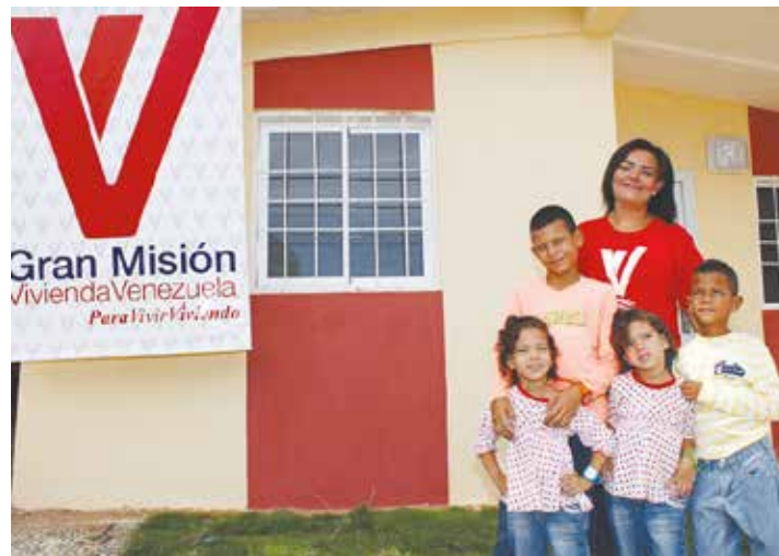
La Gran Misión Vivienda Venezuela es un ejemplo.

¿Sabían que según cifras de la FAO en Venezuela hay menos mal nutridos, es decir gente que pasa hambre, que