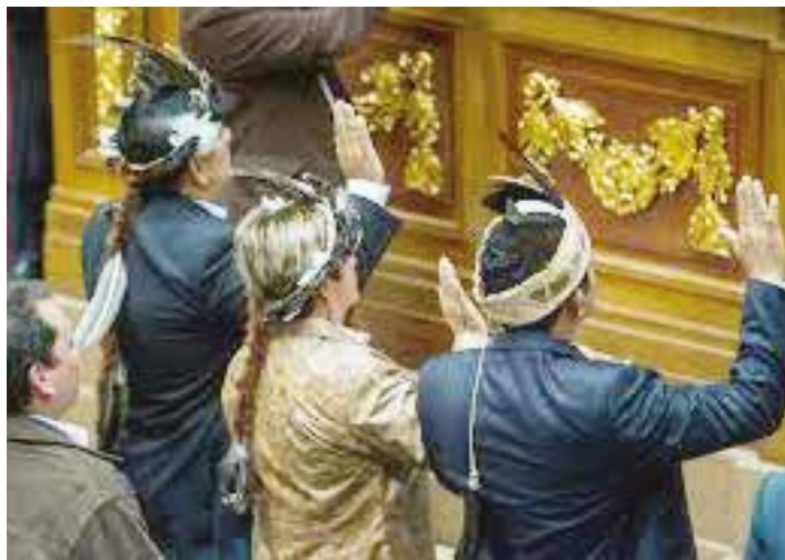
Pretenden desconocer a los poderes públicos.

A partir de aquella desmesura de Allup de “los seis meses de gobierno de Maduro”, las alarmas bolivarianas se encendieron, pues cumplir con ese ofrecimiento solo era posible con un golpe de estado clásico,