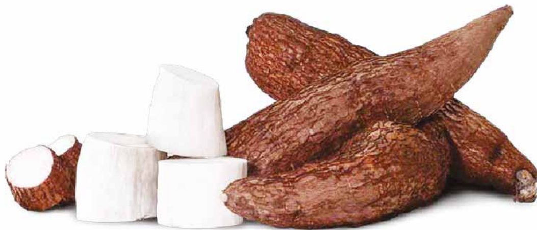
La yuca es rica en energía.

Es realmente benéfica para el sistema nervioso, disminu-