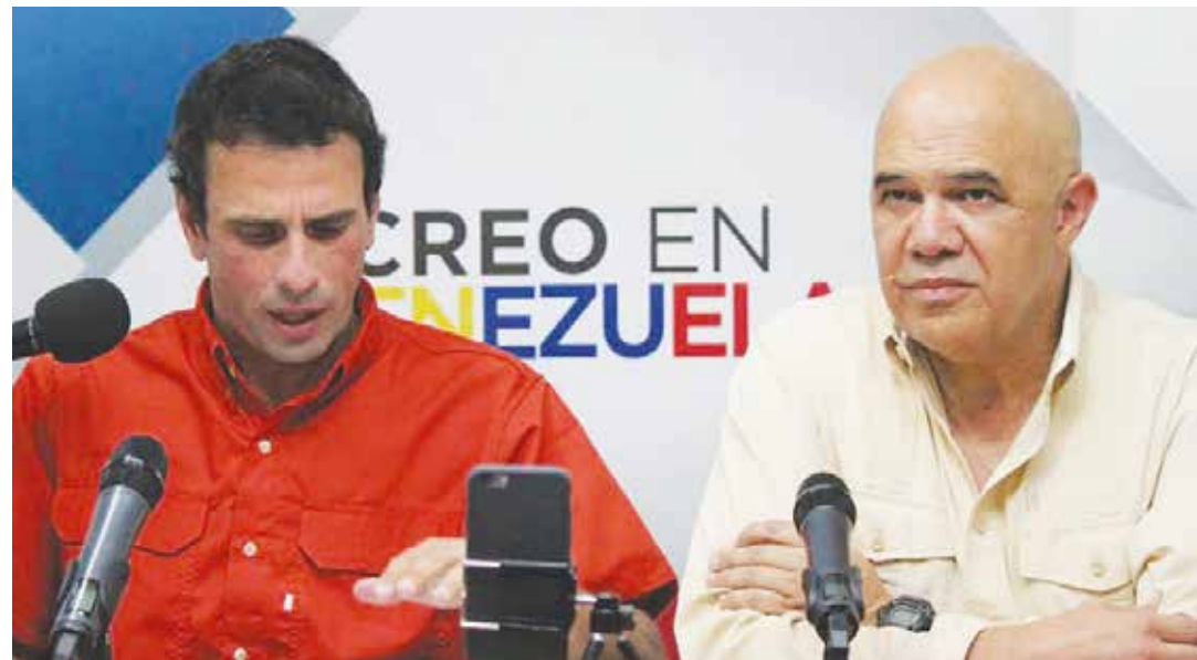
Se les cierran las salidas y apelan a la violencia.

De lo contrario, se activaría una operación de intervención militar, seguramente precedida de otras de falsa bandera y desarrollo simultáneo, como serían un supuesto y mediático alzamiento de alguna unidad militar venezolana –al estilo “Plaza Verde de Libia”, con actores contratados personificando a altos mandos incluidos y filmación fuera de Venezuela– contra el Gobierno del presidente Maduro, acciones “masivas” de violencia guarimbera y supuestos ataques del “chavismo violento” –paramilitares disfrazados como tales– contra una “pacífica” y “democrática” oposición. •