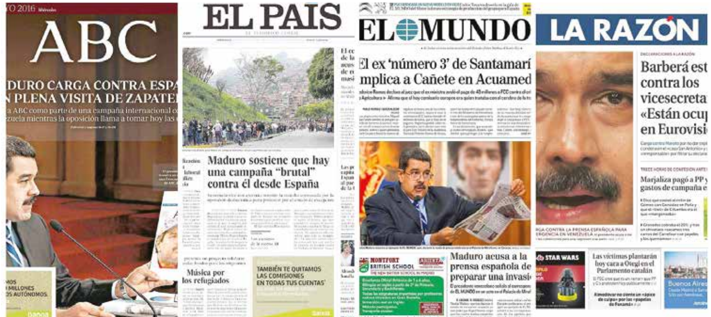
Medios españoles tienen una campaña constante contra Venezuela.

II Vamos al territorio de guerra, la persistente sed en los reales escenarios de combate acompañados del olor a pólvora, humaradas intensas y gritos humanos, abandono, muerte, destrucción, y en medio de la confusión esa realidad es reflejada en los medios de comunicación para supuestamente informar y manipular las tragedias humanas, originadas por los mismos creadores y dueños de los medios de comunicación de todos los tiempos. Las razones de las guerras, son reservadas para densos ensayos, las imágenes se difunden veloz y masivamente, son las que intentan justificar las razones de los poderosos, con el paso de los meses la neblina de la guerra, también dificulta la comprensión del caos mundial, la orfandad de la invasión criminal aparece en escena, miles de familias a modo de multitudes errantes caminan por Europa, son testigos del horror de un Imperio que no