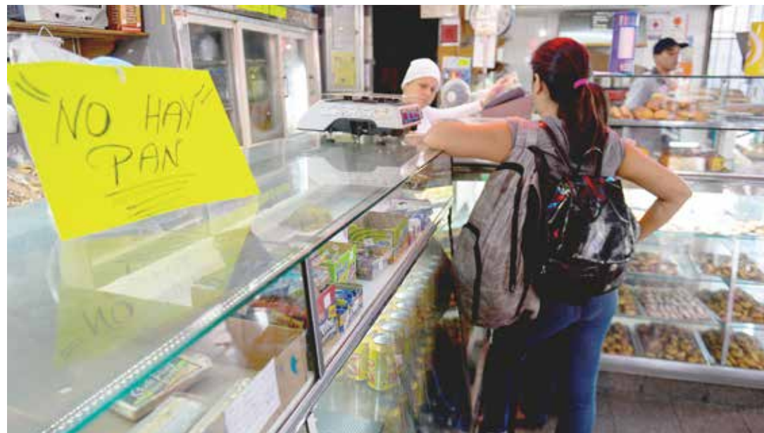
Las panaderías son el nuevo frente de la guerra económica.

La lucha contra el hambre es la tarea fundamental de todos los trabajadores conscientes