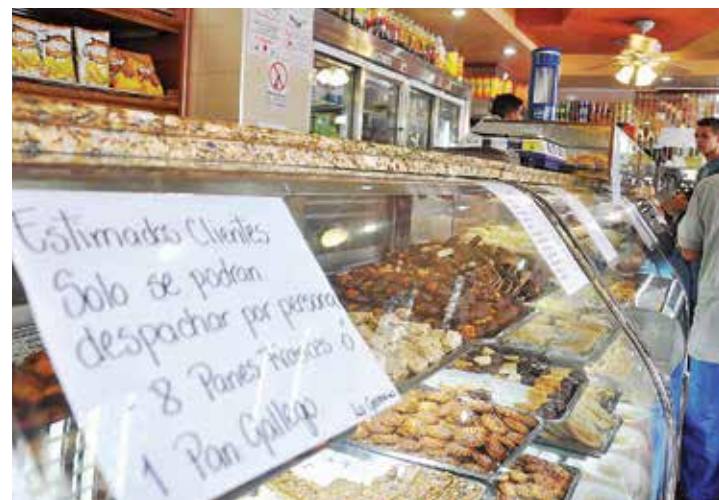
No hay pan canilla, pero sí dulces.

Sabemos que los dueños del pan se instalaron hace años en el país. Rodríguez lo conocía muy bien: “El pueblo ve llegar, de mar afuera, un refuerzo de enemigos que inundan el país y le toman las mejores posiciones”. ¡Organicémonos, combatamos y saquemos a los mercaderes del pan! •