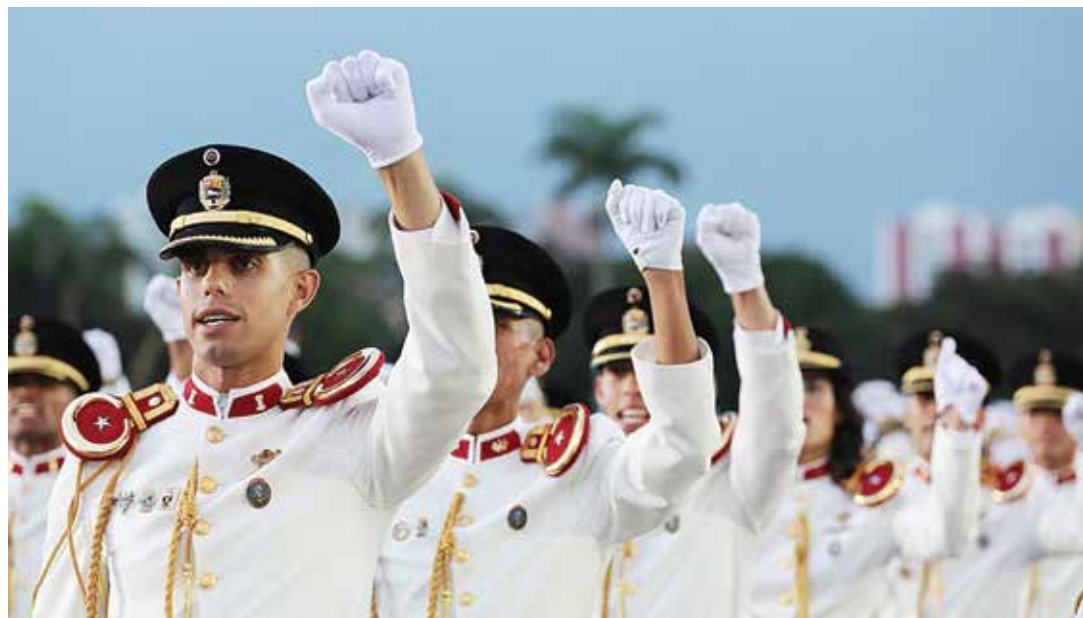
La FANB es expresión del pueblo en armas

Considera que en Venezuela se ejecutan los manuales del perfecto golpe de estado, en donde se explican las estrategias para derrocar gobiernos sin usar las fuerzas militares, que sería su última carta, por eso se recurren a operaciones psico-