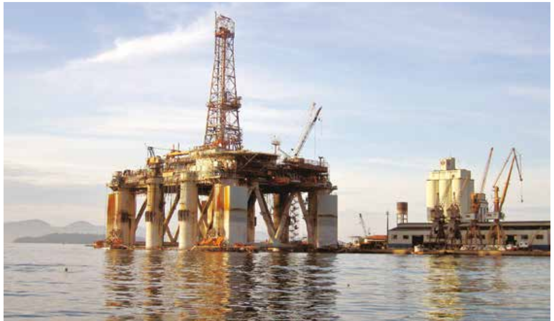
Las inversiones costa afuera son inviables con los actuales precios.

Las empresas petroleras estadounidenses, e incluso las británicas que operan el petróleo del Mar del Norte, bajaron