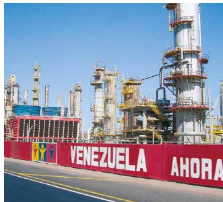
La industria petroquímica es una importante generadora de empleos.