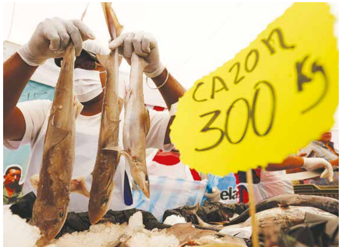
El nuevo modelo fortalecerá a la pequeña y mediana industria.

Sostiene que pese a la negativa opositora de aprobar el Decreto de Emergencia Económica, el Ejecutivo deberá asumir medidas especiales ante la coyuntura actual. •