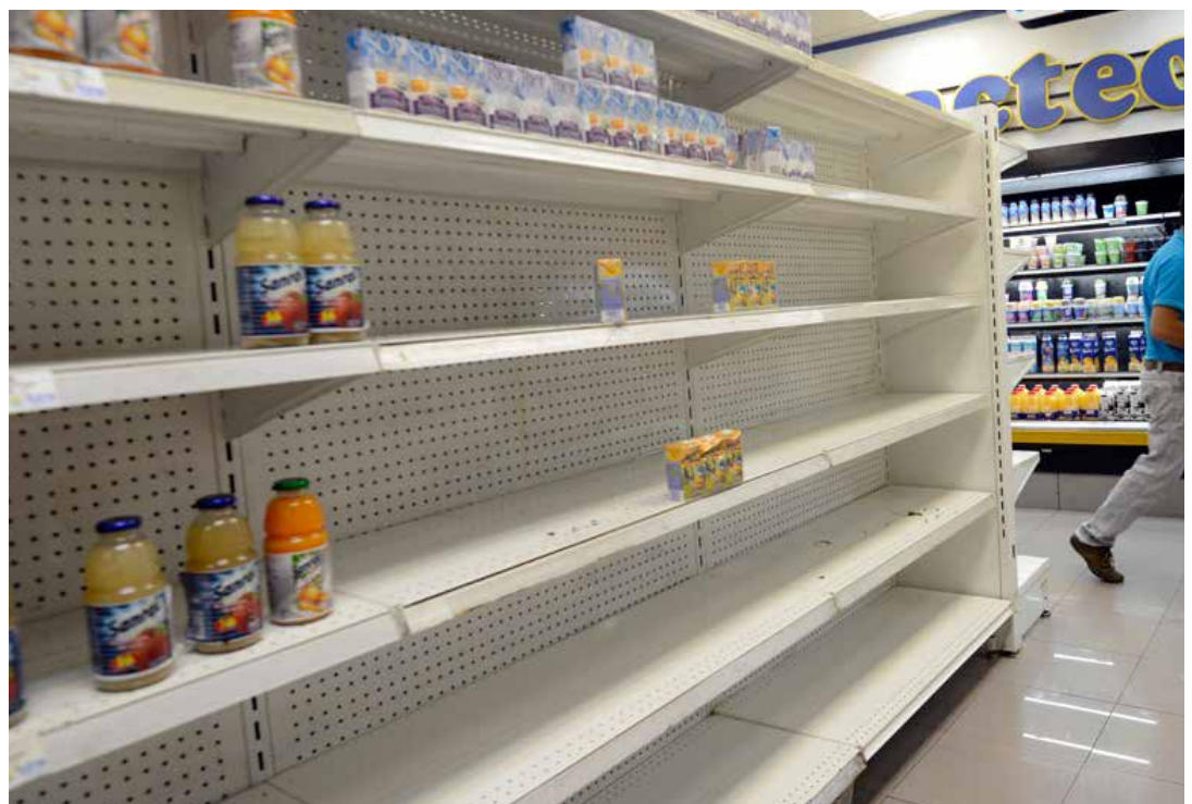
La huelga de inversiones empresarial produce desabastecimiento.

“ La Revolución Bolivariana se abre paso a circunstancias excepcionales en lo económico, entendiendo que sobre tales circunstancias yace una oportunidad que, de consolidarse, puede crear las bases a un nuevo