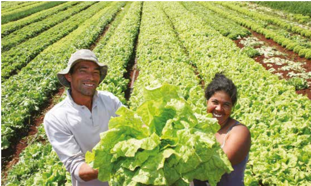
Se debe avanzar hacia la soberanía agroalimentaria.