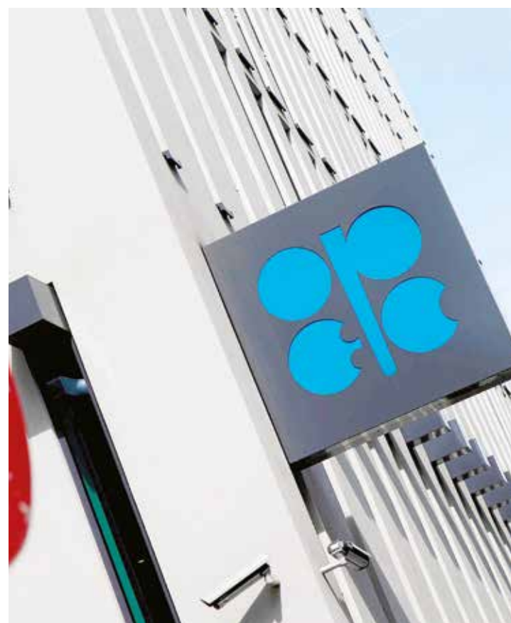
Se dificulta acuerdo en la OPEP.

EE.UU ha usado el fracking contra Rusia, Venezuela y otros países, y es lo que explica el porqué Washington ha seguido subvencionando a la industria ante las pérdidas que significa"